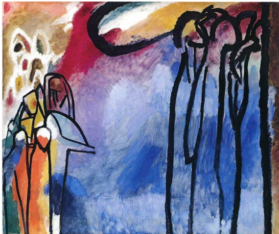
5. VASILIJ KANDINSKY: Improvizacija 19 , 1911. Munich, Städtische Galerie

3) Vasilij Kandinski, improvizacija 19, 1911.