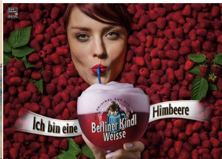
Slika 3. Reklama berlinske pivovare za voćno pivo