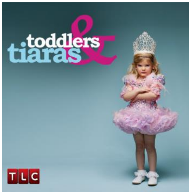
Slika 7. „Toddlers & Tiaras“, natjecateljska emisija izbora ljepote za djecu

Na kraju postavlja se pitanje direktne odgovornosti samih medija i zakona o medijima. Treba li možda prioritete rejtinga gledanosti pojedinih sadržaja, kojima se rukovode posebice komercijalni mediji u svrhu uspješnosti njihovog marketinškog trženja, svesti pod preciznije i jasnije definirane kriterije što zakonski može biti dopušteno, a što ne? (Hromadžić 2010, 626).