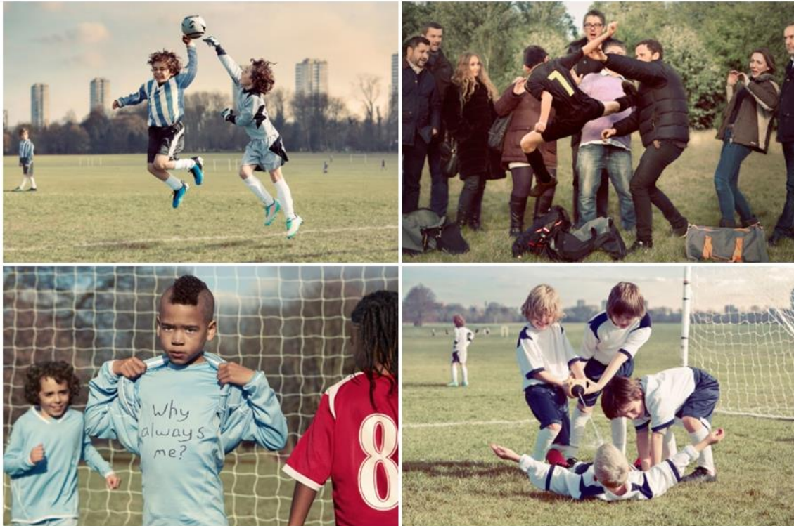
Slika 5. Dječaci u ulogama svjetskih nogometaša povodom dizajnerske kampanje agencije „Daz and Tom“

„Željeli smo u kampanji pitati je li nogomet u kojem je sve više kontroverzi i koji danas od nogometaša stvara celebrity način života može i dalje stvarati uzore našim mladima. Stvara li nogomet zapravo od djece loše momke?“, objasnili su iz dizajnerske agencije, zbog čega su pokrenuli ovu kampanju, koja je izazvala veliko zanimanje diljem svijeta. Djeca su, naime, na brojnim društvenim mrežama dobila brojne pohvale, a kampanja je izazvala i brojne rasprave (Lacković, 2015).