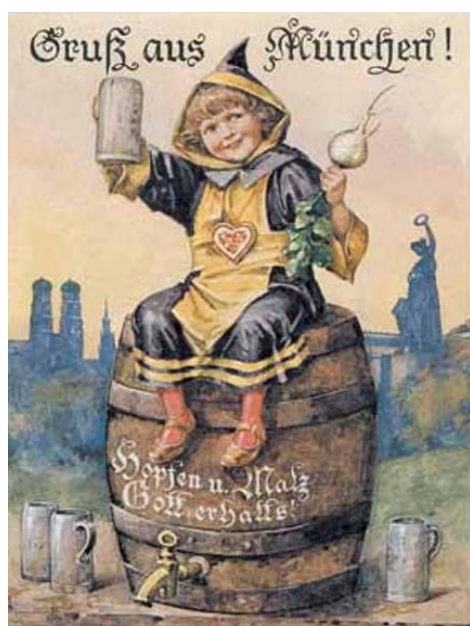
Slika 2. Duhovita razglednica Minhenskog djeteta (Münchner Kindl)