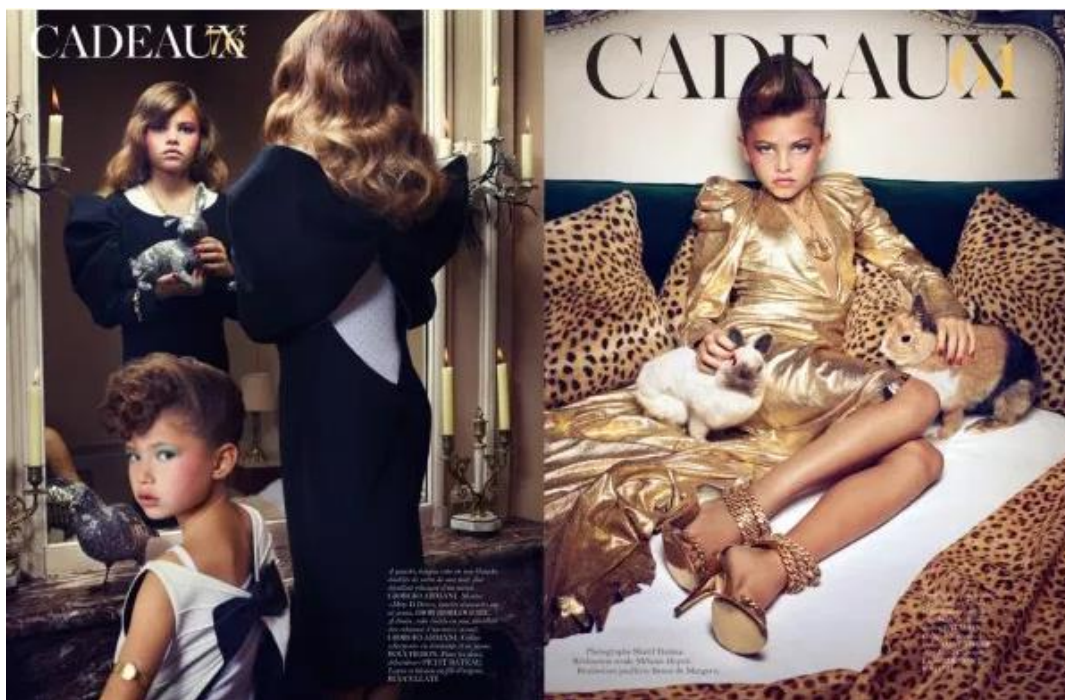
Slika 4. Modni editorijal seksualiziranih djevojčica u magazinu Vogue