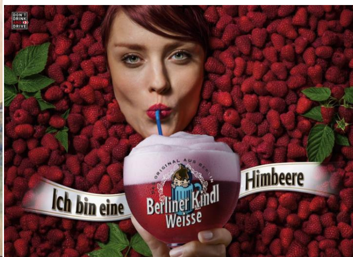
Slika 3. Reklama berlinske pivovare za voćno pivo