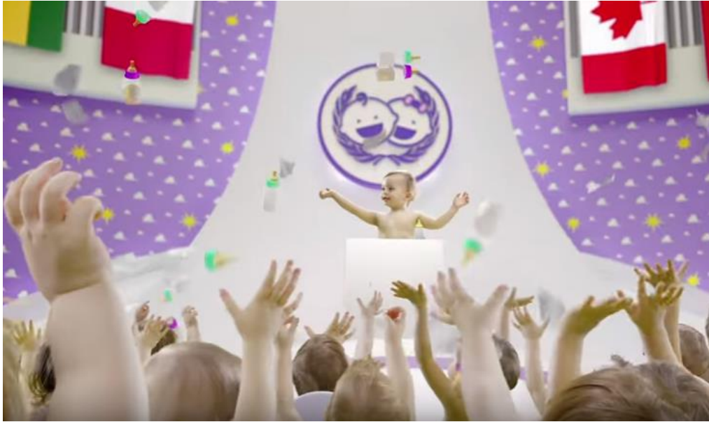
Slika 1. Televizijska reklama za Violeta pelene