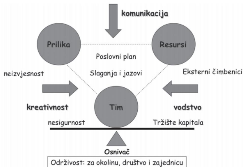
Slika 1. Elementi potrebni za pokretanje poslovnog poduzetničkog pothvata