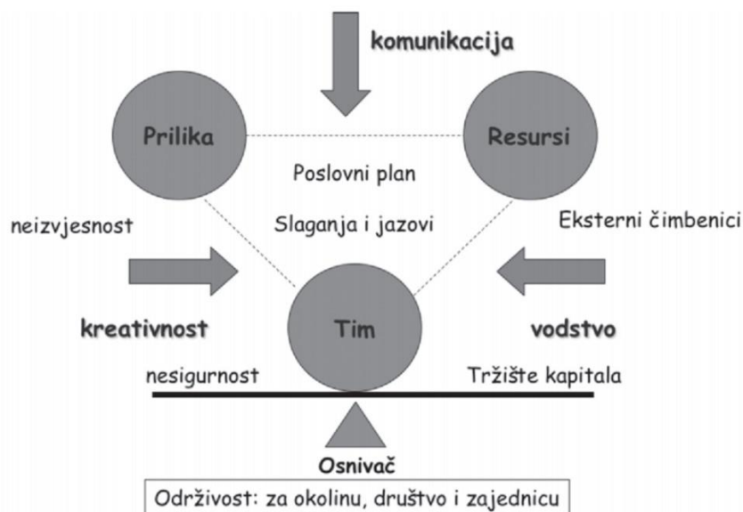
Slika 1. Elementi potrebni za pokretanje poslovnog poduzetničkog pothvata

Izvor: preuzeto u cijelosti (Delić et al., n.d.:8)