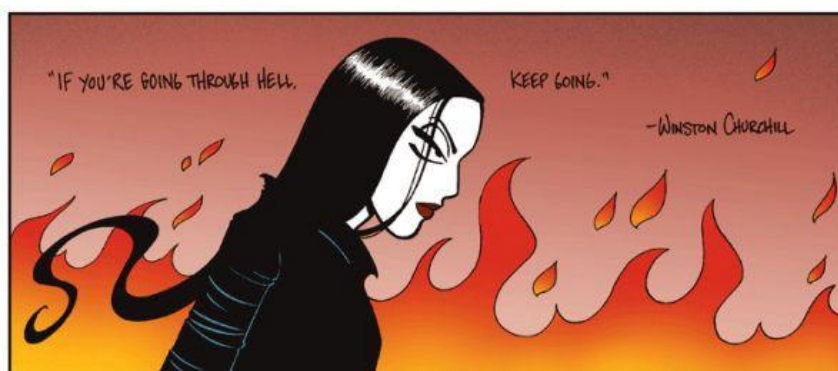
Slika VIII. Lise Myhre, fragment iz strip serijala Nemi , 2010.

Lise Myhre također je ilustrirala pjesme Edgara Allana Poea i Andréa Bjerkea.