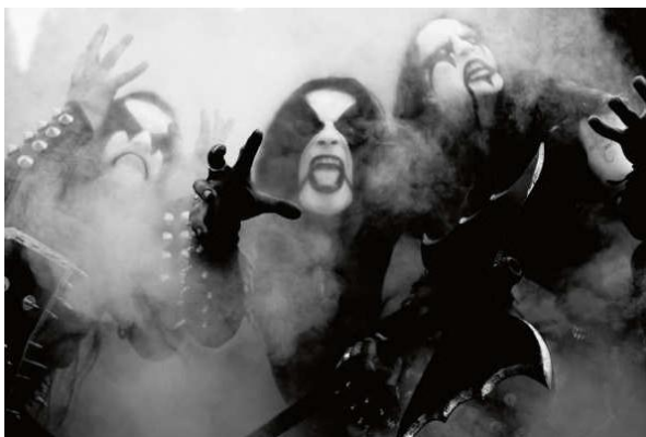
Slika V. Norveški black metal bend Immortal , 2003.