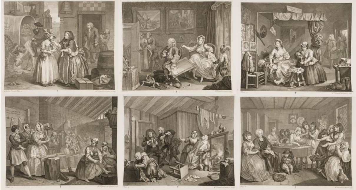
Slika II. William Hogarth, Život bludnice , 18. stoljeće

Ako ćemo pomno sagledati povijest, prvi koji se svojim ilustracijama najviše približio modernom stripu jest William Hogarth ( 1697. - 1764. ) koji je tekst i sliku objedinio u jedinstvenu cjelinu. Riječ je o seriji šest narativnih slika Život bludnice u kojima tadašnjim humorom i stilom opisuje život kurtizana.