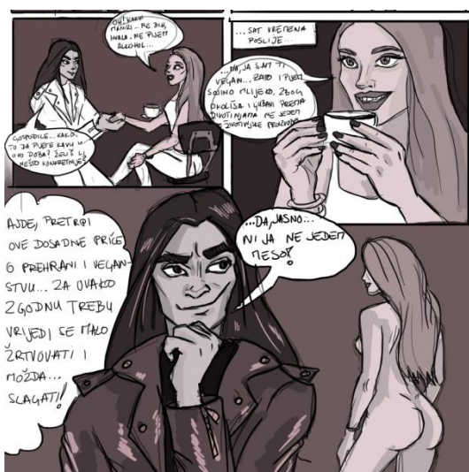
Slika X. skica table 16, Čelična čipka

U početku same izrade, odlučila sam raditi strip tradicionalnom tehnikom, odnosno tušem, bez dodatnih boja. Međutim, vrlo brzo sam shvatila da sama priroda tuša nije previše pogodna za nekakve velike korekcije, a vrijeme koje imam za sam rad je ograničeno. Kako ne bih sama sebi previše komplicirala izradu, prebacila sam svoj rad na digitalni medij, Photoshop . Što se tiče samih tehnika, tradicionalna i digitalna tehnika imaju svoje prednosti i mane. Kod tradicionalnih crtačkih i slikarskih tehnika imamo bolju kontrolu poteza i nanošenja količine tuša ili boje te uz to imamo prisutnu i taktilnu stranu rada. S druge strane, tradicionalne tehnike zahtijevaju dugotrajniji proces izrade, a greške su većinom nepopravljive. Digitalne tehnike, kao što je Photoshop , rade na principu kolaža, jer nam omogućuju da svaku novu stavku na istome papiru radimo u zasebnom, odnosno novom layeru . Samim time korekcije su znatno brže i jednostavnije, ali, s druge strane, kontrola poteza je puno zahtjevnija te se gubi taktilno osjetilo, koje je postojeće kod tradicionalnih crtački i slikarskih tehnika. Nakon odabira tehnike, počela sam raditi strip brzim skicama, koje sam kasnije temeljito tuširala, ali ipak sam ostavila vidljive tragove skica kako bi crtež djelovao slobodnije. Sljedeća stavka, bilo je bojanje pozadina u svim tablama, a kao zadnju stavku ostavila sam koloriranje i sjenčanje.