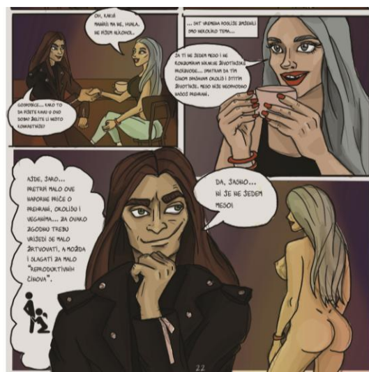
Slika XI. finalizirana tabla 16, Čelična čipka