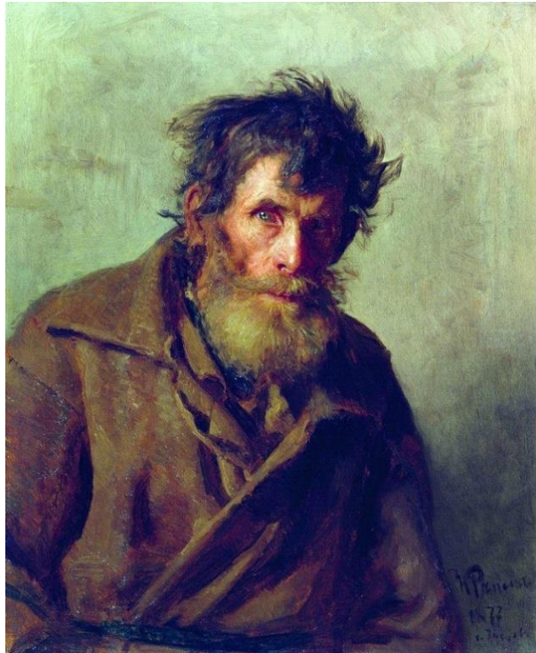
Slika 2: Ilya Efimovich Repin, Sramežljivi seljak, 1887. 65x54 cm, ulje na platnu, Museum of Fine Arts, Rusija

Slika 2 prikazuje portret seljaka koju je naslikao jedan od najboljih ruskih slikara 19. stoljeća Ilya Repin. Slika nije autoportret, ali je po meni odličan primjer prikaza stajališta jednog čovjeka. Portret sramežljivog seljaka puno govori o umjetniku. Impresivan je način rješavanja pozadine i ulaska u prostor. U sjenama koristi puno plave boje, a u najsvjetlijim dijelovima (lice) koristi debele slojeve toplih tonova. Na slici je najupečatljiviji njegov pogled koji nam govori o teškom životu. Gledajući kaput možemo pretpostaviti da se vjerojatno bavio poljoprivredom i teškim radom. Na njegovom isklesanom licu možemo primijetiti posljedice rata i nepravde.