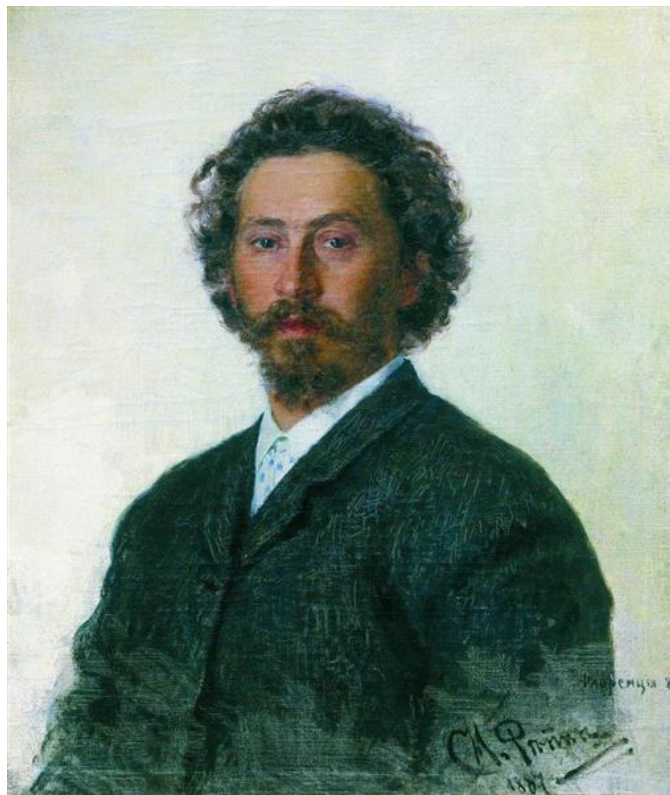
Slika 3: Ilya Repin, Autoportret, 1887. 75x62 cm, ulje na platnu, Tretyakov Gallery, Moskva, Rusija

realizma u Rusiji. Osim portreta, slikao je žanr scene iz tadašnjeg života, scene iz rata, robove i vladare, društveni život ljudi.