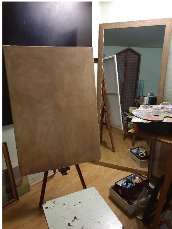
Slika 6: pripremljena kompozicija

Sliku sam započeo grubo, brzo, sirovo, u što slobodnijim potezima pri tome pazeći na svoj karakter, bez uljepšavanja.