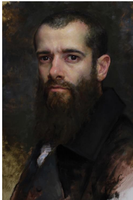
Slika 4: Cesar Santos, Autoportret, 2015. ulje na platnu, dimenzije nepoznate

Kao trećeg slikara odabrao sam suvremenog umjetnika Cesara Santosa. Njegov rad pratim od drugog razreda srednje škole kada sam počeo slikati; prve radove ulja na platnu. Naime, Cesar je rodom iz Kube. U svojim dvadesetim godinama počeo se baviti boksom, ali njegova prava strast je oduvijek bila slikanje realizama, na svoj poseban način, kombiniranjem tradicionalnog i modernog. Zbog roditelja i njihove želje za školovanjem, kako bi prema riječima njegovoga oca mogao normalno živjeti jer od „umjetnosti nema kruha“, upisuje arhitekturu. Pokazujući svoj talent i interes za slikanjem, uspješno upisuje i Angelovu akademiju likovnih umjetnosti u Firenci koja je dobila ime po svome osnivaču Michaelu Johnu Angelu (Angel Academy of Art) koji mu je ujedno bio i mentor. Uz puno muke i truda polaže sve zaostatke i diplomira slikarstvo. Njegova priča me je motivirala, ali i način na koji je slikao te jednostavnost rješavanja kompliciranih portreta. Ovdje bih spomenuo kako sam ja također išao u školu koja nije imala veze s umjetnosti, ali me životni put usmjerio na Akademiju.