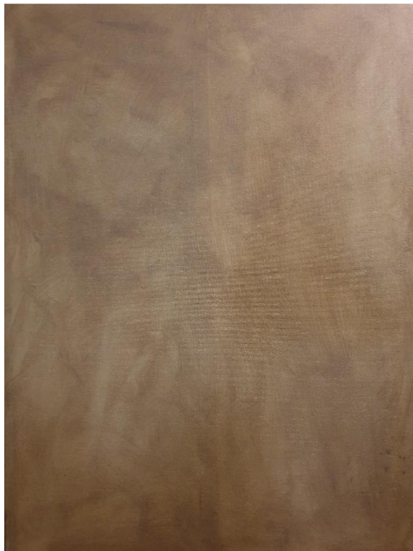
Slika 5: pripremljeno platno

U prvom koraku nanio sam na platno lazurni premaz te ga dodatno razmazao krpom. Time sam si olakšao posao kako ne bih slikao direktno preko bijele podloge (slika 1.). Postavio sam platno na štafelaj, okrenuo se prema ogledalu te si namjestio stolicu kako mi je najbolje odgovaralo. (slika 2.)