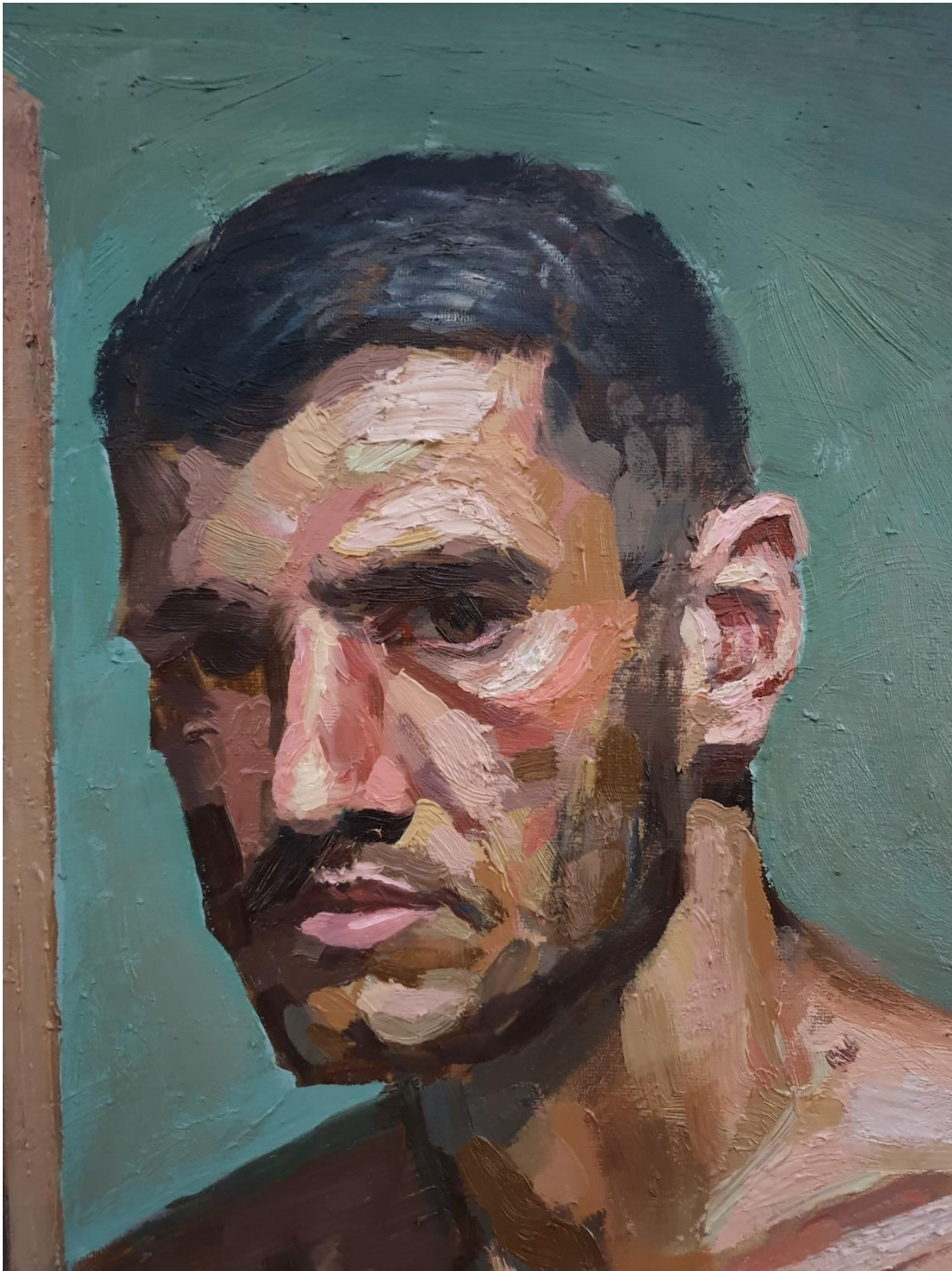
Slika 14: detalj glave