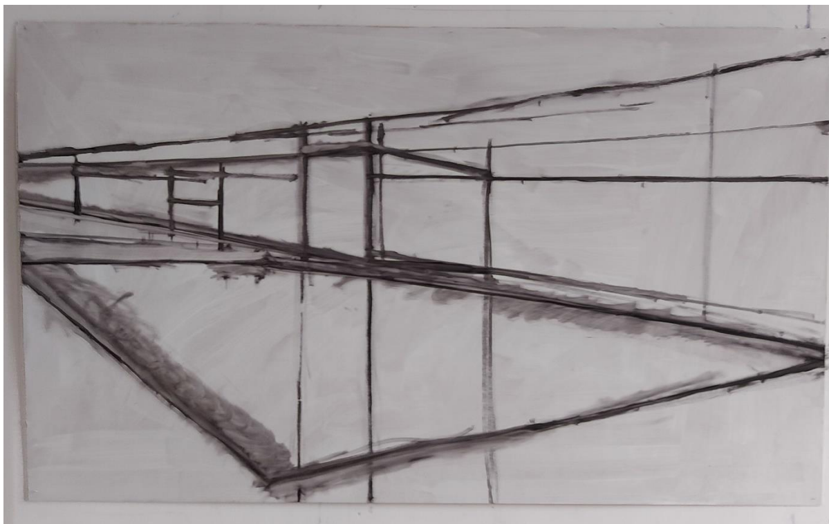
Slika 8. Proces izrade rada 1/3