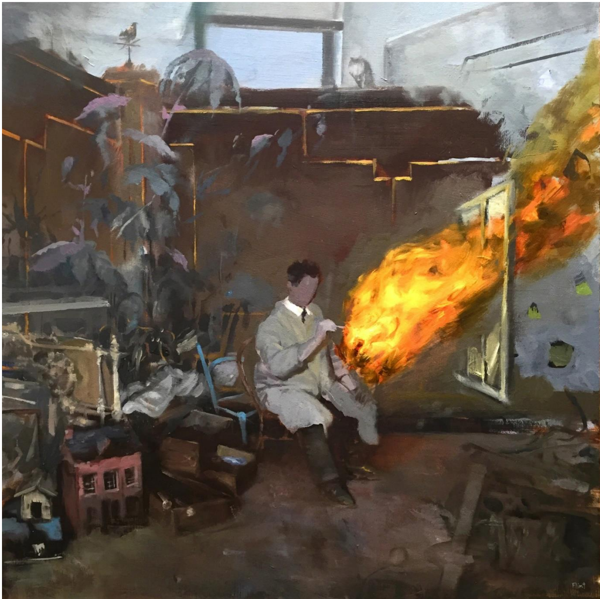
Slika 3. Joshua Flint, „Even in the Dim Light, ulje na drvenoj ploči, 18x18 inča

Joshua Flint je slikar iz SAD-a čija je temeljna preokupacija surealizam. Završio je umjetničku akademiju u San Francisku. Često na svojim slikama prikazuje nejasne, nerealne situacije koje zbunjuju promatrača, te ih često prepušta slobodnim naracijama koje obrađuju nejasni teritorij. Zato koristi puno bijele i crne u tonovima boja tako da „ubije“ kolorit, najčešće koristi hladne tonove te nejasne maglovite plohe. Tematike kojima se bavi su sjećanja, ekološki problemi, identitet i gubitak. Često koristi fotografije događaja kao predložak radi emocionalne povezanosti. Za razliku od mene, njegova djela nas vode u nadrealni svijet, u gotovo pa potpuno neprepoznatljivu dimenziju.