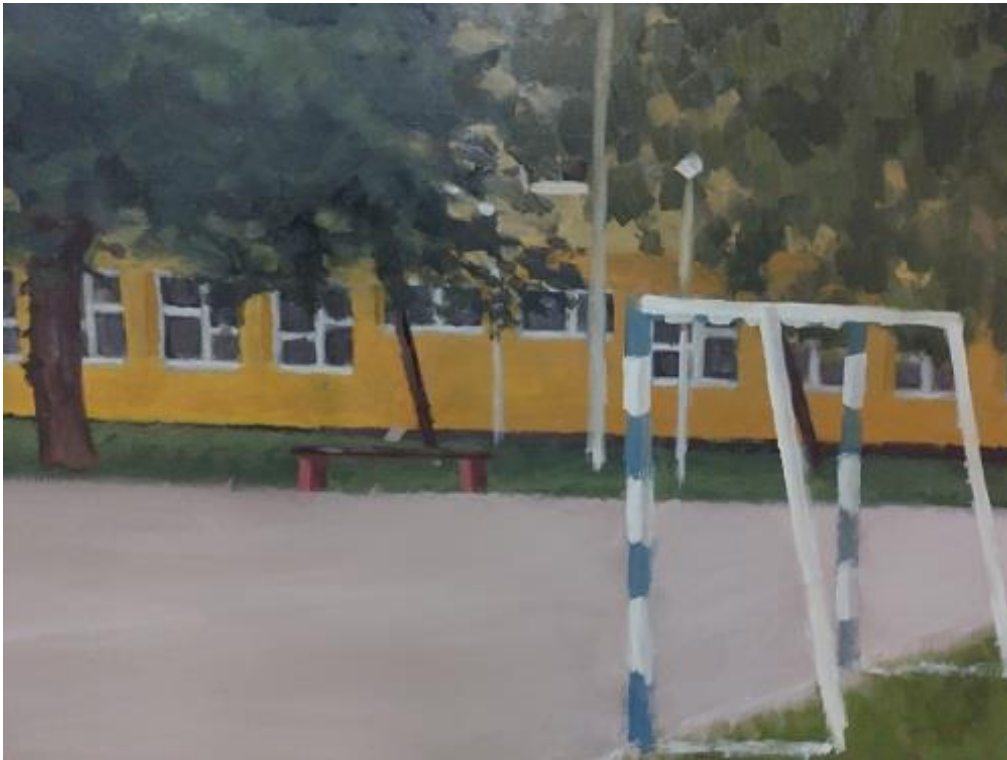
Slika 15. Detalj rada “Školsko igralište” 3/3