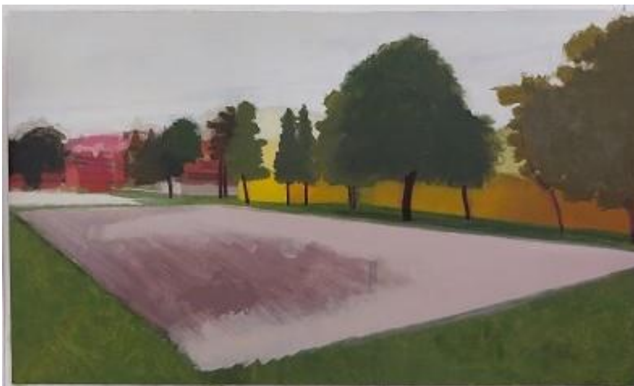
Slika 9. Proces izrade rada 2/3