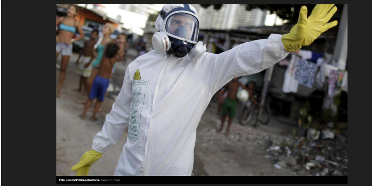
Zika virus, Brazil