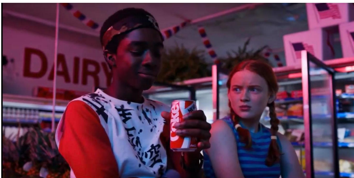
Slika 4: Prikazivanje nove Coca Cola u seriji Stranger Things (snimka zaslona) 12

Ostvarivanje uspješne reklame proizvoda ili tvrtke putem serije Stranger Things moguće je zbog velikog doseg koji je serija imala, posebno u trećoj sezoni. Kako je izvijestila platforma Netflix , premijeru treće sezone serije pratilo je preko 40 milijuna korisnika. Prema web stranici Concave Brand Tracking u trećoj sezoni serije Stranger Things zabilježeno je preko 100 različiti marki u osam epizoda treće sezone. Brendovi se pojavljuju u obliku 45 različitih proizvoda od koji su pet najčešćih bili automobili, pića, obuća, trgovine i hrana. Slika 5 prikazuje koje su se marke najviše spominjale u svakoj epizodi treće sezone serije, dok slika 6 u postotcima prikazuje zastupljenost određenih vrsta proizvoda te imena marki tih proizvoda.