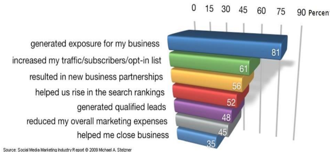
Slika 6 Prednosti marketinga na društvenim mrežama