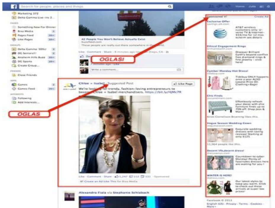
Slika 2 Primjer oglašavanja na Facebooku

Facebook je već godinama najposjećenija društvena mreža na svijetu, a trenutni broj korisnika kreće se oko 2.6 milijardi. (tportal.hr)