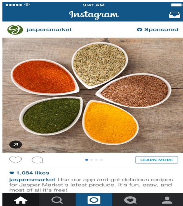
Slika 5 primjer oglašavanja na Instagramu

toga 57% bile su žene. Od tada do siječnja 2017. godine broj korisnika se udvostručio. Po podacima agencije Arbona iz kolovoza 2019. Instagram u Hrvatskoj koristi više od 1,1 milijun ljudi.