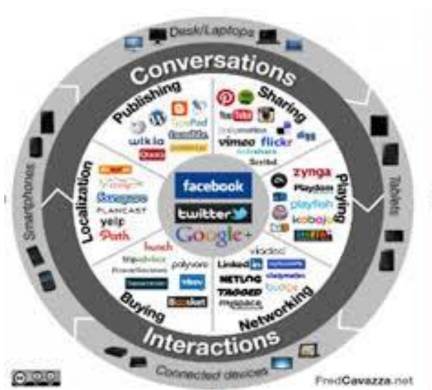
Slika 1 Komunikacijska sredstva i tehnike

Društvene mreže postoje već duži niz godina na Internet komunikacijskom prostoru, a podjelom na različite teme, ovisno o vlastitom interesu ljudi se grupiraju u skupine. Kao što je prikazano na slici 1 vidimo da se društvene mreže dijele na one za konverzacije i interakcije. Na mrežama za konverzaciju objavljuju se i dijele razni zabavni i informativni sadržaji, a mreže za interakciju služe za kupovinu i umrežavanje. Osim toga na društvenim mrežama mogu se igrati igre i dijeliti lokacije. Osim razmjene znanja, zanimljivosti i informacija, ljudi u tim grupama dobivaju osjećaj pripadnosti, samopouzdanje i sigurnost u svakodnevnom radu.