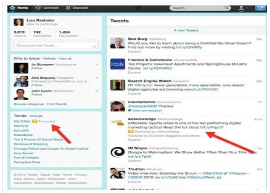
Slika 4 Primjer oglašavanja na Twitteru

Twitter je vrlo popularna mreža za objavu kraćih poruka uz popratni vizualni sadržaj ili linkove. Uglavnom okuplja populaciju srednje dobi, a oglašavanje funkcionira kao i na Facebooku: ciljana publika, plaćanje po učinku i kontrola troškova.