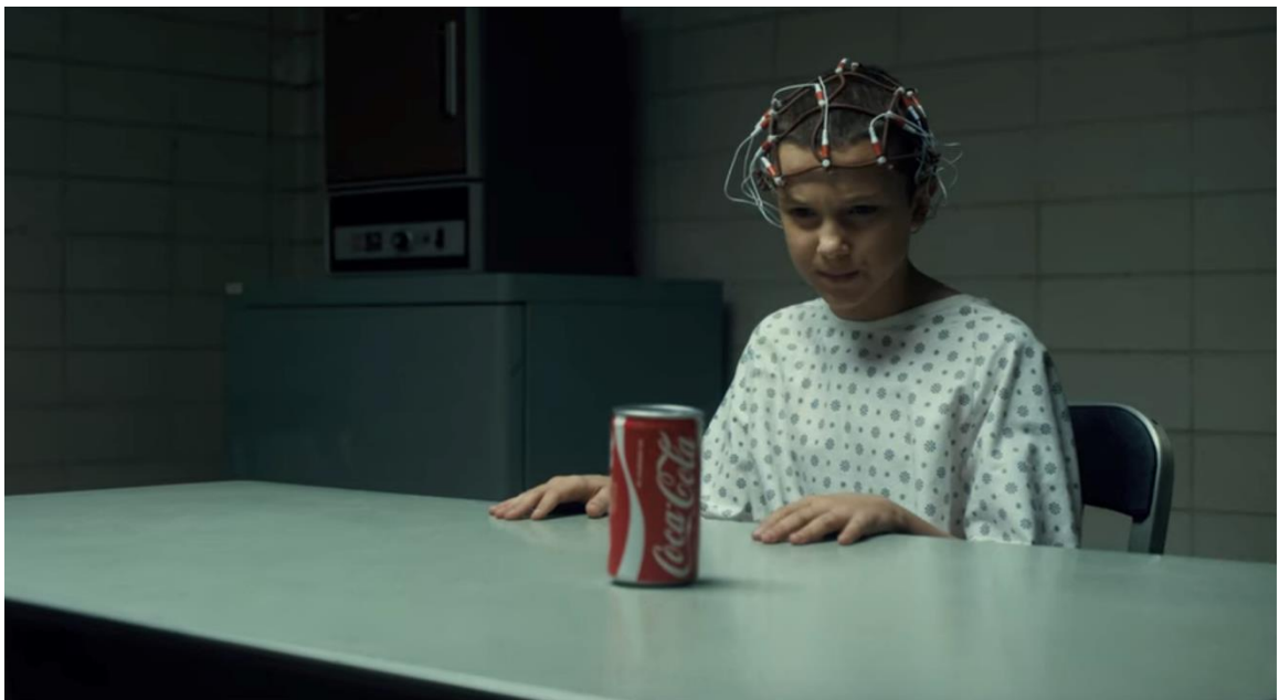
Slika 1. Primjer prikrivenog oglašavanja u seriji Stranger Things

piće istaknute marke pored voditelja i sudionika (prema Haramija, 2011). Jurišić et al. (2007) spominju jedan od prvih američkih primjera prikrivenog oglašavanja, a riječ je o crtanom filmu „Mornar Popaj“ (1929.) koji je jeo špinat kao hranu koja daje ogromne mišiće, te je tom promocijom prodaja špinata u Sjedinjenim Američkim Državama porasla za čak 30%. Jurišić et al. (2007) navode još jedan primjer prikrivenog oglašavanja koji se dogodio 33 godine nakon Popaja, a riječ je o filmu „Doktor Noa“ (1962.) gdje se pojavila marka votke i automobila. Zaključuje kako gotovo svaki poznati holivudski film u zadnjih pedesetak godina sadrži neku vrstu prikrivenog oglašavanja, do te mjere da postoji čak 20 agencija samo u Los Angelesu koje se bave prikrivenim oglašavanjem. U Hrvatskoj se nakon 1900. s komercijalizacijom i privatizacijom medijskih kuća problem prikrivenog oglašavanja sve više povećao. (Haramija, 2011) U današnje vrijeme kada postoje nove tehnologije i mediji, to je još izraženije. U posljednjih 20 godina primjere možemo pronaći s pojavom sapunica i reality showova na televiziji, na primjer Big Brother i Hrvatska traži zvijezdu te hrvatske serije poput Odmori se, zaslužio se u kojoj su se često mogli vidjeti domaći proizvodi u kadru.