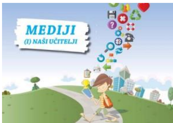
Slika 5. Brošura „Mediji (i) naši učitelji“