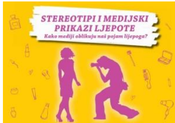
Slika 4. Brošura „Stereotipi i medijski prikazi ljepote: kako mediji oblikuju naš pojam lijepoga?

se vežu određeni načini ponašanja. Tako su recimo Afroamerikanci često prikazani kao ljudi nižeg društvenog statusa čija se djeca povezuju sa sportom ili glazbom. Latinoamerikanci se često povezuju sa nekim kriminalnim radnjama i ljepotom.