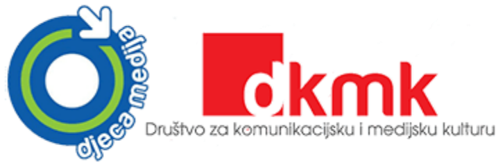
Slika 2. Logo Djeca medija i Društva za komunikacijsku i medijsku kulturu