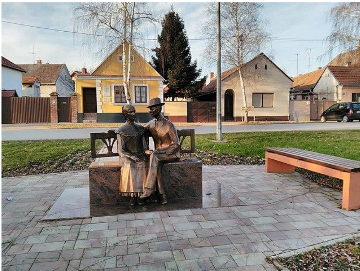
Slika 3. Rodna kuća Josipa i Ivana Kozarca

„Colonia“ u čijem su sastavu od osnutka sudjelovali Vinkovačani Boris Đurđević i Tomislav Jelić Kameni.