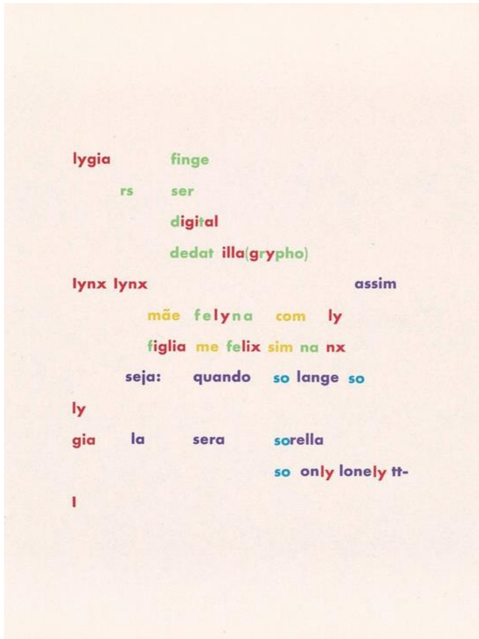
Slika 3. Augusto de Campos, lygia finge

1. Poetamenos (slika 3), pjesme koji koriste boju kao naputke za čitanje ili za klasifikaciju određenih riječi u određene kategorije.