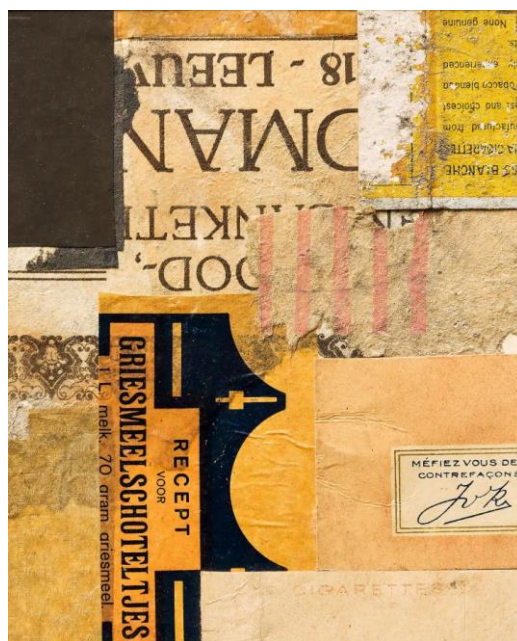
Slika 6. Thijs Rinsema RINSEMA 1925.