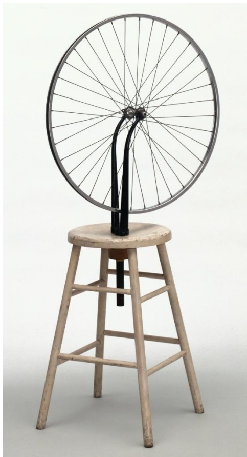
Slika 8. Marcel Duchamp , Kotač bicikla 1913.

Fontana (Vodoskok) reprezentativno je djelo likovne umjetnosti dadaizma, štoviše za cjelokupnu avangardu. Duchampova invencija pri tome predstavlja prototip ready-made skulpture, a samim time je reprezentativno za kontroverzno pitanje što umjetnost sve može biti i gdje se povlači granica između običnog civilizacijskog predmeta i umjetničkog djela. Navedeno pitanje utkano je i u samu definiciju skulptura poput Fontane te je ready-made stoga definiran kao „Djelo sastavljeno od svakodnevnih predmeta koji postavljanjem u prostor galerije dobivaju status umjetničkog djela“ (Stipetić Ćus et al, 2014: 156.). U kontekstu citatnosti takav vid izražavanja polazi od transsemiotičke citatnosti prema vrsti prototeksta gdje je citat, konkretno u slučaju Fontane , svakodnevni civilizacijski predmet koji plasiranjem u galerijski prostor prestaje biti običan predmet i postaje umjetničko djelo. Valja napomenuti kako je Duchamp i prije Fontane eksperimentirao s tom mogućnosti citiranja pa je Kotač bicikla (slika 8) prvi ready-made u povijesti likovne umjetnosti dok je Fontana prvi ready-made koji je i uknjižio taj termin (Oraić Tolić, 2019: 204).