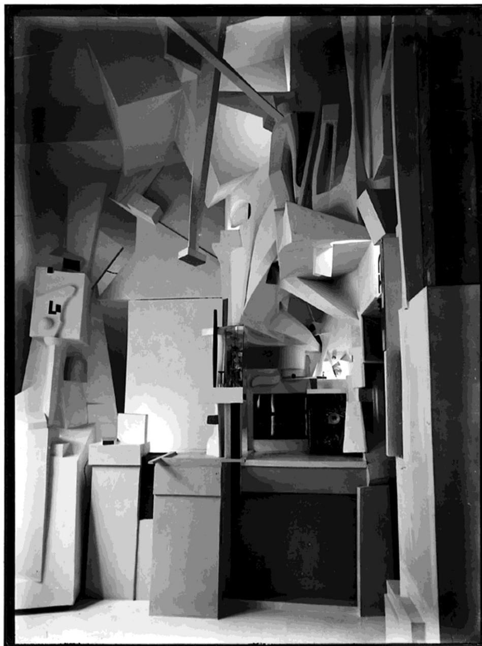
Slika 7. Kurt Schwitters, Merzbau 1923.-1933.

umjetničkim instalacijama, do industrijskog dizajna ili nešto prostornijeg kolaža. Iako površinski nadasve nepostojeća uloga dadaizma ovdje ipak postaje vidljiva u tom kontekstu prijelaznog perioda asamblaža s prostornog kolaža na zaumnu skulpturu, nerijetko humorističnog ili šokantnog karaktera.