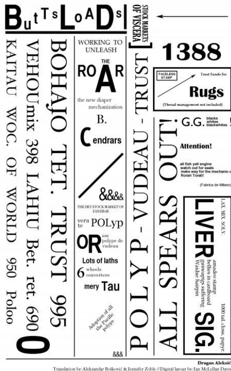
Slika 1. Dragan Aleksić, Butt's Load's

Kontrastno tom pogledu, oslanjanje na univerzalističku prirodu vizualnih podražaja, o čemu svjedoči i današnja kultura indeksa, znakova i emojia , omogućava razbijanje konotata koji su kulturno predodređeni. Primjer tome je i pjesma Jugoslavenskog (Hrvatskog) dadaista Dragana Aleksića Butt's Load's (slika 1), izvorno pisana na hrvatsko-srpskom, a u navedenoj varijanti prikazana u engleskom prijevodu Zoble i Boškovića.