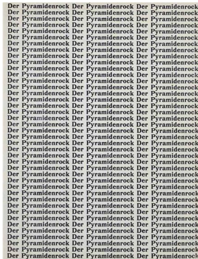
Slika 2.Hans Arp, Der Pyramidenrock

Bennett (2005: n.p.) pri tome ističe Kurta Schwittersa, dadaista likovne umjetnosti, koji naglašava vrijednost znaka, odnosno fonema u njegovoj vizualnoj strukturi, kao superiornog u odnosu na sadržaj. Schwittersova koncepcija poezije usidrena je oko selekcije oblika, debljine, izduljena, niza i gledišta slova. Takav pristup smješten je, gotovo isključivo, u domenu vizualnog i likovnosti što sa sobom povlači nekoliko različitih odlika. Prije svega „Vizualno pjesništvo od samih je svojih početaka internacionalno usmjereno. Ono je pokušalo pronaći zajednički kontekst razumijevanja, stoga se jezična liminalnost prevladavala slikom, u praksi izložbom, a ne prijevodom“ (Sorel, 2008: 100). A takvo intermedijalno tretiranje poetskog djela otvara čitav niz mogućnosti koje će se očitati u konkretnoj poeziji unutar sfere književnosti i u tipografskoj umjetnosti unutar likovne umjetnosti. Tipografska struktura koja je nerazdvojiva od konkretne poezije pa u određenim instancama čak i istovjetna, svoje početke, kao što je već i rečeno, nalazi među dadaistima. Konkretniju nultu točku konkretne poezije možemo pronaći unutar Arpova opusa u pjesmi Der Pyramidenrock (slika 2) satkanoj od mehaničke repeticije naslova djela. Takva vizualna semantika postati će fundamentalna za Brazilsku grupu te samim time i Goemringerove pjesme koje izravno povlače grafičku poveznicu prema DADI.