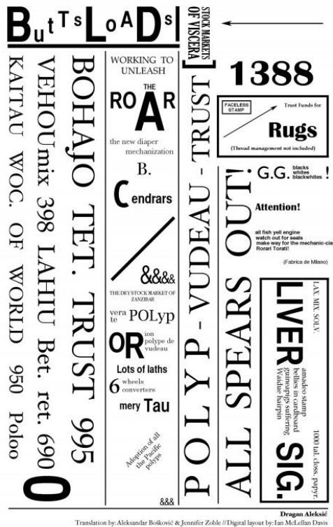
Slika 1. Dragan Aleksić, Butt's Load's

Kontrastno tom pogledu, oslanjanje na univerzalističku prirodu vizualnih podražaja, o čemu svjedoči i današnja kultura indeksa, znakova i emojia , omogućava razbijanje konotata koji su kulturno predodređeni. Primjer tome je i pjesma Jugoslavenskog (Hrvatskog) dadaista Dragana Aleksića Butt's Load's (slika 1), izvorno pisana na hrvatsko-srpskom, a u navedenoj varijanti prikazana u engleskom prijevodu Zoble i Boškovića.