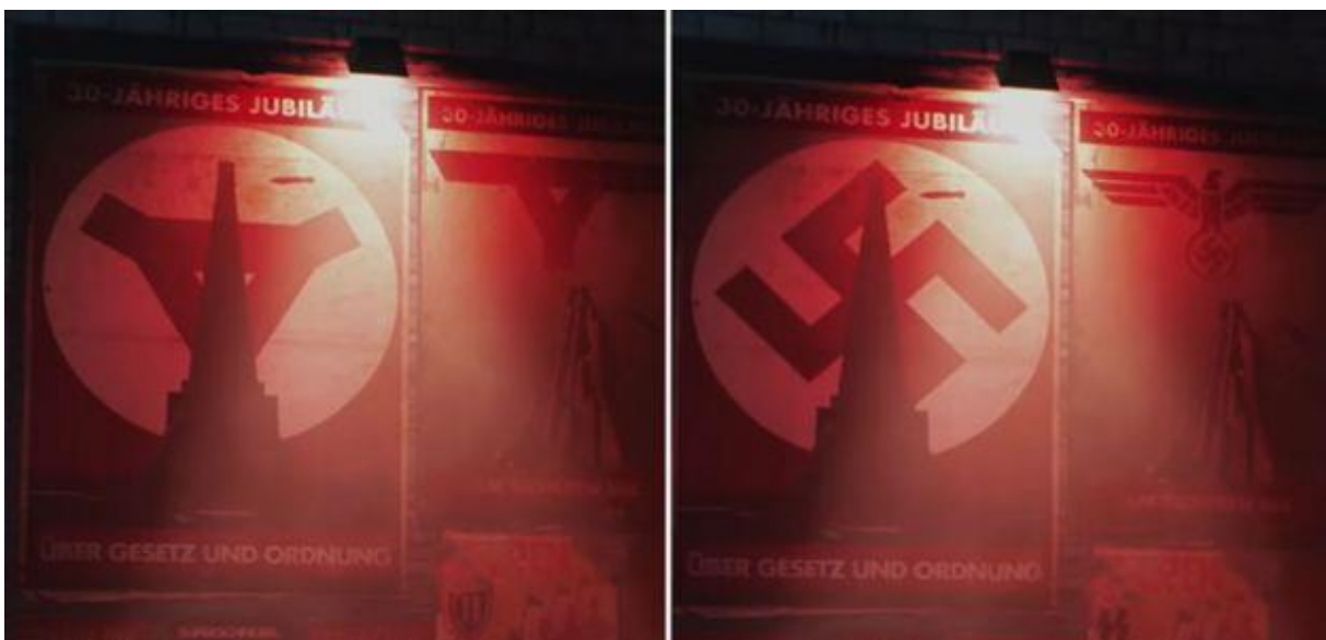
Slika 4. Wolfenstein Youngblood – zamjena nacističkih simbola s logotipom igre ili manje uvredljivim simbolima