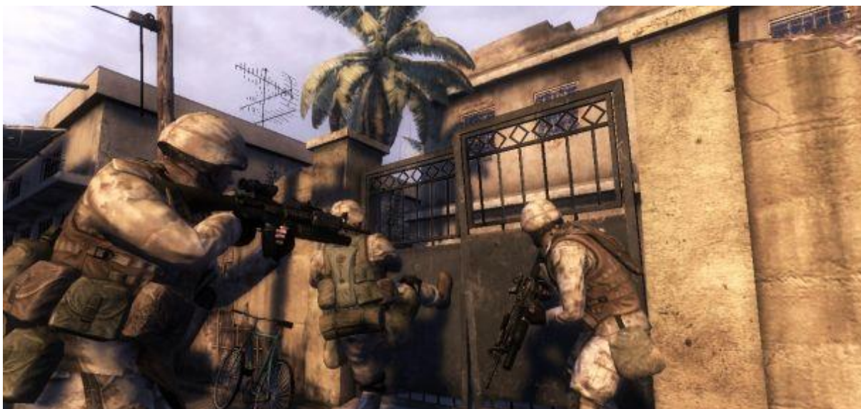
Slika 2. Six Days in Fallujah – igra koja do danas nije objavljena unatoč tome što je završena