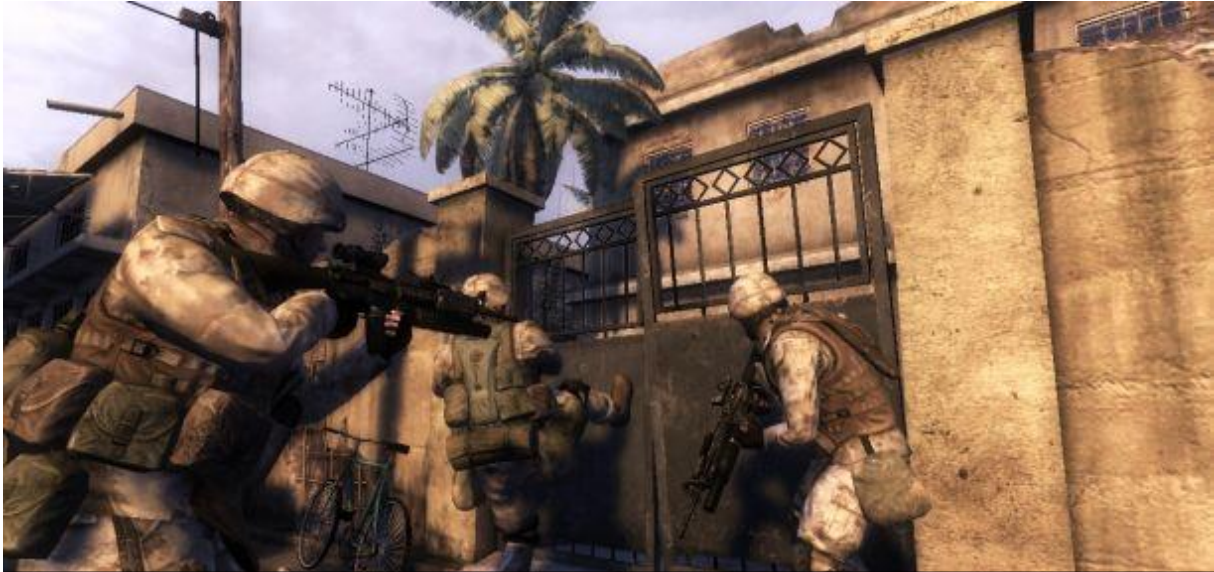
Slika 2. Six Days in Fallujah – igra koja do danas nije objavljena unatoč tome što je završena