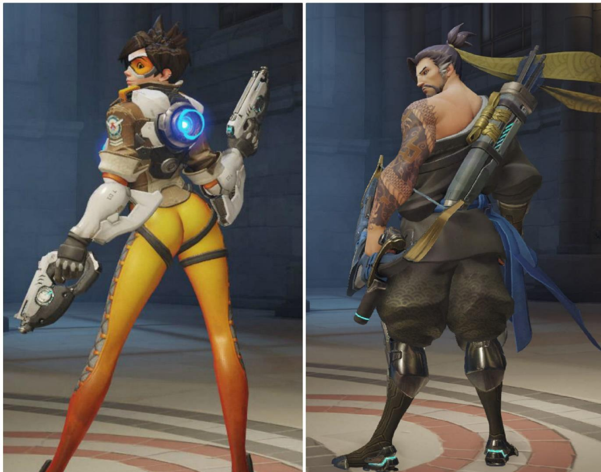
Slika 6. Overwatch – pobjednička poza Tracer i Hanza

zagovornika političke korektnosti i njihovih kolega u medijima, vladi i akademskom krugu (usp. Anonymous 3, 2016).