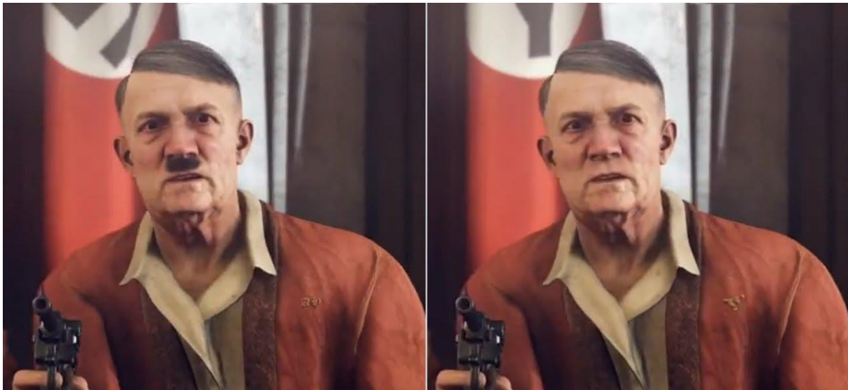
Slika 3. Prikaz Hitlera u njemačkoj verziji (desno) te u drugim verzijama (lijevo) videoigre Wolfenstein II: New Colossus