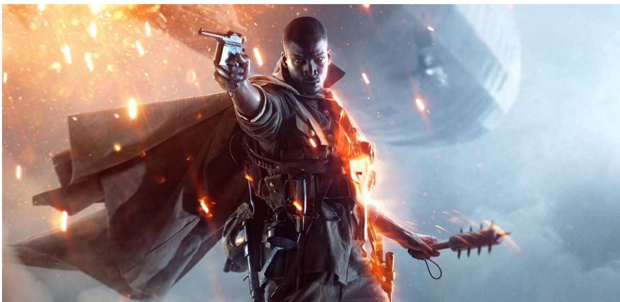
Battlefield I – naslovnica

Što se tiče Battlefield V , kod tog dijela nije problem same radnje, već je problem u zabrani pisanja određenih riječi u in-game chatu . Primjerice, unatoč tome što je radnja igre smještena u doba Drugog svjetskog rata, ako igrač napiše riječ Nazi , ona će biti cenzurirana te će umjesto riječi biti simboli zvjezdica. Isto tako, riječi white man bit će cenzurirane, dok će riječi black man ili Asian man biti vidljive u chatu . Problem se javlja i pri izradi korisničkog računa – EA/DICE ne dopušta korisniku da se identificira/imenuje kao white man , dok su ostali oblici dopušteni.