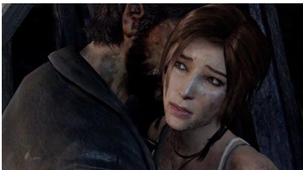
Slika 1. Tomb Raider – scena „pokušaja silovanja“

Cjelokupan razvoj događaja koji se odvio zbog jedne scene u jednoj videoigri ironičan je iz dva razloga. Prvo, kao što je direktor Karl Stewart rekao, da smatra da većina ljudi koji su se požalili na kontroverzu unutar videoigre Tomb Raider nisu uopće upućeni u cijeli njezin sadržaj, već u djelić konteksta koji im je neka treća strana priopćila na svoj način tako potičući daljnju raspravu. Međutim, bilo da se ustvari radilo o prikazu seksualnog napada, zašto bi se itko trebao osjećati loše ako uključi takvu tematiku u igru? Takvi se primjeri pojavljuju i u serijama kao što su Zakon i red: Odjel za žrtve i Spartacus te filmovima poput The Accused i Eye for an Eye . No zašto se onda samo na videoigre vrši napad pod nekim nepravednim i licemjernim standardom? Iz danoga bi se dalo zaključiti kako videoigrama nije dopušteno baviti se kontroverznim temama poput seksualnog napada, za razliku od televizijskih serija i filmova.