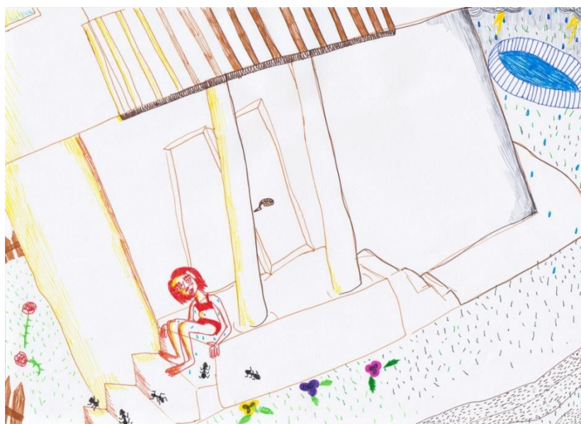
Slika 5: Iz serije Iza mene , tuš i lajneri, 2018.

Tako sam za diplomski rad odlučila provesti autoportret kroz narativni izražaj - kroz strip.