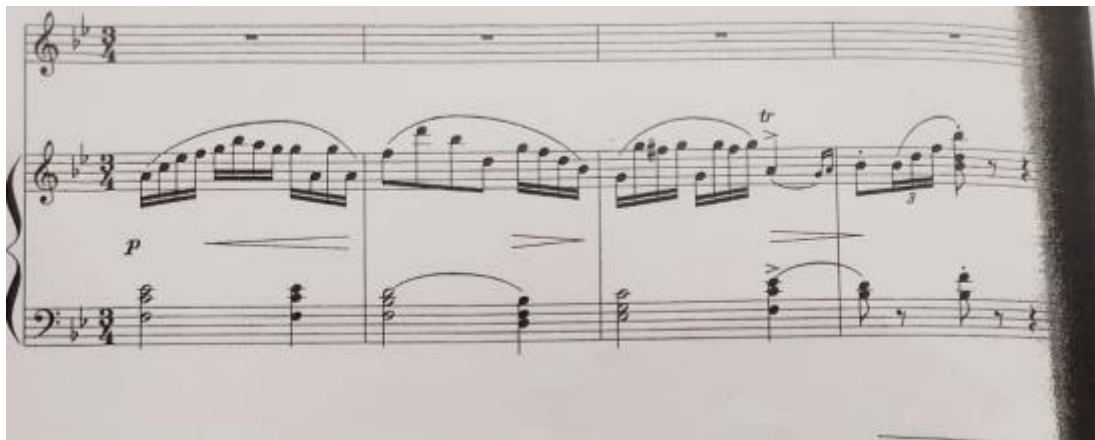
Primjer br. 12