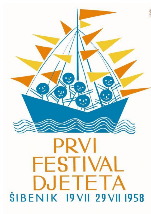
Slika 1. Prikaz plakata za 1. festival djeteta u Šibeniku 1958. godine, autora Steve Biničkog.

Nesumnjivu posebnost šibenske kulture i svojevrsni zaštitni znak grada već dugi niz godina predstavlja Međunarodni dječji festival koji je u svijetu prepoznat kao jedinstvena kulturna manifestacija. Festival, koji je prvi put održan 1958. godine, nastao je kao ostvarenje inicijative i angažmana nekolicine zaljubljenika u dječju umjetnost i umjetnost za djecu. Iako je od svojih početaka pa sve do 1990. godine nosio predznak „jugoslavenski“, festival je vrlo brzo prešao granice tadašnje države te je postao događaj od međunarodnoga značaja, uključivši u svoj program sudionike sa svih kontinenata. Njegova je posebnost što su se u jedno spojile tri nerazdružive komponente: djeca, festival i gradska sredina, kako bi kroz kulturnu manifestaciju pokazale ono najbolje od dječjeg stvaralaštva i najbolje od stvaralaštva odraslih za djecu. Festival kroz svoja događanja spaja brojne umjetnosti poput dramske, lutkarske, glazbeno-scenske, filmske, literarne i likovne.