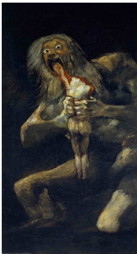
Slika 8. Francisco Goya, Saturn proždire svoju djecu , 1821. - 1823.

Sličan pristup imao je meksički redatelj Guillermo del Toro u filmu Panov labirint iz 2006. godine. Fantastična mračna drama nas vodi u Francovu Španjolsku četrdesetih godina prošlog stoljeća gdje pratimo djevojčicu koja živi u svijetu bajki. Odnos prema realnosti i bajkama se miješaju kao da obje stvarnosti postoje. Redateljev originalan pristup portretiranja djevojčice koja tragedije rata zamjenjuje fantastičnim bajkovitim bijegom našao je uporište i u slikarstvu. U intervjuu za novinski list The Guardian , del Toro se referirao na utjecaj koji je imao španjolski slikar Francisco Goya sa svojom slikom Saturn proždire svoju djecu (vidi Sliku 8.) na odabir razvoja i izgleda scene „blijedog čovjeka“ u filmu. ( https://www.theguardian.com/film/2006/nov/17/2 ) (pristup 21.02.2020.) U navedenoj sceni biće koje spava za stolom se budi nakon što protagonistica filma odluči uzeti grozd, unatoč opomeni malih vila kako ne smije dirati ništa od hrane sa stola. U tom se trenutku budi bijelo, nalik na, ljudsko biće i lovi dvije vile koje ga pokušavaju odvratiti kako bi protagonistica uspjela pobjeći. Biće uspijeva uloviti dvije od tri vile i ubija ih na način što ih počinje proždirati, poput Saturna na slici Francisca Goye. Video isječak navedene scene se može pregledati putem YouTube poveznice: https://www.youtube.com/watch?v=1i3oRxm8G0o . (pristup 21.02.2020.)