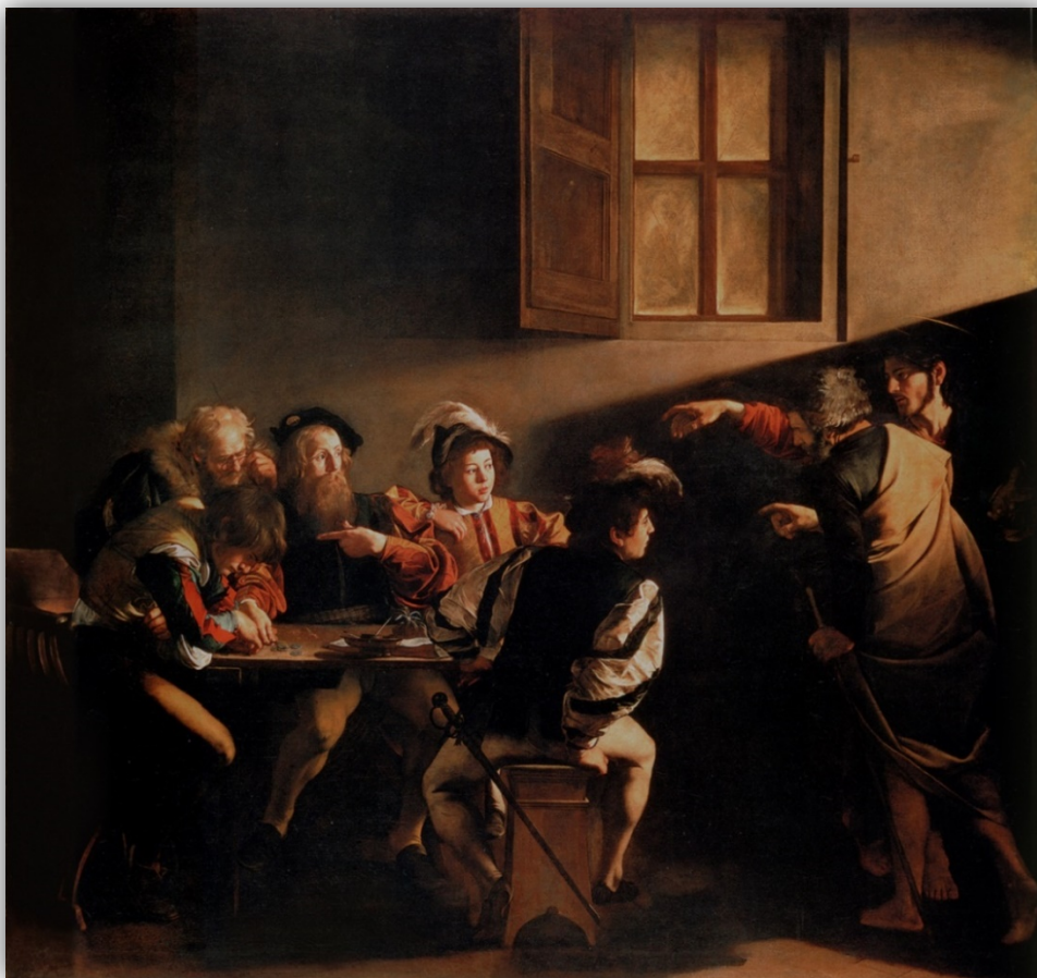
Slika 3. Michelangelo Merisi da Caravaggio, Pozivanje Svetog Mateja , 1599.-1600.

Jedan od najznačajnijih filmskih redatelja današnjice Martin Scorsese je za knjigu britanskog povjesničara umjetnosti Andrew Grahama-Dixona: Caravaggio: Svet i svjetovan život iz 2010. godine, objavio kako je scene u noćnom klubu iz njegovog filma Ulice nasilja iz 1973. godine obilježila Caravaggiova slika Pozivanje Svetog Mateja nastalo u razdoblju 1599.-1600. Godine (vidi Sliku 3.). ( https://www.theguardian.com/artanddesign/2010/jul/25/caravaggio-scorsese-lachapelle-peter-doig#ixzz2UhOnoJMB ) (pristup 21.02.2020.) U navedenoj sceni, Scorsese navodi kako je kretanje kamere, kadriranje, položaj ljudi u kadru namješteno komplementarno kompoziciji i dinamici Caravaggiove slike. Nadalje, u filmu Posljednje Kristovo iskušenje iz 1988. godine, redatelj navodi kako je lik Krista utemeljio prema samom Caravaggu. ( https://www.theguardian.com/artanddesign/2010/jul/25/caravaggio-scorsese-lachapelle-peter-doig#ixzz2UhOnoJMB ) (pristup 21.02.2020.) Video dionica iz filma može se pregledati putem poveznice https://www.youtube.com/watch?v=WZ7UwnfQ2nA . (pristup 21.02.2020.)