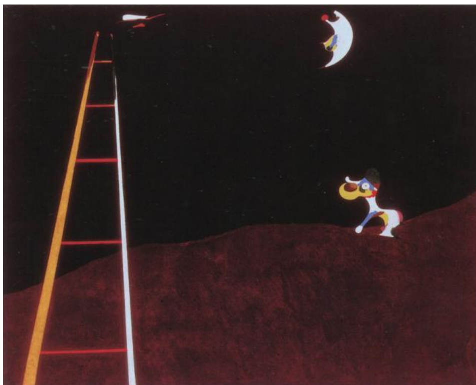
Slika 1: Lajanje pasa na Mjesecu (1926.), Ulje na platnu, Zbirka A. E. Gallatin, Muzej umjetnosti Philadelphia, Philadelphia, Pennsylvania