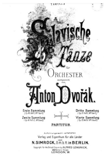
Slika 2. Naslovna stranica partiture za orkestar

Prema: http://hz.imsip.info/files/imglnks/usimg/b/bd/IMSLP509146-PMLP4972-Dvorak - _Slavonic Dances, Op.46, B.83.pdf