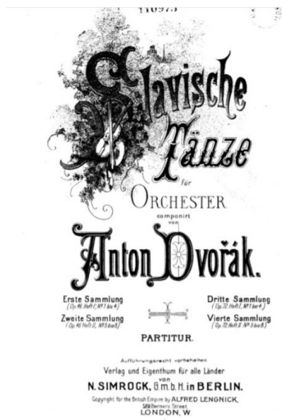
Slika 2. Naslovna stranica partiture za orkestar