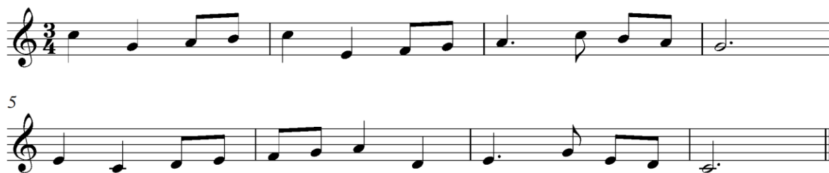
Slika 3: Primjer igre melodiziranja (Lazarin 1992, sv. 2; 133-134)

U kategoriji igra ritmiziranja učenici trebaju načiniti melodiju prema zadanom tonskom nizu u okviru određenoga tonaliteta, a imaju predloženu mjeru i započetu ritamsku osnovu (Slika 4).