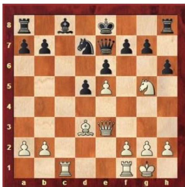
Slika 7. Primjer igre Magnusa Carlsena s 11 godina (već je tada postizao vrhunske rezultate u šahu, odigrao je remi s G. Kasparovom)

U suvremenoj pedagogiji aktivnost igre smatra se neizostavnom za potpunije ostvarenje odgojno obrazovnih ciljeva. Igram se djeci pomaže lakše razumjeti određeni nastavni sadržaj, potiče ih se na veću aktivnost i lakše uključivanje u nastavne zadatke. Igru djeca doživljavaju spontano i rado se u nju uključuju pa se i bolje motiviraju za nastavu. Učitelj neprestanim mijenjanjem sadržaja rada omogućava djeci aktivnije spoznavanje sebe i okoline.