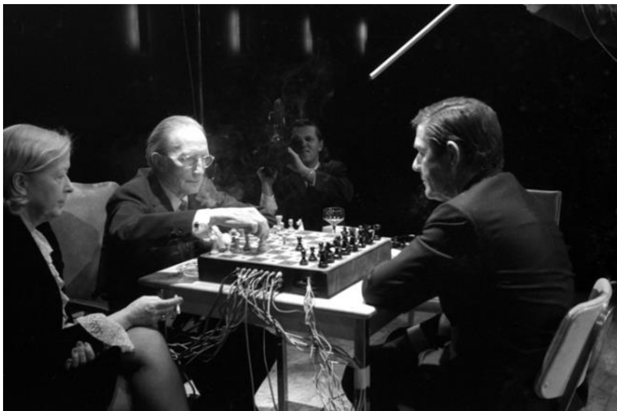
Slika 4. Fotografija s izložbe Marcela Duchampa i Johna Cagea pod nazivom “Reunion”