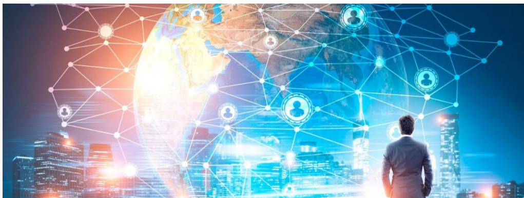
Slika 3 Umreženo društvo - ilustracija

Upravo ta pojava, odnosno mogućnost korisnika da sami generiraju sadržaje, veze i eventualno oblike organizacije uklapa se u okvire rizomatskog sustava, naspram masovnih medija koji, ako se vratimo na usporedbu drvo-rizom, imaju arborescentnu strukturu odnosno mogu se promatrati kao zatvoreni sustavi. Međutim, na umu treba imati kako unatoč tome i masovni mediji imaju mogućnost postati dio rizomatskog sustava upravo zbog mogućnosti i dosega informacijske tehnologije koja, kako je već spomenuto ima moći utjecati na procese koji se događaju u društvenim, medijskim, političkim i ekonomskim sferama.