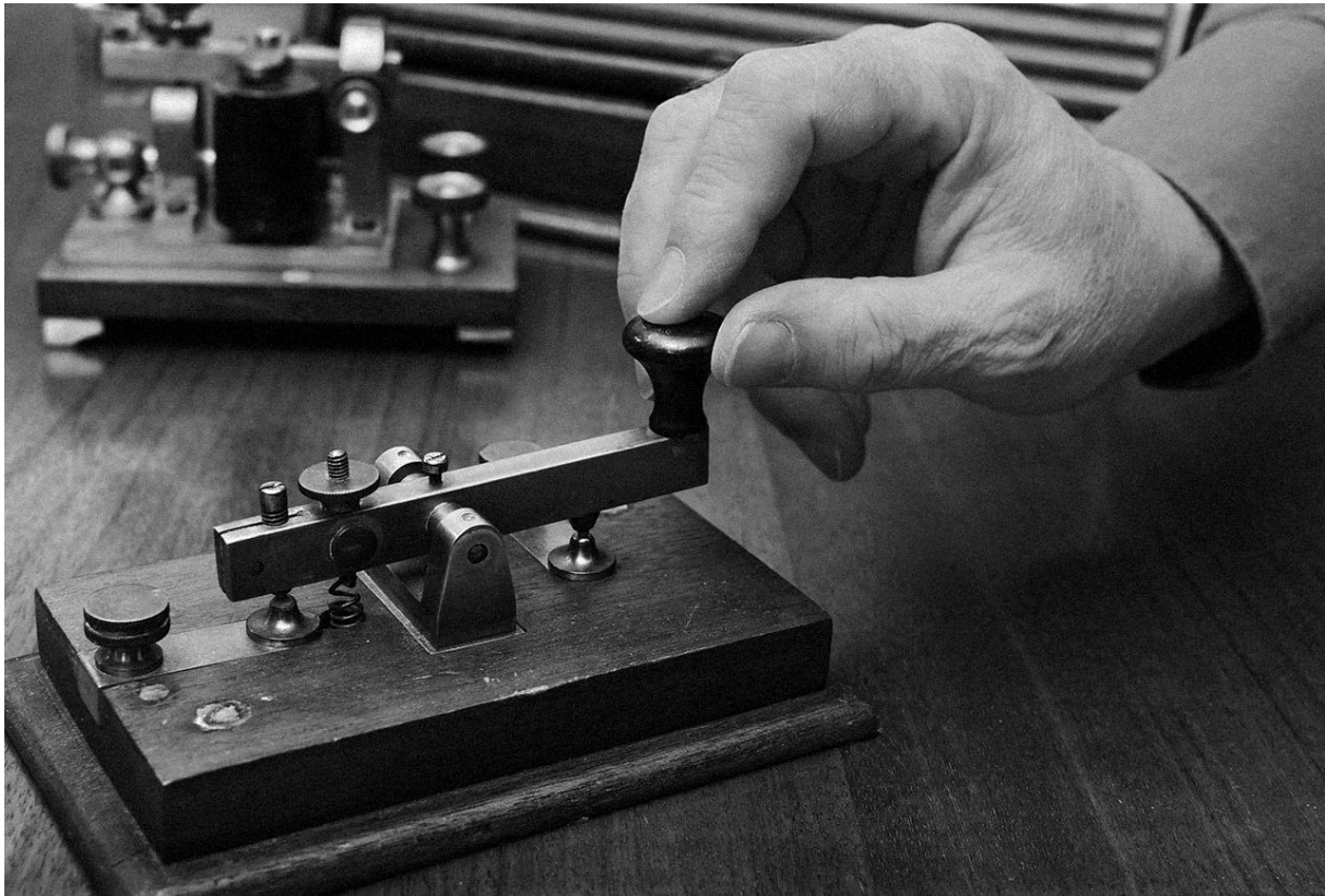
Slika 2 Telegraf

Iako je koncept rizoma primjenjiv u najrazličitijim kontekstima za potrebe ovog rada fokus se stavlja na civilizacijsku epohu koja je zbog svojih karakteristika nazvana informacijsko doba. Prvi trenutak u povijesti uz koji bi se mogao povezati početak informacijskog doba bio bi izum telegrafa 1837. godine. Ovaj izum pokrenuo je lančanu reakciju izuma i razvoja raznih drugih uređaja i metoda obrade i prijenosa informacija (Beauchamp, 2001).