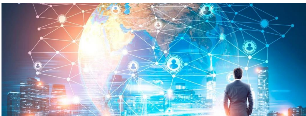
Slika 3 Umreženo društvo - ilustracija

Upravo ta pojava, odnosno mogućnost korisnika da sami generiraju sadržaje, veze i eventualno oblike organizacije uklapa se u okvire rizomatskog sustava, naspram masovnih medija koji, ako se vratimo na usporedbu drvo-rizom, imaju arborescentnu strukturu odnosno mogu se promatrati kao zatvoreni sustavi. Međutim, na umu treba imati kako unatoč tome i masovni mediji imaju mogućnost postati dio rizomatskog sustava upravo zbog mogućnosti i dosega informacijske tehnologije koja, kako je već spomenuto ima moći utjecati na procese koji se događaju u društvenim, medijskim, političkim i ekonomskim sferama.