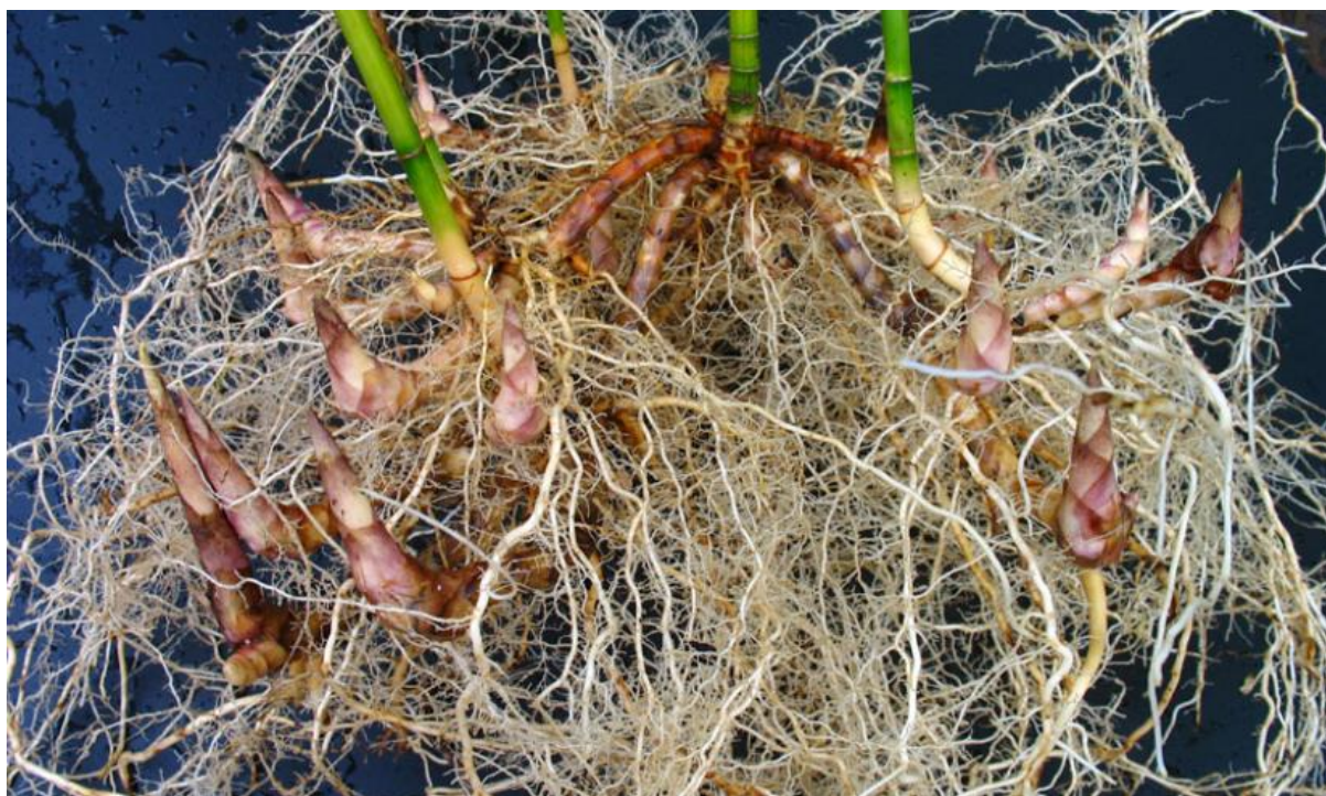
Slika 1 Biljka rizomatskog tipa

Uz to odlikuje ga mogućnost preživljavanja nepovoljnih razdoblja (suša, hladnoća) te ponovni izboj novih stabljika i korijenja kada to uvjeti dopuštaju (enciklopedija.hr). Stabljike i korjenje su spomenuti u množini jer to je također jedna od odlika rizoma; višestrukost. Naime za razliku od arborescentnog ustroja odnosno formacije korijen; stabljika; list koji čine jednu zaokruženu cjelinu, rizom ima višestruke korjene, stabljike i listove, odnosno može se neograničeno umnažati, ali pritom svi dijelovi ostaju međusobno povezani, dakle svaka točka može biti povezana s bilo kojom drugom u istoj cjelini.