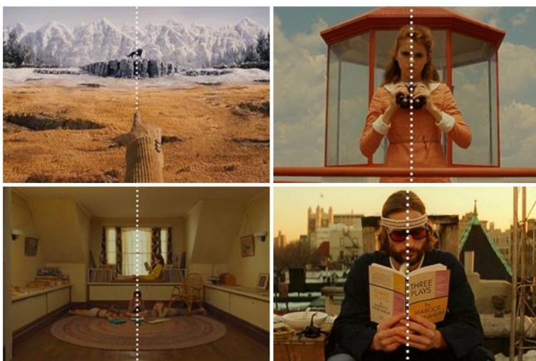
Slika 5: Simetrične scene u Andersonovim filmovima

Simetričnost kadrova možda je najprepoznatljivija vizualna značajka svih Andersonovih filmova. Andersonova duboko ukorijenjena ljubav prema simetriji i geometričnosti vidljiva je u gotovo svakom kadru, a od prvog njegovog filma sve se više oblikovala, sazrijevala i dolazila do izražaja. Tako se, promatrajući Andersonov rad, može zaključiti da je ova značajka danas procvjetala u punoj snazi. Čini se da Anderson ne može odoljeti privlačnosti recipročnog rasporeda rekvizita i likova ispred kamere. U filmovima Bottle Rocket i Rushmore postoji tek nekolicina primjera, no s obitelji Tenenbaum nadalje, gotovo svaki kadar postaje reprezentativan primjer simetričnosti. U kombinaciji sa svim ostalim vizualnim elementima, ova značajka postaje neizbježna u Andersonovom opusu. Kogonada, suradnik na britanskom filmskom institutu i filmski redatelj, napravio je video u kojemu je jasno pojašnjena ova simetričnost. U videu, Kogonada je postavio centriranu bijelu liniju preko brojnih kadrova iz Andersonovih filmova. Treba istaknuti da je velik utjecaj na Andersona imao Stanley Kubrick, redatelj također poznat po svojim savršeno simetričnim kadrovima.