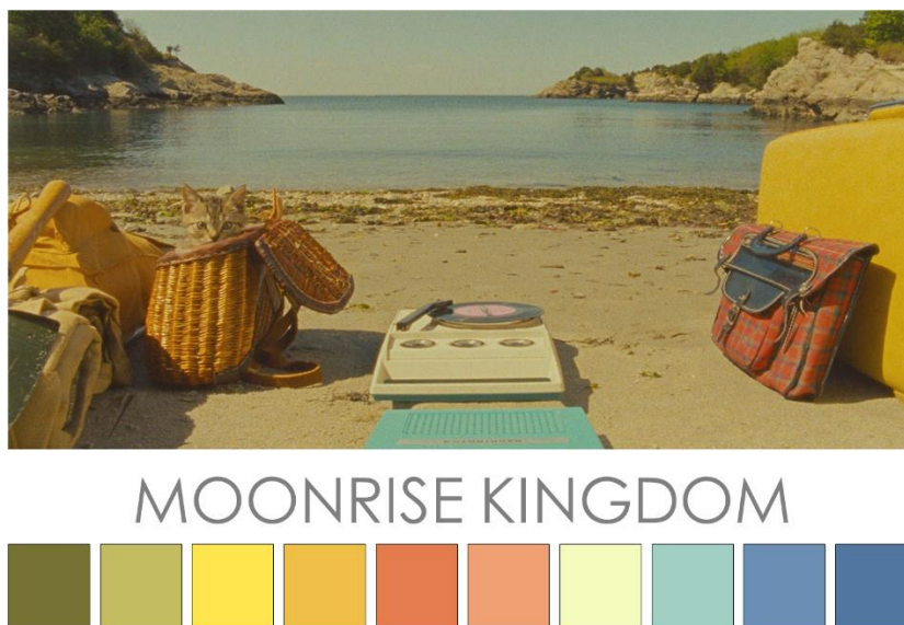
Slika 2: Paleta boja u filmu Moonrise Kingdom

Anderson je talentirani individualac koji uspijeva manipulirati zvuk i sliku kako bi prenio publiku u njegov vlastiti svijet. Česte teme njegovih filmova vrte se oko figura problematičnih očeva – Steve Zissou, Royal Tenenbaum, Herman Blume i Mr Fox. Svi ovi očevi nose crvenu