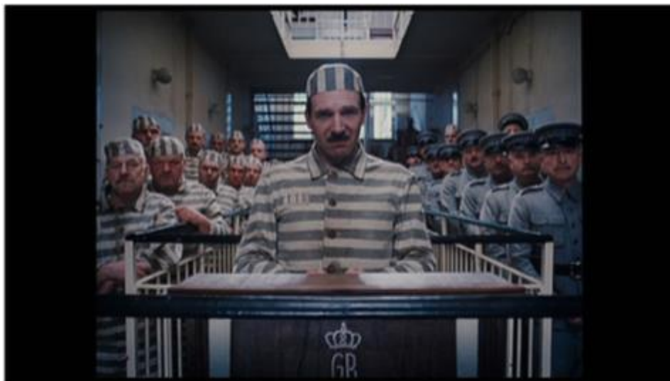
Slika 9: Scena iz filma The Grand Budapest Hotel

Značajan blizi kadar u ovom filmu korišten je kada Gustave recitira pismo njegovim kolegama u zatvoru. Gustave se nalazi u centru kadra, a zatvorenici i čuvari pravilno su posloženi sa svake strane, svi gledajući u kameru. Ovaj kadar također izaziva komičan efekt zbog apsurdnog odnosa ozbiljnosti i pomalo neugodne kompozicije unutar pretjeranog poetičnog konteksta.