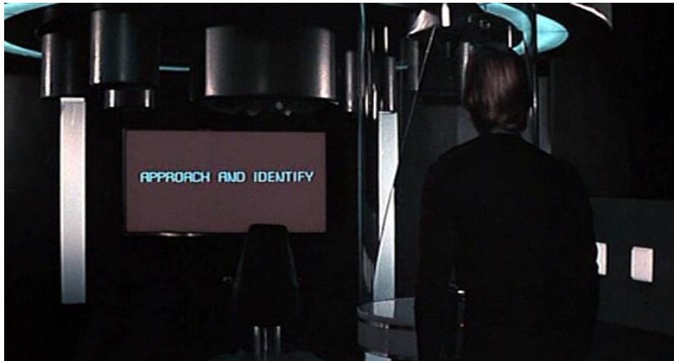
Slika 4. Logan's run