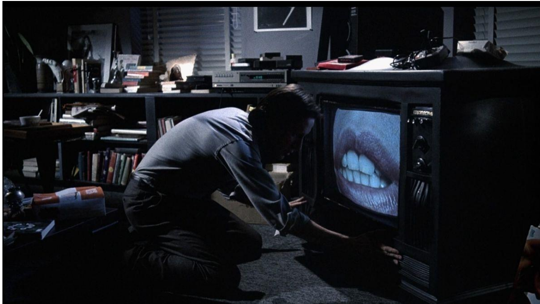
Slika 6. Videodrome