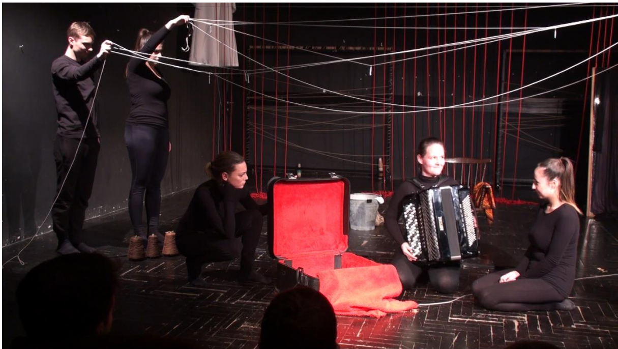
Slika 2: Prikaz promjene nakon scene Negdje u daljini

Glumica okreće svoju jabuku oko glumčeve kao ne želi da mladić više dolazi do nje. Kidanjem jabuke moli ga da ode i donese joj dunje. Mladić odlazi, a djevojka se nastavlja sama dodavati jabukom prikazujući time protjecanje vremena i mladićevo izbivanje. Kako mladić ne dolazi, djevojka počinje stiskati jabuku koju je otkinula na početku. Time je prikazana tuga, bol i propadanje, a raspadanje jabuke stiskanjem simbol je slomljenog srca i duboke bol. Kako curi sok iz jabuke tako curi i život iz djevojke. Mladić svojim dolaskom zaustavlja jabuku i time simbolički zaustavlja vrijeme. Vidi mrtvu djevojku te i sam stiskanjem jabuke odigra slomljeno srce i uništen život. Dojam njegove tuge povećava se padanjem jabuka koje su pričvršćene na silk na različitim mjestima u prostoriji. Padanjem se jabuke raspadaju i tako pojačavaju dojam njihove tuge.