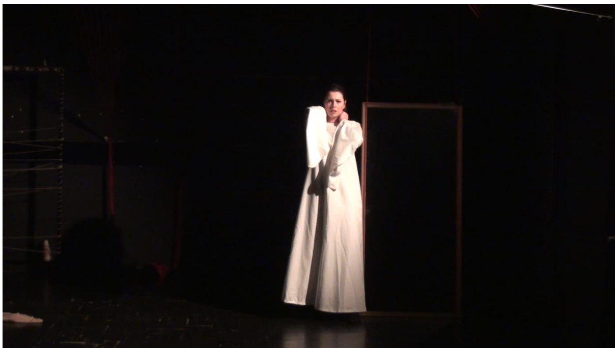
Slika 3: Scena inspirirana pjesmom Lijepa Zejno

Lijepa Zejno druga je scena koju sam igrala i mogu reći da mi je ona emocionalno bila mnogo bliža. Već u prvim stihovima pjesme osjećala sam neku povezanost i nisam morala pretjerano ulaziti u emociju koju je scena zahtijevala. Ovdje je problem bio drugačiji. Partner u sceni mi je bio imaginarna osobna, odnosno duh. Što je značilo da njega igraju kolege animacijom prostora te ja reakcijama na istu. U lutkarstvu bi se to zvalo odnos glumac-lutka. U odnosu s lutkom izvrsno sam se snalazila i beskrajno uživala, a sada sam imala osjećaj da mi to oduzima moje trenutke glume, da mi smeta i oduzima koncentraciju. Kako je vrijeme prolazilo, shvatila sam da će biti jednostavnije ako neke tehničke stvari prilagodim svojoj glumačkoj igri pa će se tako i glumačka igra prilagoditi animaciji. Kada sam to shvatila potpuno mi se promijenila vizija scene i moga prostora u njoj. Kolege su se trudile pomoći u preciznosti izvođenja animacije i paralelne glume i to mi je davalo neku sigurnost da ništa neće poći krivo. Cijelo povjerenje koje se stvorilo oko mene omogućilo mi je da uživam u sceni od početka do kraja.