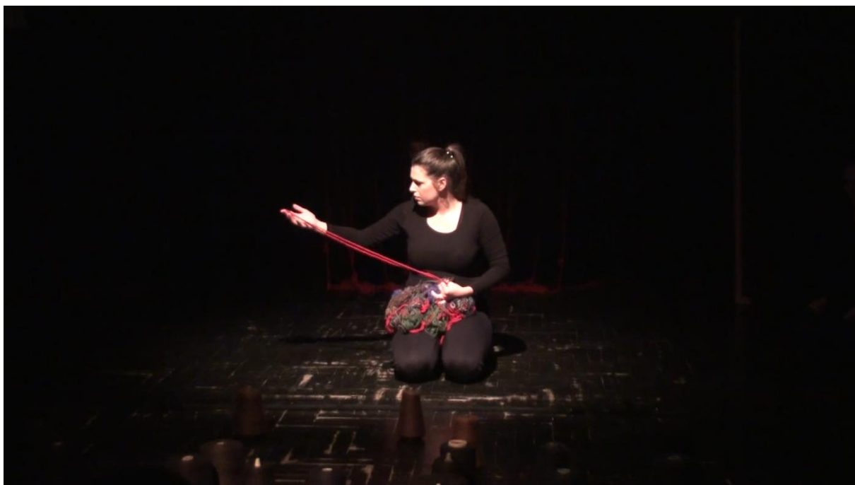
Slika 4 : scena inspirirana pjesmom Na mezaru majka plače