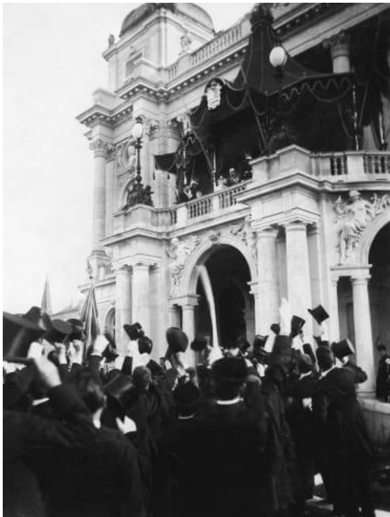
Slika 1: Svečano otvorenje kazališne zgrade 14.10.1895.

listopadu 1895. godine sagrađena i otvorena nova zgrada Hrvatskog narodnog kazališta kakvu mi danas poznajemo. (Slika 1 i slika 2)