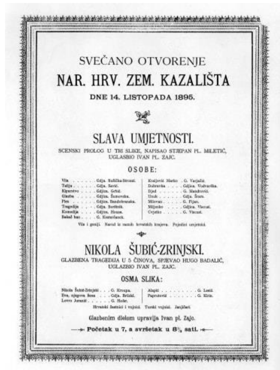
Slika 2: Svečanost otvorenja – Slava umjetnosti

Naravno, u tome razdoblju javljaju se i druga narodna kazališta u Hrvatskoj. Tako 3. listopada 1885. godine otvoreno je Hrvatsko narodno kazalište Ivan pl. Zajc u Rijeci, potom 6. svibnja 1893. godine otvoreno je Hrvatsko narodno kazalište u Splitu te Hrvatsko narodno kazalište u Osijeku, kao najmlađe, otvoreno je 7. prosinca 1907. godine.