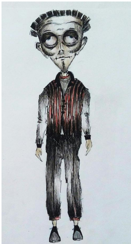
Slika III. Skica hvalisavca