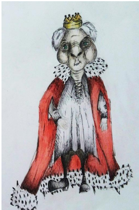
Slika I. skica kralja