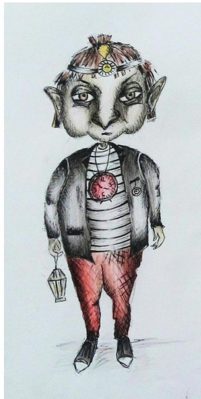
Slika IV. skica noćobdije