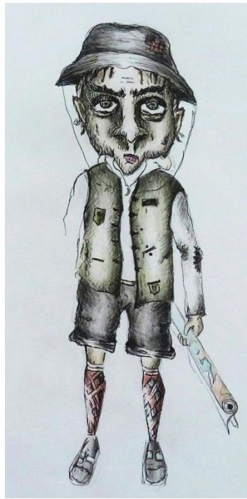
Slika II. skica zemljopisca