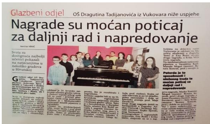
Slika 7. Članak Vukovarskih novina 15