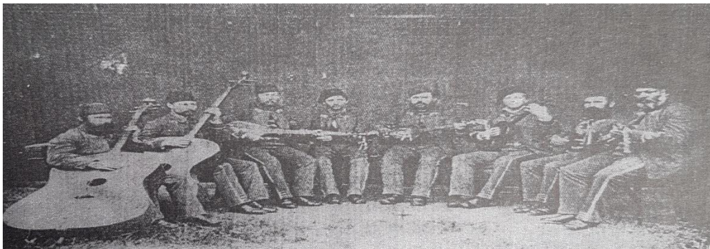
Slika 9. Vukovarski tamburaši na priredbi u Beču, druga polovica 19. stoljeća