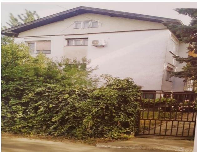
Slika 5. Kuća u kojoj je djelovao Glazbeni odjel u ulici Kate Pejanovića 5. 1998. godine

Nastava glazbenog odjela, održavala se u privatnoj kući, moguće je bilo održavati nastavu u četiri učionice. Takav način rada i u takvim uvjetima, trajao je tri školske godine. Nakon teškog početka, škola nastavlja sa održavanjem nastave u Borovu naselju u prostorijama Učeničkog doma u svega tri učionice.