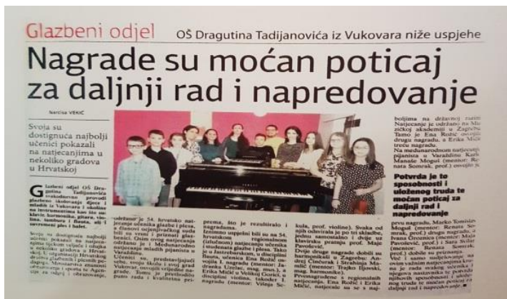
Slika 7. Članak Vukovarskih novina 15