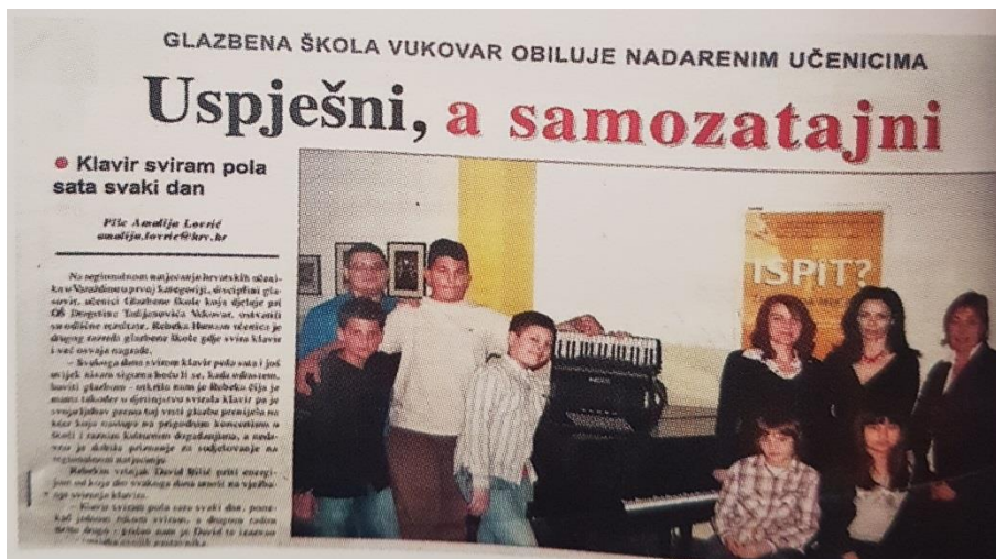
Slika 6. Vukovarske novine izdane 2007. godine

U Školskoj 2010./2011. godini upisano je sto osamdeset učenika koji su pohađali nastavu klavira, gitare, harmonike, tambure, violine, flaute te suvremenog plesa. Postavljena je opet nova postava novih nastavnika. Učenici su kao i do sada, postizali sjajne uspjehe te održavali brojne koncerte, sudjelovali na manifestacijama, pjevali na koncertima i natjecanjima, osvajali nagrade u raznim kategorijama. Školska godina 2011./2012. Brojila je sto osamdeset i jednog upisanog učenika te također novi zaposlenici koji su podučavali učenike suvremenom plesu, tamburama te violini. Održali su se brojni koncerti, Božićni koncert, godišnji koncert. U glazbenoj školi, rad je bio težak te prostorije koje su nedostajale bile su najveći cilj škole. Školske 2012./2013. Godine, upisano je dvjesto učenika u Glazbenu školu, zaposleni novi nastavnici gitare i violine. Glazbena škola, tada je već nakon dugog niza rada sa učenicima postigla sjajne rezultate i postignuća te ostvarila određeno iskustvo te znanje u radu sa učenicima i svladavanju prepreka koje su se našle pred njom. U idućim godinama, sve do školske godine 2016./2017. Glazbena škola, napredovala je, svake godine broj upisanih učenika rastao je sve do dvjesto četrdeset učenika što je veliki napredak i postignuće pogledamo li prvu godinu rada te broja upisanih učenika davne 1999. godine. Glazbena škola, konačno je dobila sjaj svojih prostorija, dvorane te dovoljan broj nastavnika.