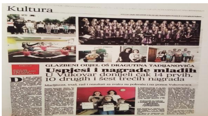
Slika 8. Članak Vukovarskih novina 16