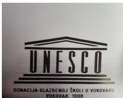
Slika 4. Donacija pijanina, 1998.

Nakon prestanka rada škole u Vukovaru učenici su nastavili pohađati glazbenu školu u matičnoj školi u Osijeku. Opremanje škole započelo je skromnim i vlastitim sredstvima roditelja i donacijama prikupljenim preko brojnih zamolbi udrugama. Jedna od prvih donacija bila je ona Evangelističke crkve iz Osijeka koja je Glazbenoj školi Vukovar darovala dvije gitare. Hrvatska zaklada švicarskih glazbenika donirala je dva pijanina. Četiri flaute stigle su iz donacije iz Švicarske, a još jednu gitaru i pijanino darovao je UNESCO 1998. godine. (Uzelac 2018: 12)