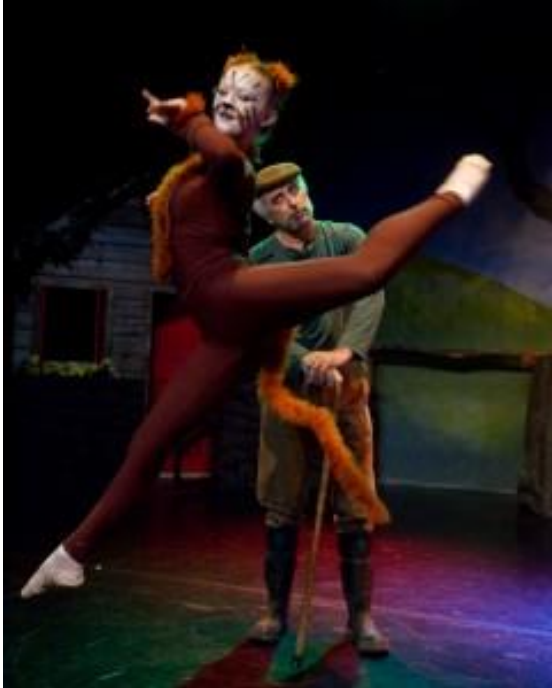
Slika 9: Baletno uprizorenje Peće i vuka

Lillie, Angela Rippon, Willie Rushton, Boris Karloff, Frankie Howerd, Sean Connery, Ben Kingsley, Richard Baker, Hermione Gingold, Terry Wogan, Christopher Lee, David Bowie i Sting.