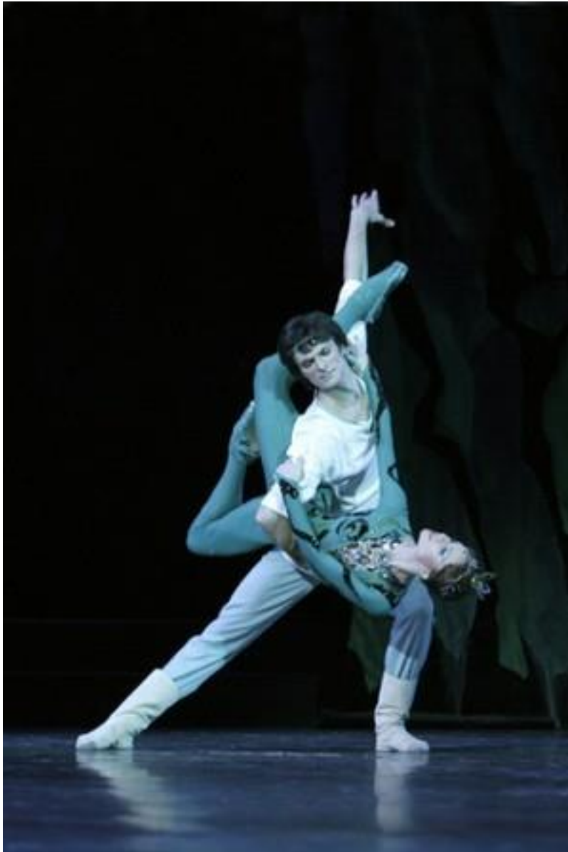
Slika 8: Prikaz iz baleta Priča o kamenom cvijetu

nije toliko poznato kao Romeo i Julija i Pepeljuga , no šarmantnost melodije i ritma u njemu su vrlo uočljivi.