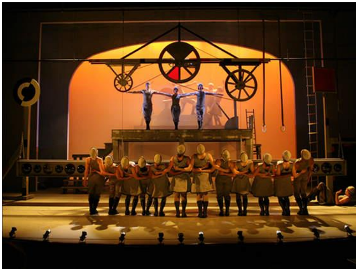
Slika 3: Prikaz izvedbe baleta Čelični skok 2005. godine na Priceton-u, New Jersey ( http://www.sprkfv.net/journal/three10/princeton.html )

Rasipni sin , balet je koji crpi dobro poznatu biblijsku temu rasipnog sina, a motivi u glazbi su lirskog karaktera. Koreografiju je osmislio George Balanchine, a libreto Boris Kochno. Ovaj balet posljednji je u nizu kojeg je Prokofjev skladao za Djagiljeva i ujedno najpopularniji od njih, a izveden je prvi puta 21. svibnja 1929. godine, također u Parizu. Balet su izvodili Ballets Russes , a praizvedbu je dirigirao sam Prokofjev, no bio je nezadovoljan Balanchine-ovom koreografijom i koncepcijom kako je uprizorio radnju te mu je poslije premijere odbio platiti novac.