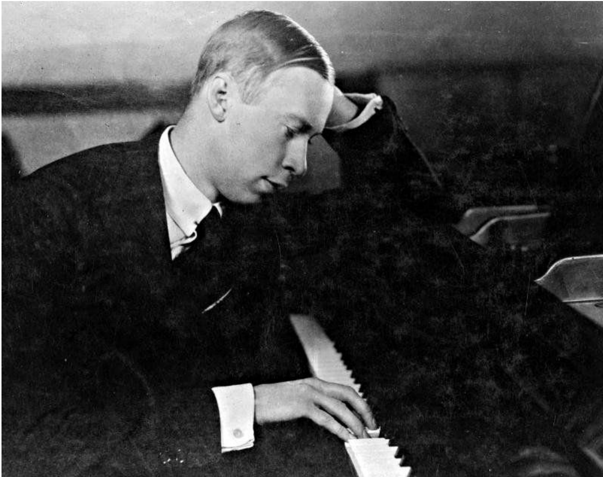
Slika 1: Sergej Prokofjev

Prokofjev je pisao i popijevke, ali i veća zborna djela kao što su kantate i oratoriji. Ističu se Kantata o dvadesetogodišnjici oktobarske revolucije (1937), Zdravica (1939), Priča o dječaku koji je ostao nepoznat (1944), oratorij Na straži mira (1950), a veličanstvena kantata Aleksandar Nevski (1938), izrasla je iz glazbe u istoimeni film i smatra se jednim od najboljih Prokofjevovih djela.