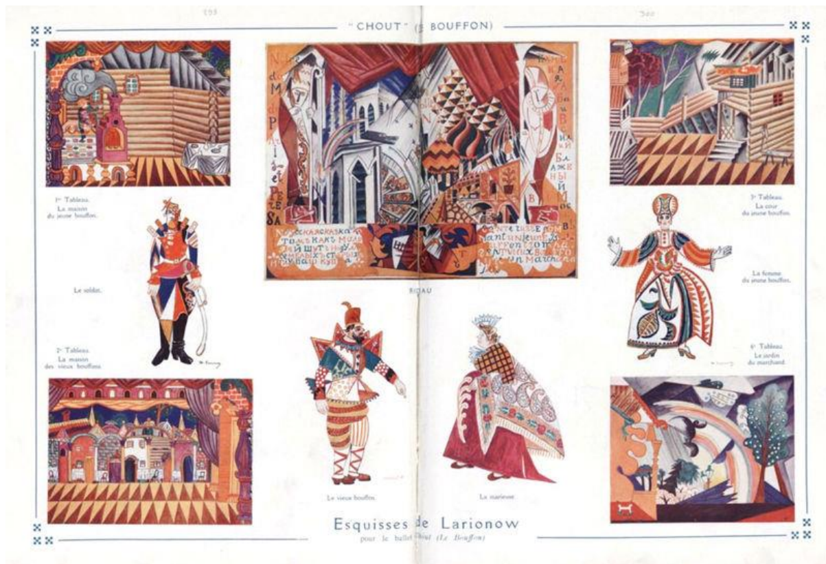
Slika 2: Nacrt postave scene i kostima za premijeru Lakrdijaša 1921.godine u Parizu https://upload.wikimedia.org/wikipedia/en/b/b4/Sketches_by_Larionov_for_the_ballet_Chout_with_music_by_Prokofiev_May_1921_-_Gallica.jpg

Balet Čelični skok nastao je 1925. Prokofjev je napisao glazbu i surađivao je s libretistom Georgyjem Yakulovom. Balet se sastoji od dvije scene i ima 11 plesova. Radnja prikazuje život u Rusiji 1920.-ih godina. Prikazuje industrijalizaciju Rusije te nastanak tvornica. Glavni fokus radnje je ples mornara i djevojke radnice koji simbolizira uzdizanje radničkog staleža. Balet Čelični skok praizveden je 7. lipnja 1927. Parizu. Čelični skok pokazao se kao veliki uspjeh Prokofjeva i Djagiljeva jer se nakon premijere zadržao na pariškoj pozornici čak tri sezone. Tada je Djagiljev potvrdio da mu je Prokofjev metaforički „drugi sin“. Balet je izvedeč čak u Londonu, a u dvadesetom stoljeću samo je jednom nakon toga izveden 1931. godine u SAD-u. Nakon te izvedbe balet je ponovno zaživio tek 2005. i izveden je na sveučilištu Princeton u New Jerseyu. Prokofjev je glazbu iz ovog baleta također pretvorio u istoimenu, orkestralnu suitu.