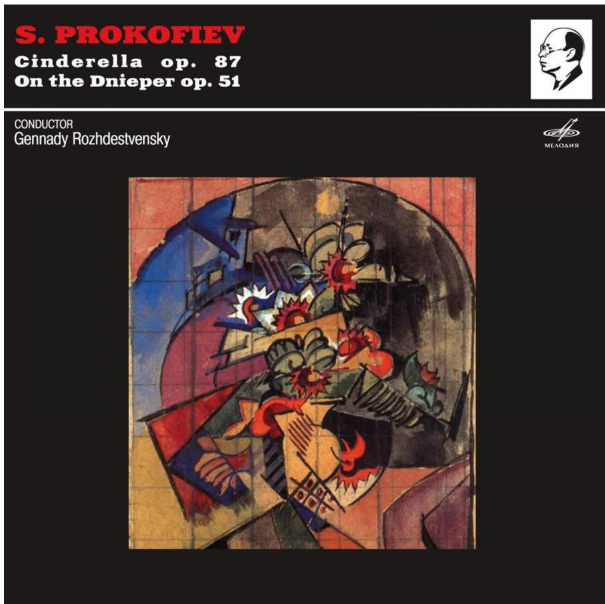
Slika 5: Suite Na Dnjepru i Pepeljuga ( https://www.prestomusic.com/classical/products/7948129--prokofiev-cinderella-on-the-dnieper )

svojih ostalih dijela. Prokofjev u glazbi ovog baleta ističe svoje lirske motive još više.