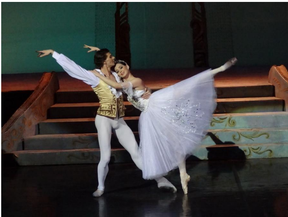
Slika 7: Balet Pepeljuga, ples princa i Pepeljuge

( https://www.balletandopera.com/classical_ballet/Sergei_Prokofiev_Cinderella_ballet_in_/info/sid=GLE_1&play_date_from=01-Jul-2018&play_date_to=31-Jul-2018&playbills=60986 )