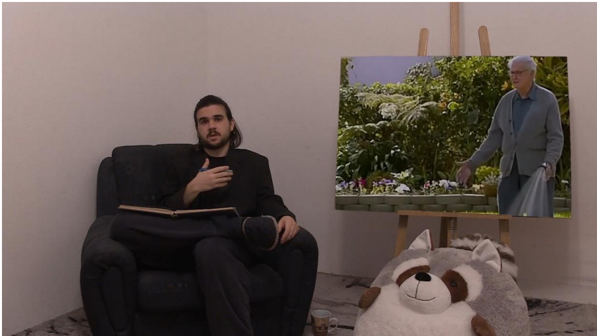
1.Scena iz videa, poglavlje Impresionizam

I tako su povijesne priče i mitovi naroda zamijenjeni trenutkom tada modernog čovjeka.