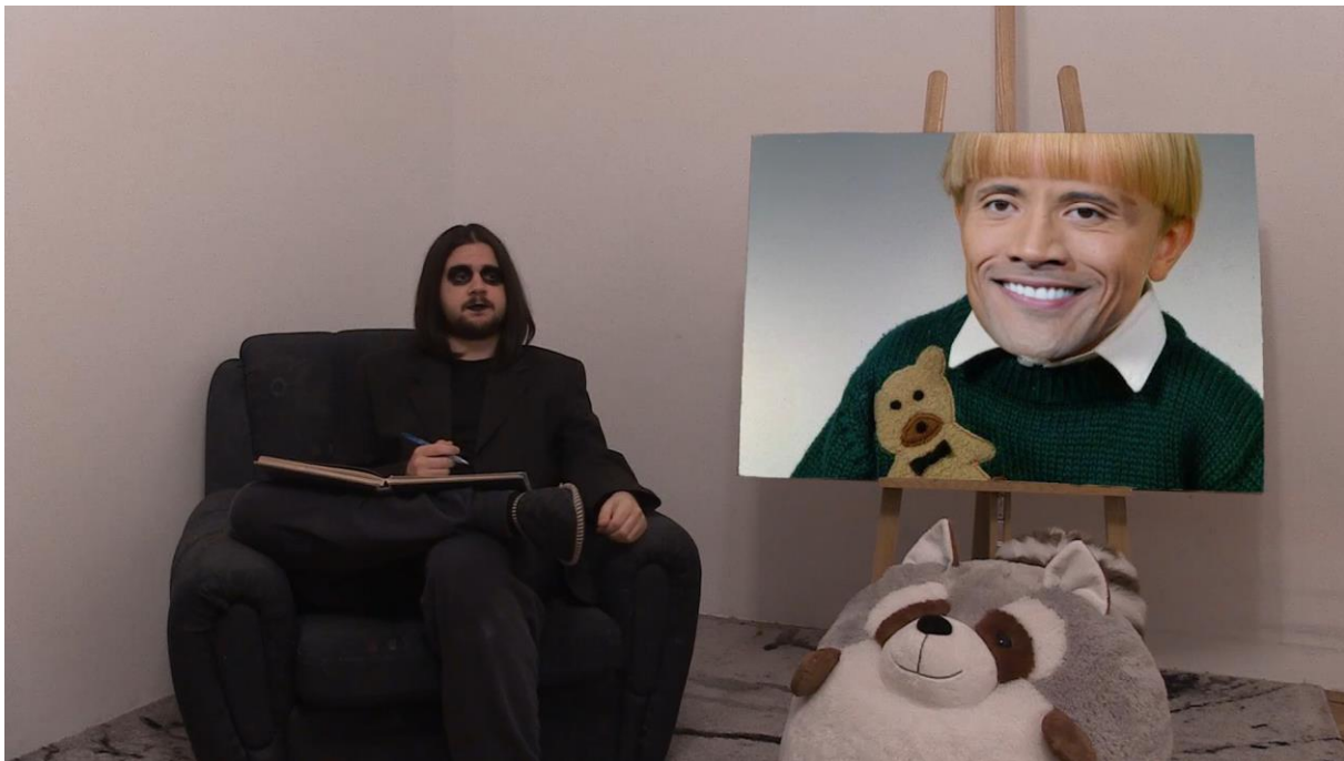
6. Scena iz videa, poglavlje Apstraktni ekspresionizam

Postoje mnoge teorije kako i zašto se ovaj stil probio. Jedna od njih je zato što je apolitičan. Ali, naravno, ovo je netočno. Ljudi koji su „dozvolili“ da se ovi radovi izlažu možda susmatrali da su ovi radovi apolitični, bez poruke. Međutim, ovi radovi itekako imaju poruku. Ta poruka je napuštanje pravila u potrazi za slobodom, u aktivnoj potrazi za impulsom i izazivanjem impulsa. O slobodi bi se svakako dalo raspravljati, ona je siva, ni dobra, ni loša. No impulzivnost je smjer u kojem se ni civilizacija ni individualac ne bi trebali kretati.