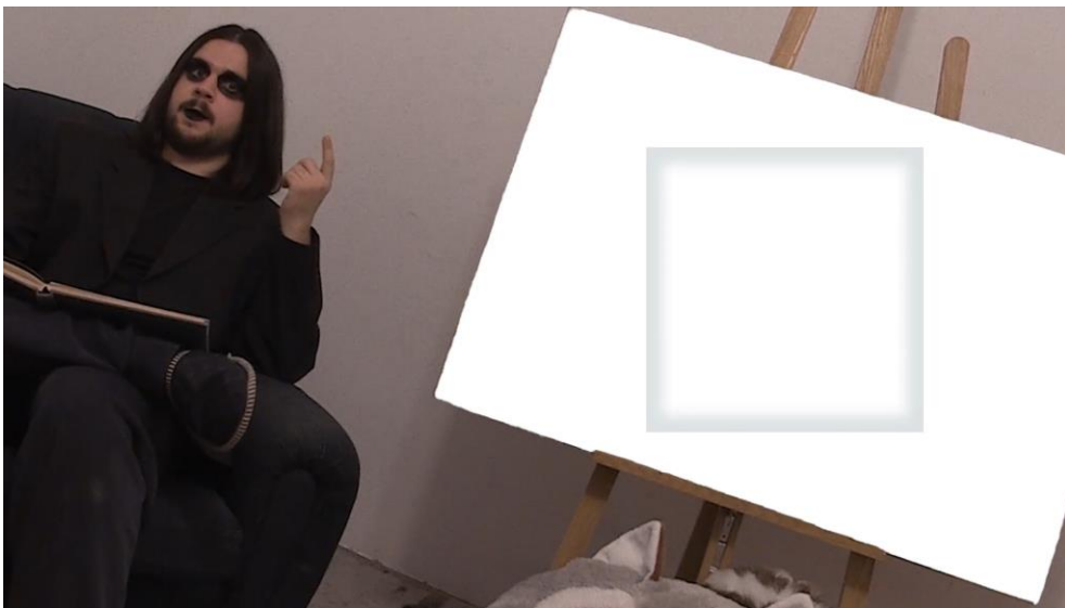
3. Scena iz videa, poglavlje Suprematizam

Međutim, kroz ostatak ovog poglavlja u videu je istražena nova krajnost koju suprematizam nije dotaknuo. U videu se uz pripovijedanje autora stvara nova digitalna slika: bijeli kvadrat na bijeloj podlozi koja je ukoso.