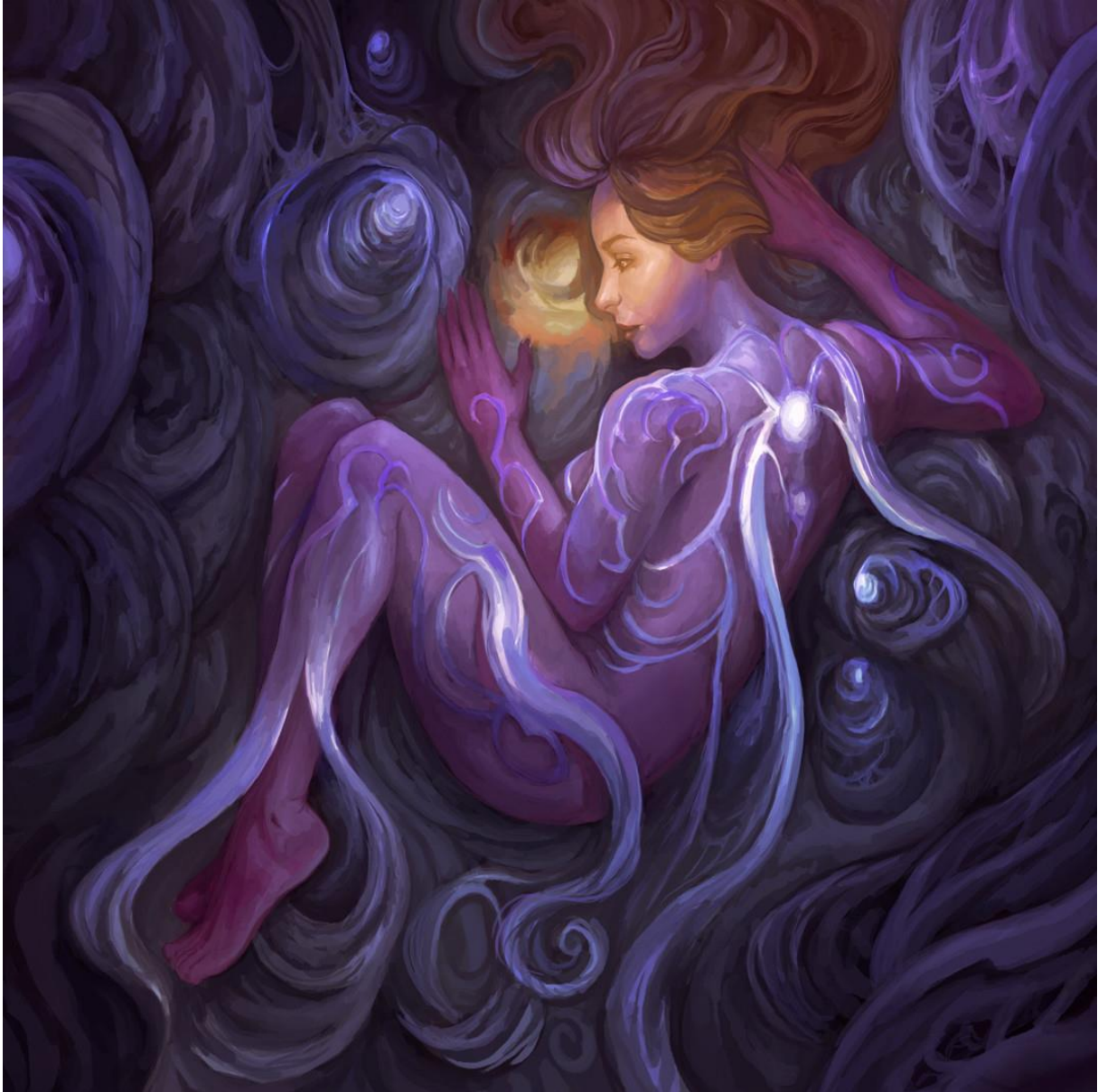
8. Luka Brico, Goddess awaken, digitalna 2D slika