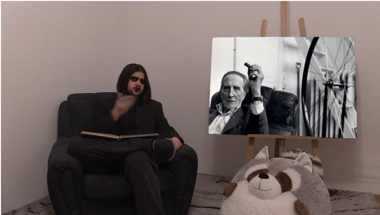
5. Scena iz videa, poglavlje Dadaizam

Nakon Prvog svjetskog rata dogodio se raspad sistema. I svaki raspad sistema je savršena prilika za novi sistem, novi red, koji će učiti na greškama svojih predaka. Moj osobni problem s dadaizmom je što kroz svoj besciljni humor slavi odustajanje. Dadaizam je kao žrtva neke traume koja ne može prijeći preko vlastite prošlosti te zapije u njoj. I dok se ostatak svijeta razvija i ide naprijed, ta žrtva zaostaje u vremenu, u najgorem dijelu svog života.