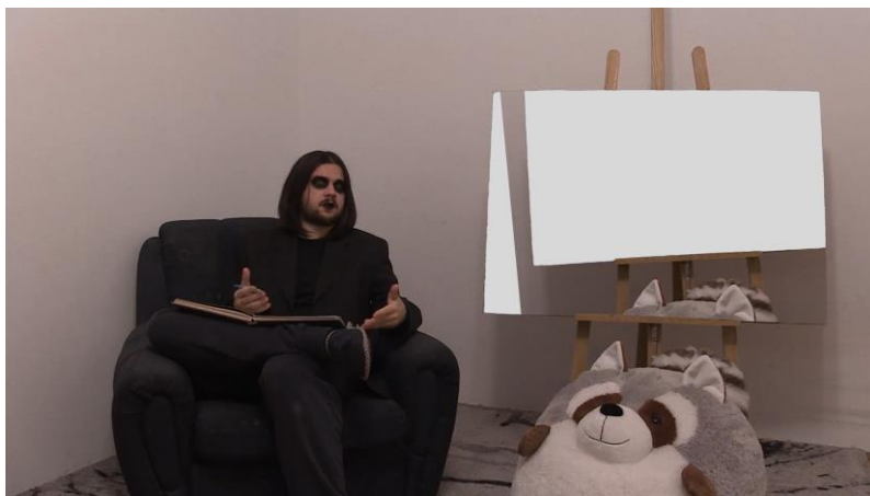
7. Scena iz videa, poglavlje Postmodernizam

Još jedan od mnogih problema koji dolaze s ovim pokretom je agresivna subjektivnost, ta ideja da ništa ustvari nije objektivno i da svatko doživljava svijet drukčije. Opet, djelomično istina, svatko je drukčiji i malo drukčije doživljava svijet. Standardi ljepote, ukus u hrani, glazbi, umjetnosti isl. variraju od osobe do osobe. No, agresivna subjektivnost nas jedino može dovesti do niza nesporazuma i nemogućnosti komunikacije s drugima.