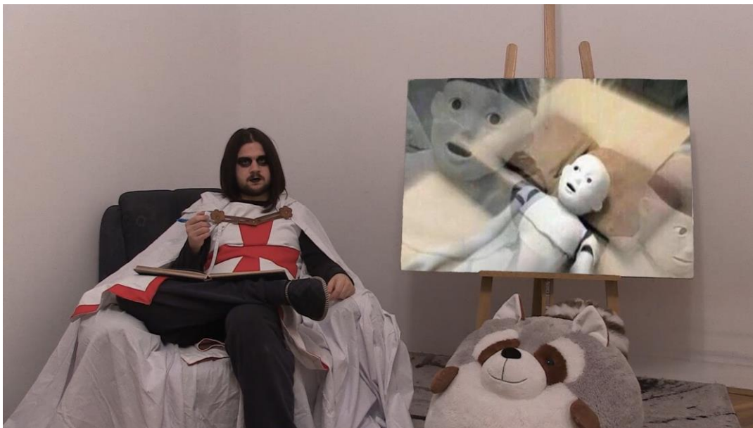
10. Scena iz videa, poglavlje Zaključak

Čak i filozof, s pažljivo promišljenim stavovima koji drži javne govore, ubrzo će shvatiti da nikog nije briga. Ideje rijetko kada mijenjaju tuđa mišljenja. I, naravno, kroz povijest su se pojavile mnoge revolucije, predvođene idejom, ali ti ljudi se nisu pobunili zbog ideje, nego prvenstveno zbog gladi i nepodnošljivih životnih standarda.