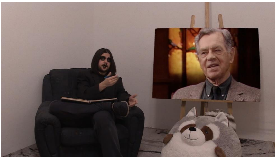
4. Scena iz videa, poglavlje De Stijl

De Stijl je to pokušao napraviti na globalnoj skali, i zato je spao na šarene kvadrate, nešto što bi čak i bebi bilo interesantno, i nešto što nikog neće zapravo uvrijediti. Znači, De Stijl je imao savršenu priliku pozabaviti se pričama svih prošlih naroda, i umjesto toga nam je dao šarene kvadrate. Campbellov arhetip heroja je ujedinio mnoge priče raznih naroda, na taj način da je našao jedinstvenu formulu za svu tu silnu mitologiju koja je preživjela test vremena. Takve stvari su u duhu onoga što je trebao biti doprinos De Stijla, a ne kvadrati.