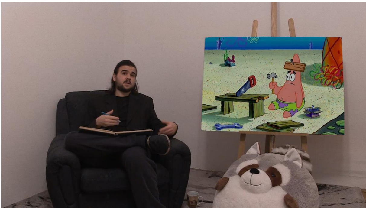
2. Scena iz videa, poglavlje Postimpresionizam

Druga polovica postimpresionizma imala je aglašenu strukturu i geometriju i stoga eventualno vodi u kubizam. Osnova kubizma je rastavljanje realnosti, svođenje realnosti na najjednostavniji geometrijski oblik i onda ponovo sastavljanje nazad. Jedna od ideja koja je vodila umjetnike na ovakvu interpretaciju je odustajanje od perspektive. Mnogi radovi su jednostavno ostali 2D, dok su neki pokušavali prikazati isti oblik iz više perspektiva. I impresionizam ima mnoge radove koji će se prosječnom čovjeku svidjeti na jedan ili drugi način, postimpresionizam također, pa čak i ekspresionizam ima mnoštvo bisera, dok ih kubizam baš i nema.