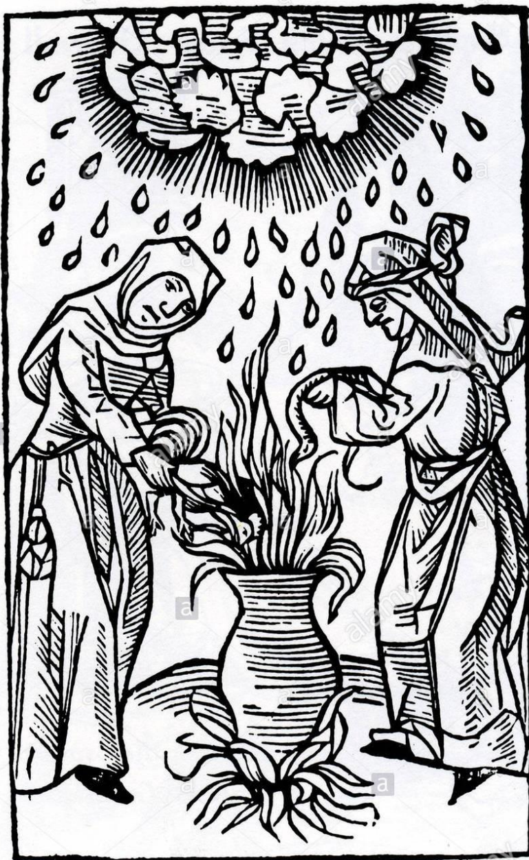
Slika 3. Ulrich Molitor, 15.st., jedan od najranijih prikaza vještica i njihove prakse