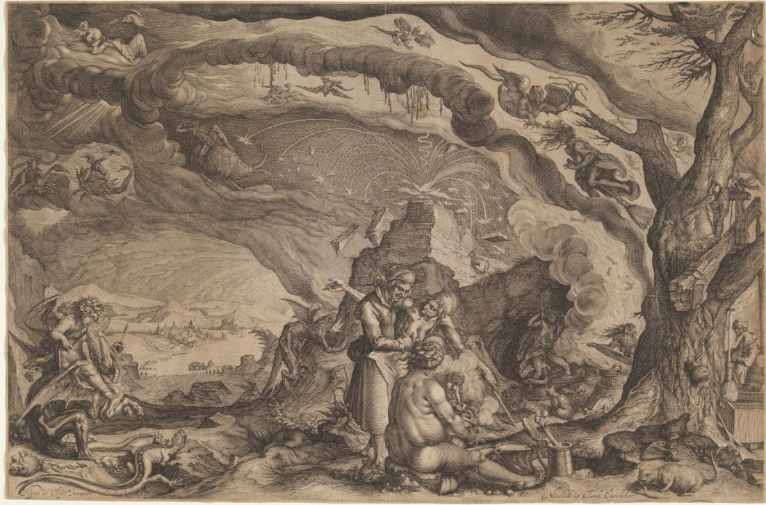
Andries Jacobsz – Priprema za Vješticij Sabat , 1610.