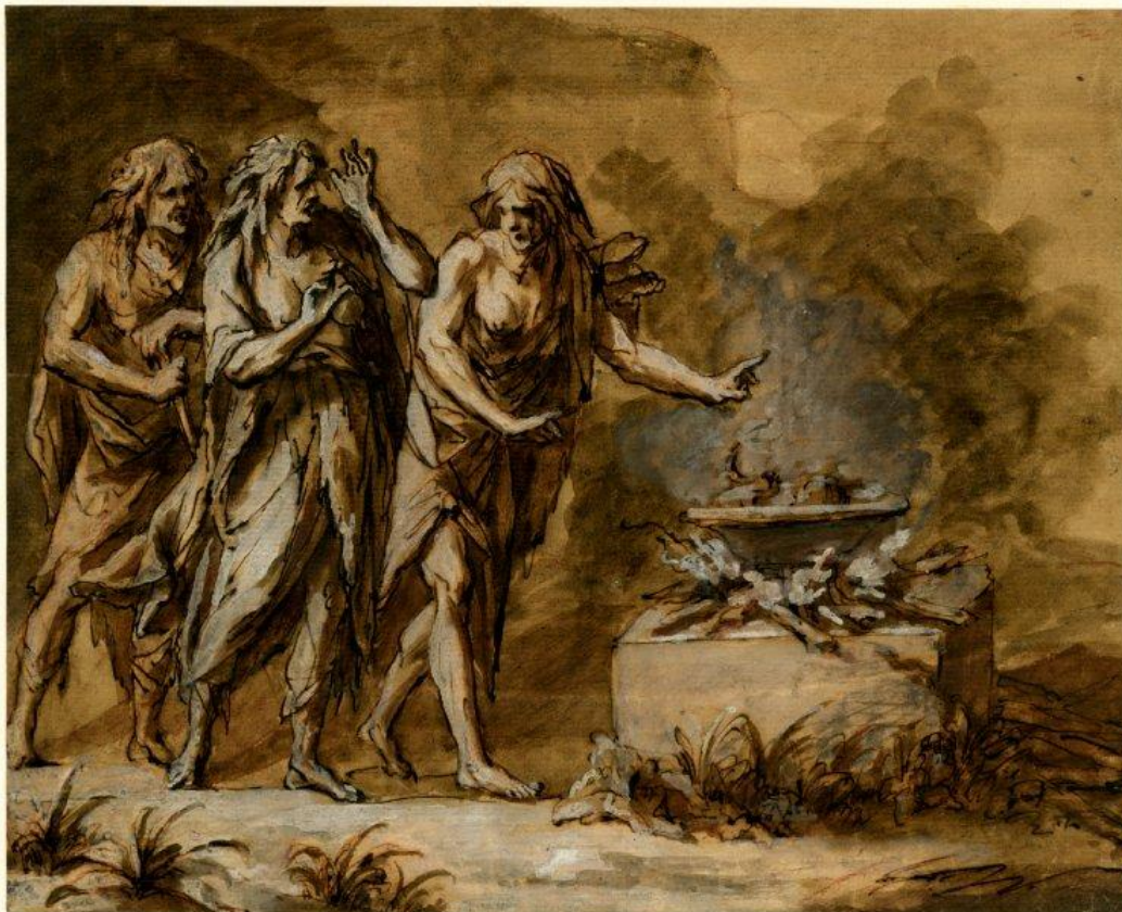
Slika 2. John Michael Rysbrack – Macbethove vještice , 18.st.