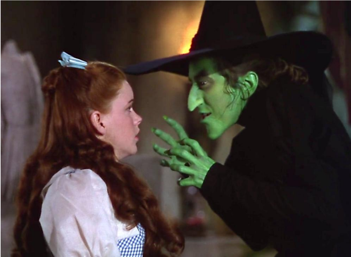
Slika 6. The Wicked Witch of the West