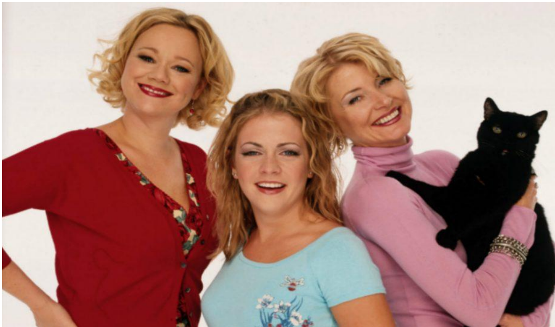
Slika 7. Sabrina the Teenage Witch