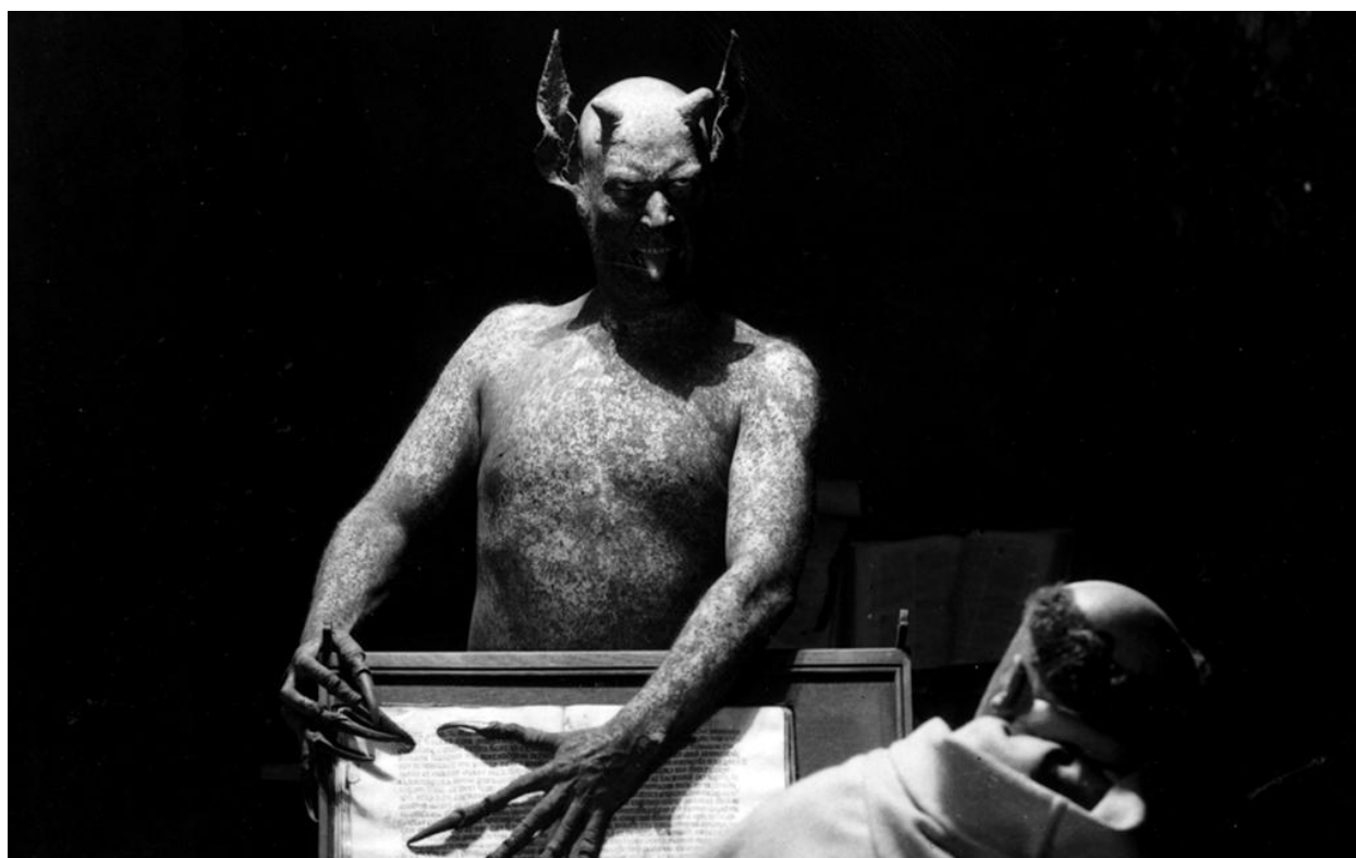
Slika 5. Scena iz filma Häxan, 1922.