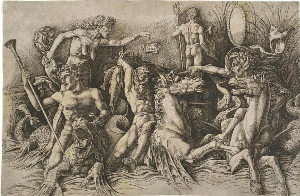
Slika 1. Andrea Mantegna – Battle of the Sea gods , 15.st.