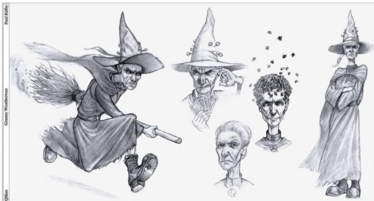
Slika 4. Granny Weatherwax