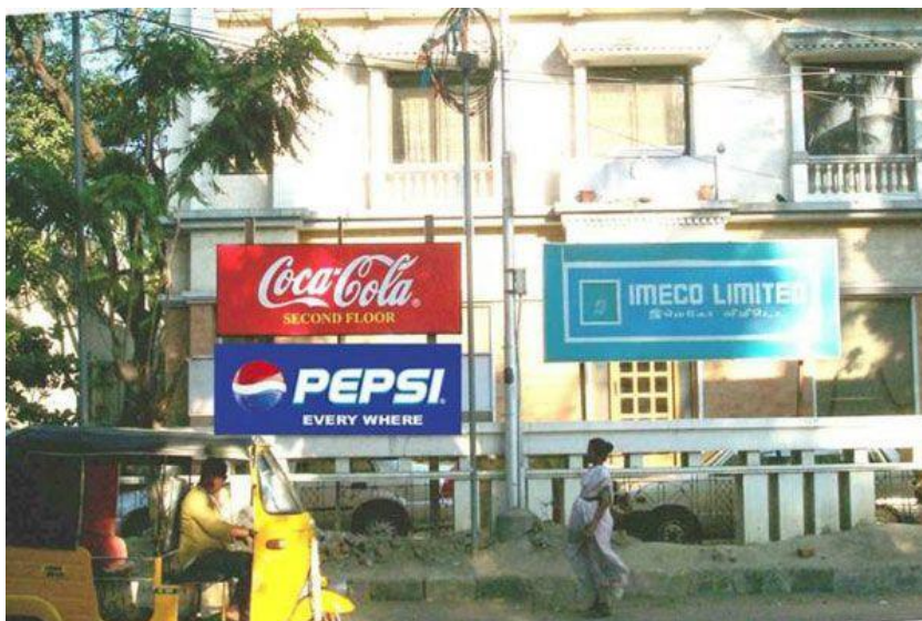
Slika 3: Rivalstvo Coca-Cole i Pepsija