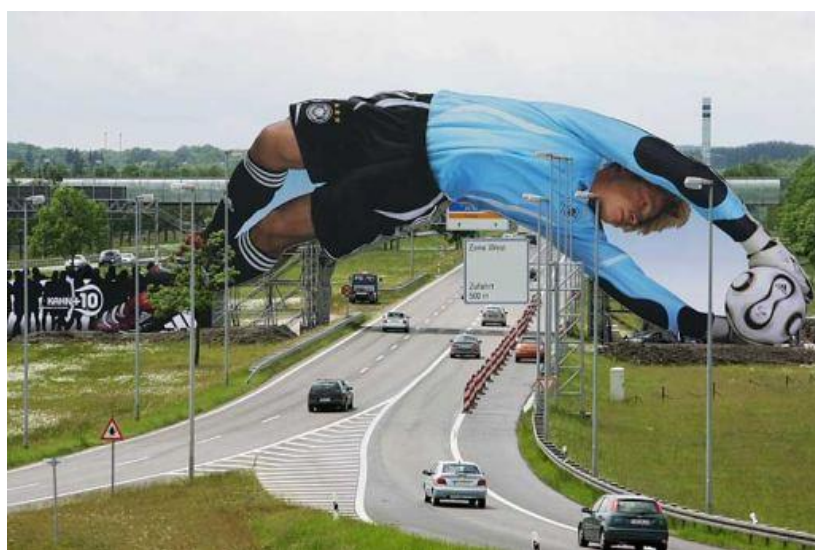
Slika 4: Adidasov primjer sensation marketinga