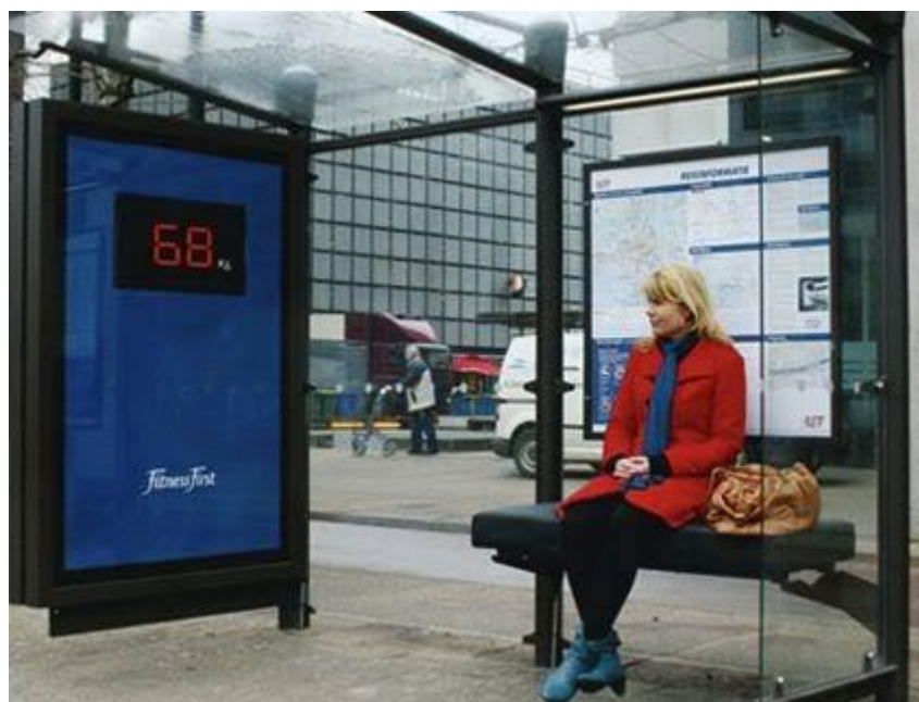
Slika 5: Primjer offline wait marketinga