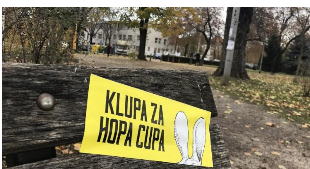
Slika 11: Hopa Cupa Heineken