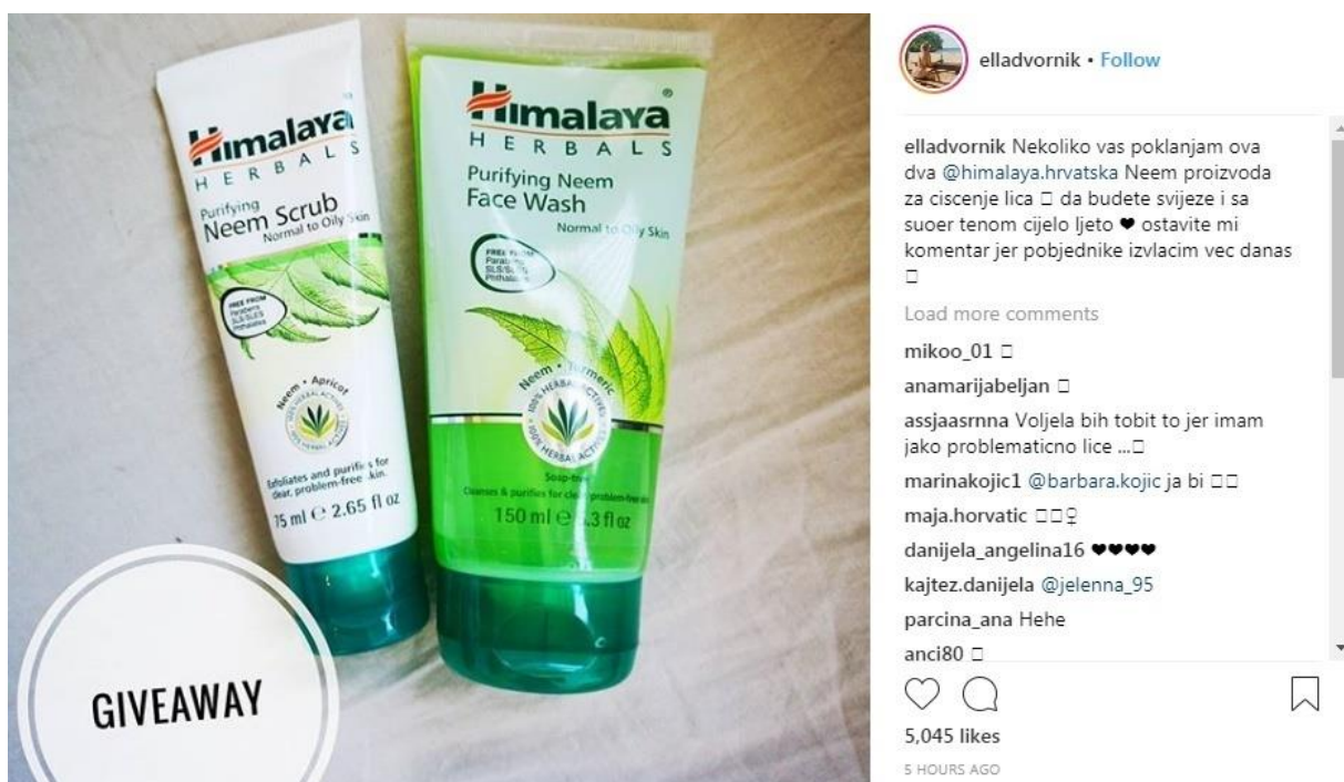
Slika 9: Primjer giveawaya