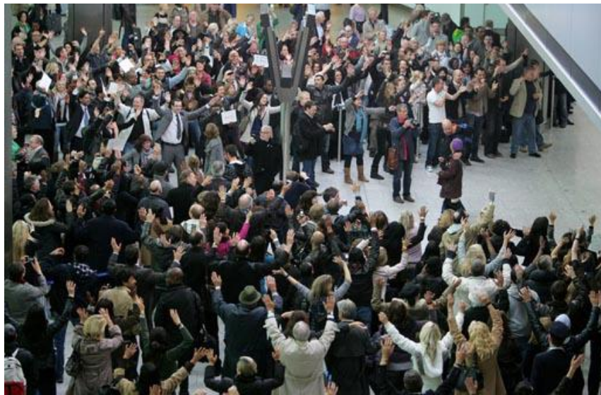
Slika 10: Primjer flashmoba tvrtke T-Mobile