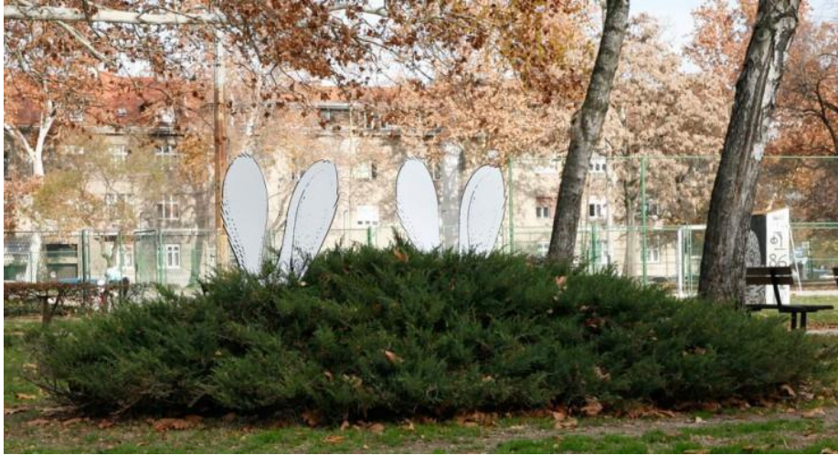
Slika 12: Primjer gerile za Hopa Cupa