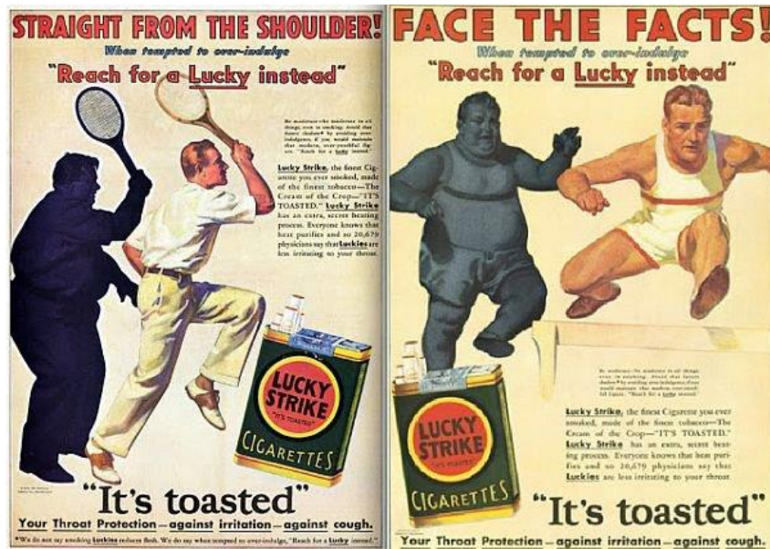
Slika 1: Kampanja Lucky Strikea