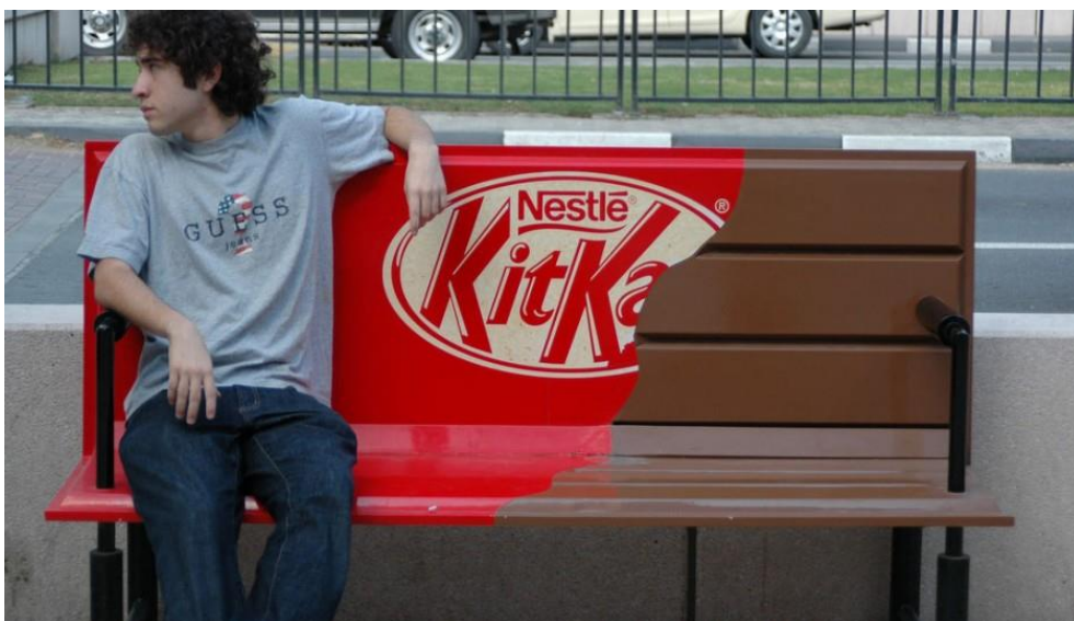
Slika 2: Primjer ambient marketinga tvrtke Nestle