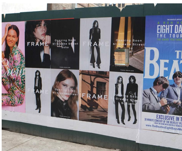
Slika 6: Primjer divljeg oglašavanja