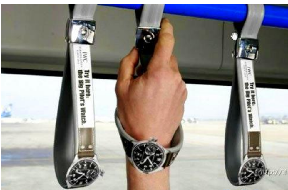
Slika 8: Primjer presence marketinga