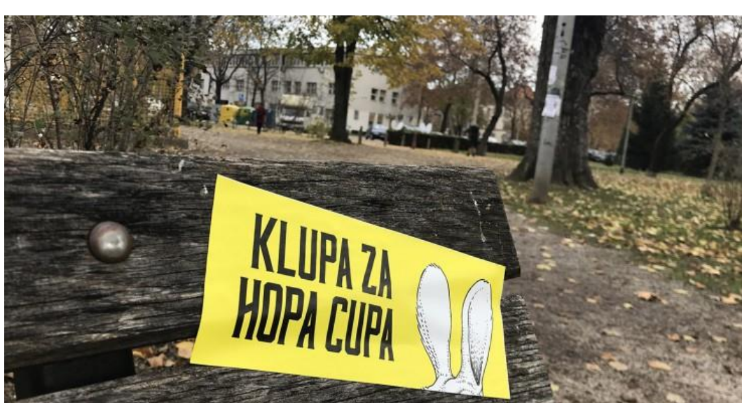
Slika 11: Hopa Cupa Heineken