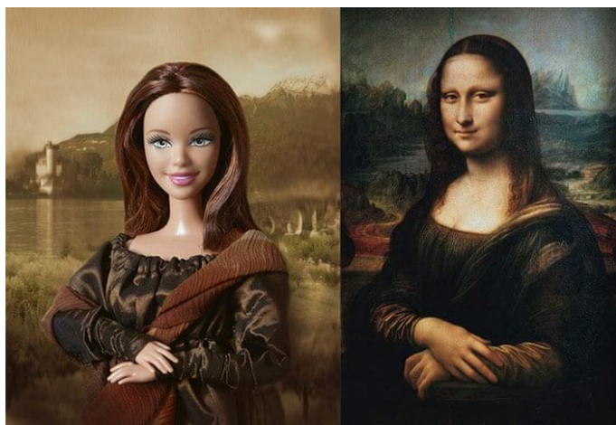
Slika 7, -Joselyn Grivaud- Leonardo Da Vinci's Mona Lisa

https://www.theguardian.com/artanddesign/gallery/2012/jan/29/fine-art-posed-by-barbies