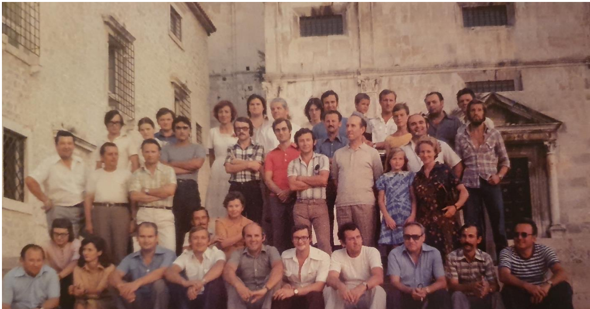
Slika 3. Polaznici i predavači Seminara za dirigente tamburaških orkestara i voditelje malih sastava u Zadru 1977. godine