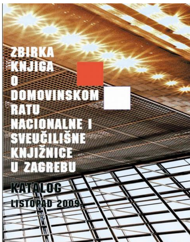
Slika 5. Zbirka knjiga o Domovinskom ratu Nacionalne i sveučilišne knjižnice u Zagrebu

Maštrović (2014:95) navodi kako su u čitaonici gdje je smještena Zbirka knjiga o Domovinskom ratu izloženi samo oni primjerci građe koji ne pripadaju u obvezne primjerke nacionalne zbirke knjiga Croatice koji se još nazivaju „arhivci“. Autor tvrdi kako je to u skladu sa stručnim i zakonskim zadaćama Knjižnice u zaštiti temeljnog fonda nacionalnog knjižničkog gradiva, koji se još naziva i nacionalnom memorijom.