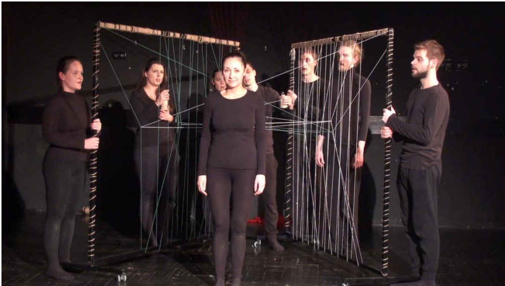
Slika 3: Scena inspirirana pjesmom: „Elma“

njihove konce. Daljnji razvoj pletenja obavljaju ljubavnici u dinamičnoj i nespretnoj igri između dva okvira što simbolizira njihov zajednički život sa svim usponima i padovima.