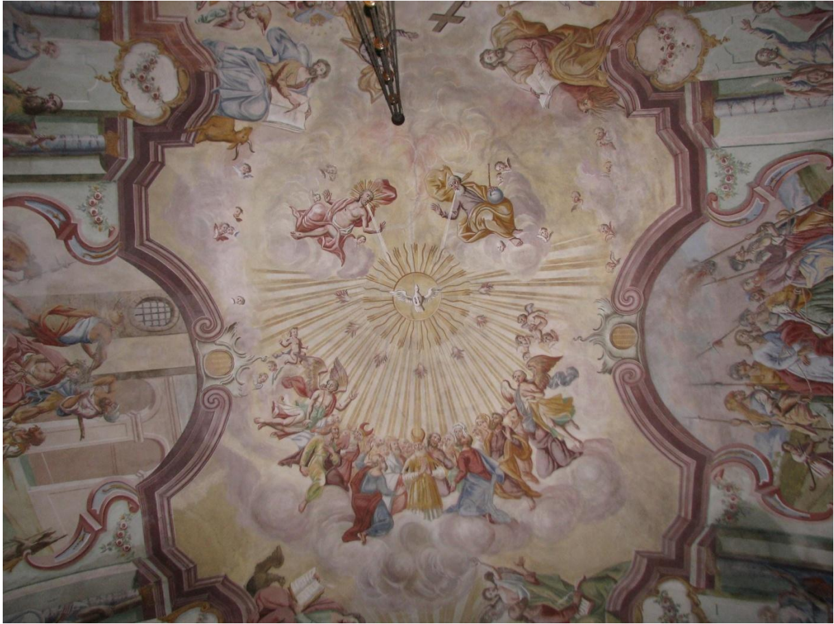
Prilog 9. Oslikani svod nad crkvenim brodom s prikazima Kristove muke i slave