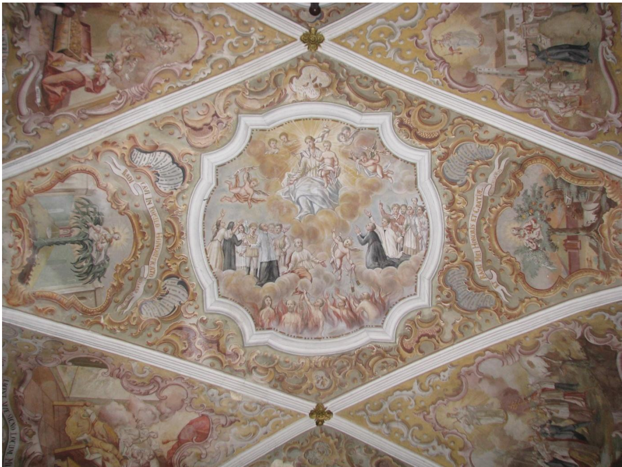
Prilog 8. Svod svetišta s legendom o Mariji Snježnoj. Djevica Marija upućuje škapular okupljenim vjernicima i dušama u čistilištu - središnji medaljon na svodu svetišta