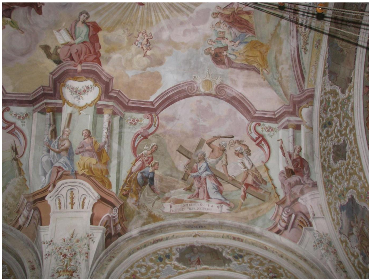
Prilog 13. Isus nosi križ