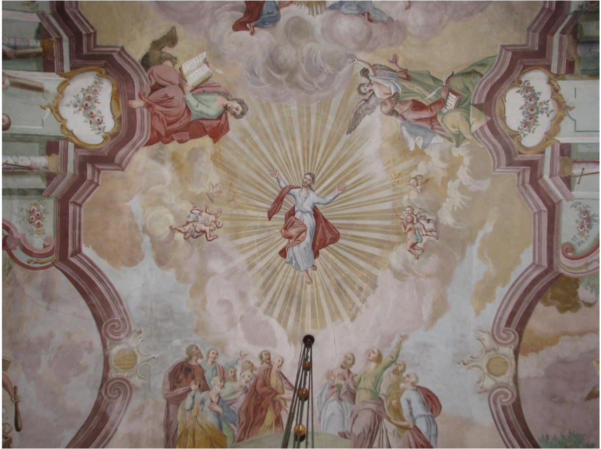
Prilog 14. Uznesenje