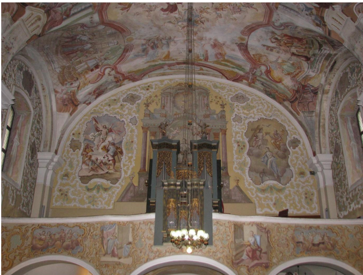
Prilog 19. Pogled na pjevališta i dio svoda