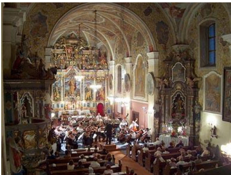
Prilog 5. Pogled na crkvenu lađu i svetište.