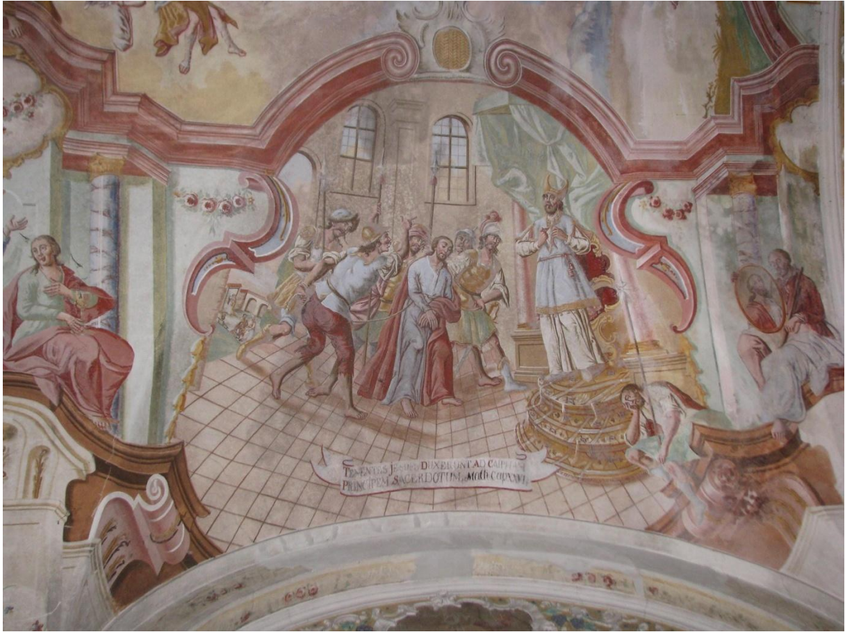
Prilog 11. Krist pred Kajfom