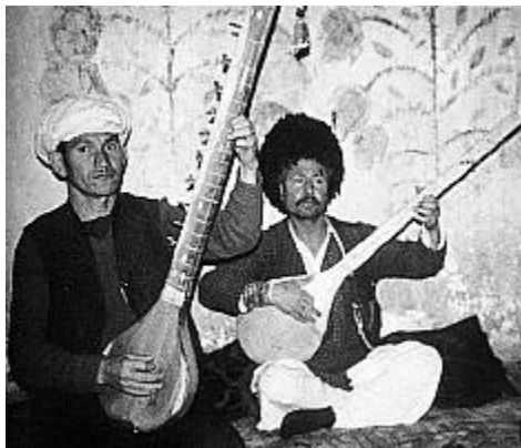
Slika 1. Tanbur - Afrika

Postoje brojni dokazi o postojanju ovog instrumenta kroz povijest, sačuvani su neki slikovni spomenici, u grčkoj se mitologiji također spominje kao glazbalo božice Pandore. Tambura je u Hrvatsku, točnije Slavoniju i Srijem, stigla od strane prognanog bosanskog stanovništva za vrijeme turskih osvajanja, a stigla je upravo iz Turske, te upravo zahvaljujući tom vremenu tambura u Slavoniji, Baranji i Srijemu postaje glazbeni idiom tih regija. (Ferić, 2011: 23)