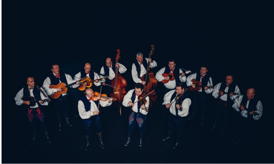
Slika 7. Tamburaški orkestar ansambla Lado

Uza sve do sada spomenuto valja napomenuti i posebno mjesto dati profesionalnom Tamburaškom orkestru Radiostanice Zagreb utemeljenom 1941. godine, koji kasnije prelazi na višu razinu te postaje Tamburaški orkestar Hrvatske radio televizije . Uz njega, profesionalni tamburaški orkestar ima i Ansambl Lado, nacionalni je folklorni ansambl osnovan 1949., sa zadaćom i ciljem da istražuje, prikuplja, umjetnički obrađuje i scenski prikazuje najljepše primjere bogate hrvatske glazbene i plesne djelatnosti. 11. studenoga 1949. ukazom Vlade NR Hrvatske, osnovan je Državni zbor narodnih plesova i pjesama (DZNPiP) . Od prvoga dana „LADO“ djeluje u istoj zgradi na Trgu maršala Tita (danas Trg Republike Hrvatske), poznatoj pod nazivom „Hrvatski dom“, zgradi čiji su vlasnici bila dva društva: „Hrvatski Sokol“ i Hrvatsko pjevačko društvo „Kolo“ koja su u njoj godinama djelovala. Danas je u njoj smještena i Akademija dramske umjetnosti te dvorana za pokuse baleta HNK. I upravo je ta zgrada za vrijeme agresije na Hrvatsku bila metom raketnih napada u svibnju 1995. kada su ranjeni članovi Baleta. Naziv ansambla "Državni zbor narodnih plesova i pjesma" promijenjen je 7. lipnja 1979. godine u „LADO profesionalni folklorni ansambl Hrvatske“, a dana 1. srpnja 1980. godine u današnji „Ansambl narodnih plesova i pjesama Hrvatske LADO“. 1