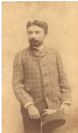
Slika 10. Milutin Farkaš

Djela: Kratka uputa u tamburanje po kajdah (od 4. izd. naslov: Kratka teoretičko-praktična uputa u tamburanje po kajdah ). Zagreb 1988. — Album za brač I. Zbirka hrvatskih popievaka . Zagreb 1905. — Skladbe za brač I. i glasovir . Zagreb 1905. — Hrvatska polka . (S. 1.) 1909. — Album za brač I. Zbirka hrvatskih koračnica . Sisak 1911.