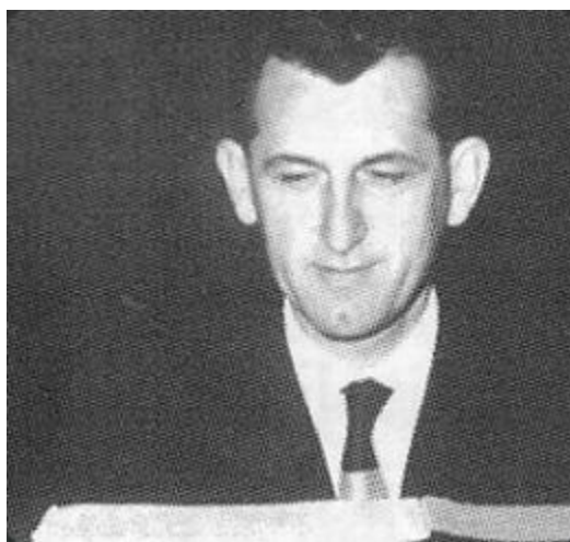
Slika 12. Julije Njikoš

Glazbu je učio u Osijeku i Zagrebu. Od 1951.–67. glazbeni je urednik „Radio–Osijeka“ gdje utemeljuje Tamburaški orkestar Radio Osijeka ; od 1967.–84. glazbeni je urednik i komentator „Radio–Zagreba“. U Osijeku vodio Radničko KUD Josip Kraš i Slavonsko tamburaško društvo Pajo Kolarić , kojemu je bio jedan od utemeljitelja i s kojim je često nastupao u zemlji i inozemstvu. Bio je i među osnivačima (1961.) te predsjednik Umjetničkog savjeta Festivala tamburaške glazbe u Osijeku i festivala zabavne glazbe „Zvuci Panonije“ (1972.), predsjednik Hrvatskog tamburaškog saveza u Osijeku , glavni urednik „Hrvatske tamburice“, glasila za promicanje tamburaške glazbe i urednik notnih izdanja Tamburaški orkestri KPSH . Bavio se melografijom i poviješću tamburaške glazbe u nas. Zabilježio je oko 4000 narodnih pjesama, kola i poskočica iz Slavonije. Dobitnik je brojnih nagrada i priznanja. Navest ćemo tek neka djela: Slavonska rapsodija br. 1. i 2. ; Podravska rapsodija ; Zagorska rapsodija ; Baranjska rapsodija ; Vojvođanska rapsodija ; Šokadija, kantata za sopran, mješoviti zbor i orkestar , 1961. Mise za alt solo, mješoviti zbor, tamburaški orkestar i orgulje: Djetesce nam se rodilo. 8