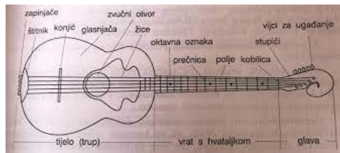
Slika 2. Dijelovi tambure

Trup može biti izdubljen u komadu drva javora, klena, šljive, kruške, lipe, ... Trup tambure može biti ovalnog (eliptičnog), kruškolikog, tikvastog ili violinskog oblika. Na šuplji se trup tambure lijepi gornja tanka daščica, glasnjača koja pojačava zvuk titrajuće žice i služi kao rezonator. Vrat veže trup i glavu tambure. Donja mu je strana zaobljena, a gornja ravna. Na ravnu je stranu vrata pričvršćena hvataljka od tvrdog ili egzotičnog drveta, a po njoj su zabijene prečnice od tanke čelične žice. Prečnice omeđuju polja tambure i broje se od glave prema trupu. Glava je kod starih tambura imala šiljat ukrašen oblik, a kod novijih pužoliki. U glavu su kod starijih tambura bili utaknuti drveni vijci i metalni mehanizam za navijanje žica. Glavu i vrat dijeli kobilica od kosti ili tvrdog drveta s utorima u koje se stavljaju žice. Na donjem se dijelu trupa vežu zapinjače, prekrivene metalnim ili kožnim štitnikom kao zaštita od uboda oštih krajeva žica. (Ferić, 2011: 20)