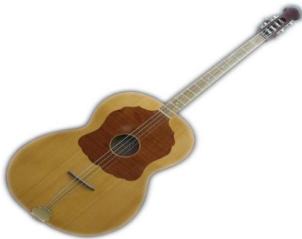
Slika 5. Čelo

Bugarija je akordičko i ritmičko glazbalo. Čelo udvaja ili ukrašava basovu pratnju. Berde imaju ulogu basa u tamburaškom orkestru, ugođene su oktavu niže od čela.