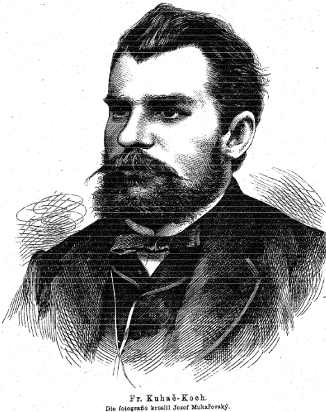
Slika 9. Franjo Ksaver Kuhač

godina objavio je veći broj knjiga, monografija, studija, prijevoda i članaka. Posebno su vrijedne Kuhačeve knjige: Vatroslav Lisinski i njegovo doba (1887., 1904), Ilirski glazbenici: prilozi za poviest hrvatskoga preporoda (1893), Osobine narodne glasbe, naročito hrvatske, opsežna studija u tri sveska objavljena u Radu JAZU (1905., 1908. i 1909), prijevod Katekizma glazbe Johanna Christiana Lobeja (1875., 21889) te monografije i članci Josip Haydn i hrvatske pučke popievke (1880), Franjo Krežma violinski virtuoz i komponista (1882–83), Nova glazbena struja njemačka i sadašnji talijanski kompozitori (1892), Beethoven i hrvatske narodne popievke (1894), Hrvatsko glazbeno nazivlje (1896), Josip Tartini i hrvatska pučka glazba (1898) i dr. Skladao je pretežno plesnu i salonsku glazbu. Kuhačeva ostavština i obilna korespondencija čuvaju se u Zagrebu, u Nacionalnoj i sveučilišnoj knjižnici, arhivu HAZU i Hrvatskome državnom arhivu. 5