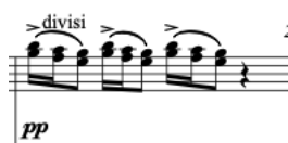
Slika br. 8: Notni primjer, odgovor bisernice

Ritamski obrazac koji se pojavljuje od 12. do 15. takta ponavlja se sve do 20. takta, a onda kasnije samo triole koje se ponavljaju sve do 45. takta. Bisernice 1 vrlo su bitne u ovom dijelu jer odgovaraju na cijeli orkestar zajedno s E-bračem, kao što je to u taktovima 23 i 26.