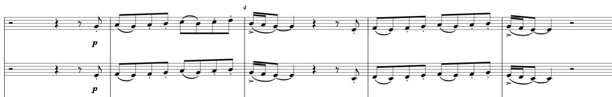
Slika br. 7: Notni primjer, melodija bisernice 1 i bisernice 2

Ritamski obrazac koji se pojavljuje od 12. do 15. takta ponavlja se sve do 20. takta, a onda kasnije samo triole koje se ponavljaju sve do 45. takta. Bisernice 1 vrlo su bitne u ovom dijelu jer odgovaraju na cijeli orkestar zajedno s E-bračem, kao što je to u taktovima 23 i 26.