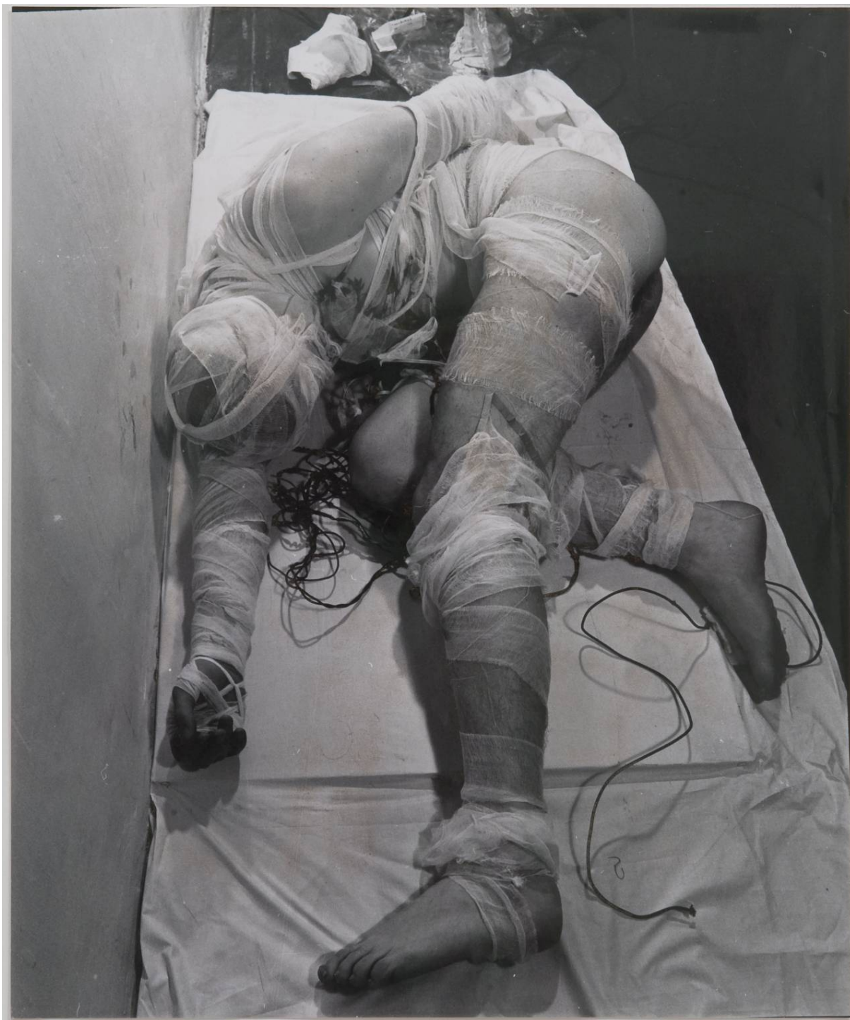
Rudolf Schwarzkogler, Treće djelovanje , 1965., Beč