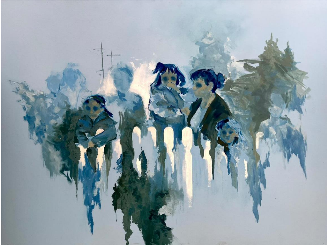
Slika 4: Na ogradi