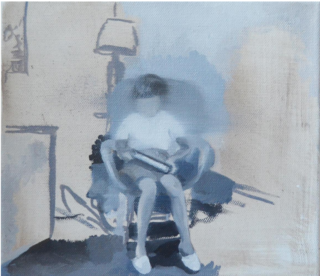
Slika 8: Nam Chau - bez naziva

Nam Chau je njemačko-vijetnamska umjetnica koja se bavi konceptom sjećanja i baštine u svojim slikama. Rođena je u Hanoveru u Njemačkoj a tijekom odrastanja, osim u Njemačkoj, živjela je u Francuskoj i Južnoj Africi. Studirala je slikarstvo na Umjetničkoj akademiji u Berlinu. U svojoj seriji „My Mother's Camp“ umjetnica odlazi na zamišljeno putovanje u sebi nepoznatu situaciju. Ona zamišlja put svoje majke koja je pobjegla iz vijetnamskog izbjegličkog logora. Stvara mutne i zamagljene slike koje predstavljaju sjećanja na mjesta na kojima nikada nije bila. 12