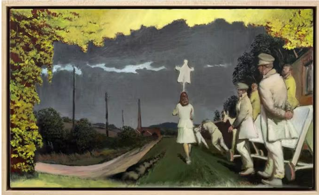
Slika 7: Neo Rauch – Der goldene Weg

uključujući Giorgia de Chirica i Renée Magrittea. Rauch svoje slike oklijeva klasificirati kao nadrealističke, ali priznaje utjecaj snova i mašte. 11