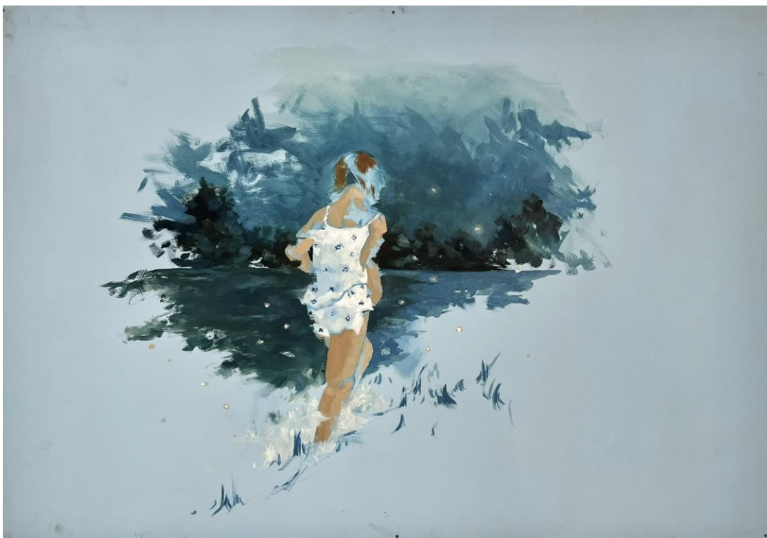
Slika 6: Krijesnice