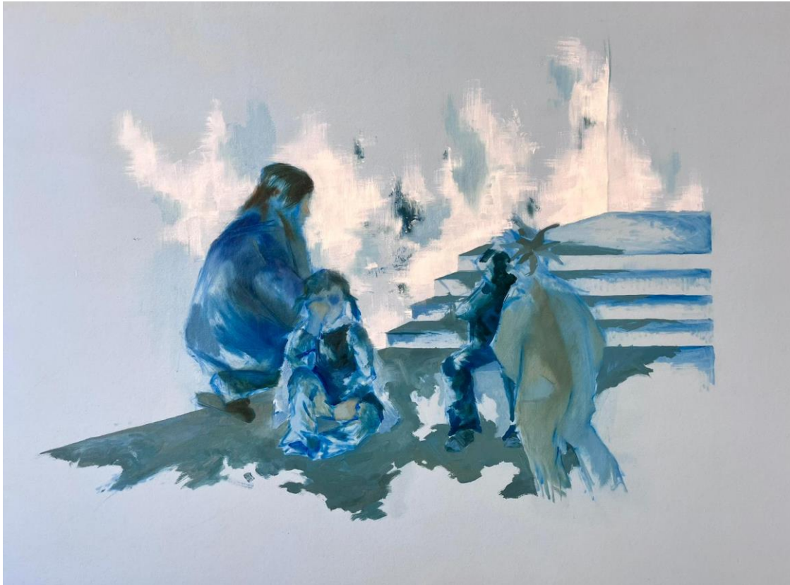
Slika 5: Maškare