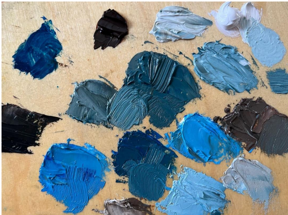
Slika 3: boje na paleti

Završni rad „ Plava sjećanja “ sastoji se od 3 slike veličine 100x70 centimetara rađene tehnikom uljane boje na ljepenki. Podloga je pripremljena s tri namaza mješavine akrilnog gesso-a i prusko plave akrilne boje koji ujedno služe i kao pozadina za kompozicije. Od uljanih boja korištene su prusko plava, spaljeni umber i titanium bijela.