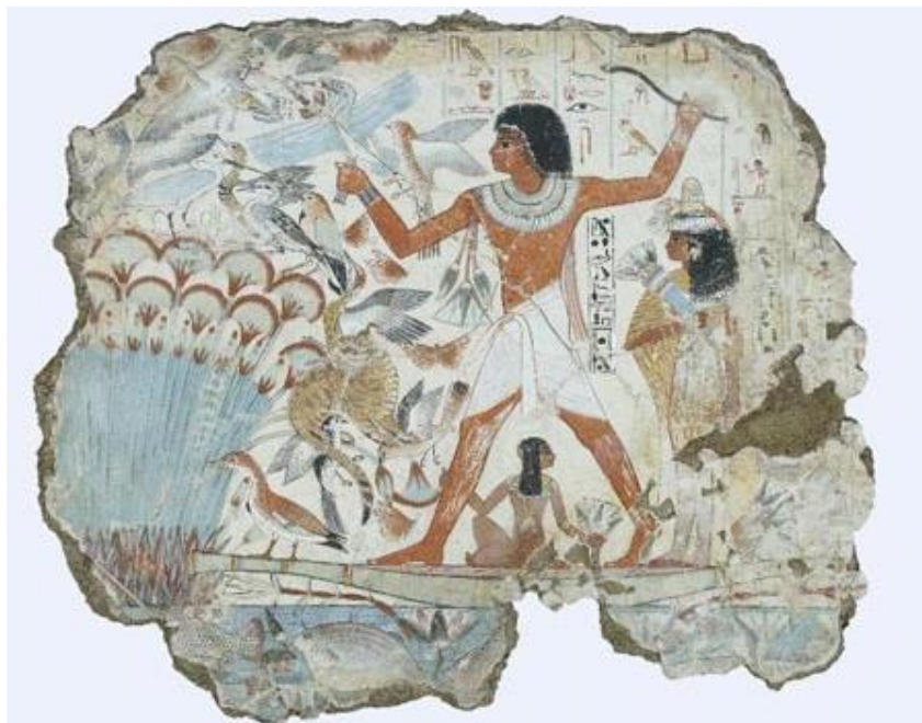
Slika 1: Zidna slika s egipatskom plavom - Nebamunova grobnica iz 18. dinastije

Egipćani su bili su jedna od rijetkih drevnih kultura koja je znatnije koristila plavu boju. Proizveli su pigment zvan "egipatska plava" koji se osim u slikarstvu koristio i za izradu nakita, u kiparstvu i u drugim oblicima umjetnosti. Egipćani su plavu boju često upotrebljavali u vjerskim i simboličkim kontekstima za predstavljanje neba i božanstva, vode, plodnosti i života.