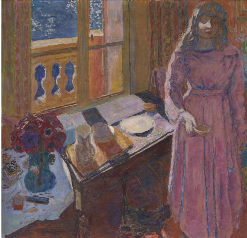
Slika 9: Pierre Bonnard - Zdjelica s mlijekom

Bonnard jednostavnu skicu napravljenu u trenutku, koji želi zauvijek zabilježiti, koristi kako bi se prisjetio motiva koji zatim slika iz sjećanja. Time eliminira težnju za točnim prikazom detalja kako bi u prvi plan stavio osjećaj koji ga je inspirirao. Dok su prvobitne skice za slike iz serije „Plava sjećanja“ rađene prema fotografijama, one se ne pojavljuju u procesu slikanja. Bonnardov pristup inspirirao je potpuno odmicanje od izvora fotografije kako bi se fokus stavio na osjećaje koje odabrana sjećanja izazivaju i koje slike pokušavaju prenijeti.