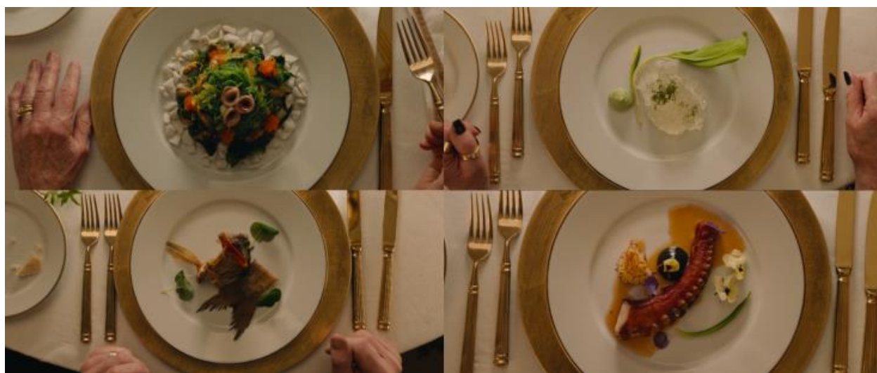
Slika 11. Otmjena jela

Sličan primjer uporabe objekata materijalnog bogatstva radi pojačavanja diskursa o ekstremnoj privilegiranosti bogatih pojavljuje se u scenama luksuzne kapetanove večere od sedam sljedova. Prikaz tanjura u krupnom planu popraćen je specifičnim leksičkim izborima. Gostima su poslužena otmjena jela: „Kamenica s daškom crnog ruskog kavijara”, „Morski jež u emulziji od morskih algi, posut crnim tartufom, kavijarom i čili uljem, preliven yuzu vinaigretteom”, „Pečena i dimljena hobotnica s karameliziranim limunom, posuta vrtnim cvijećem.” (vidi sliku 11).