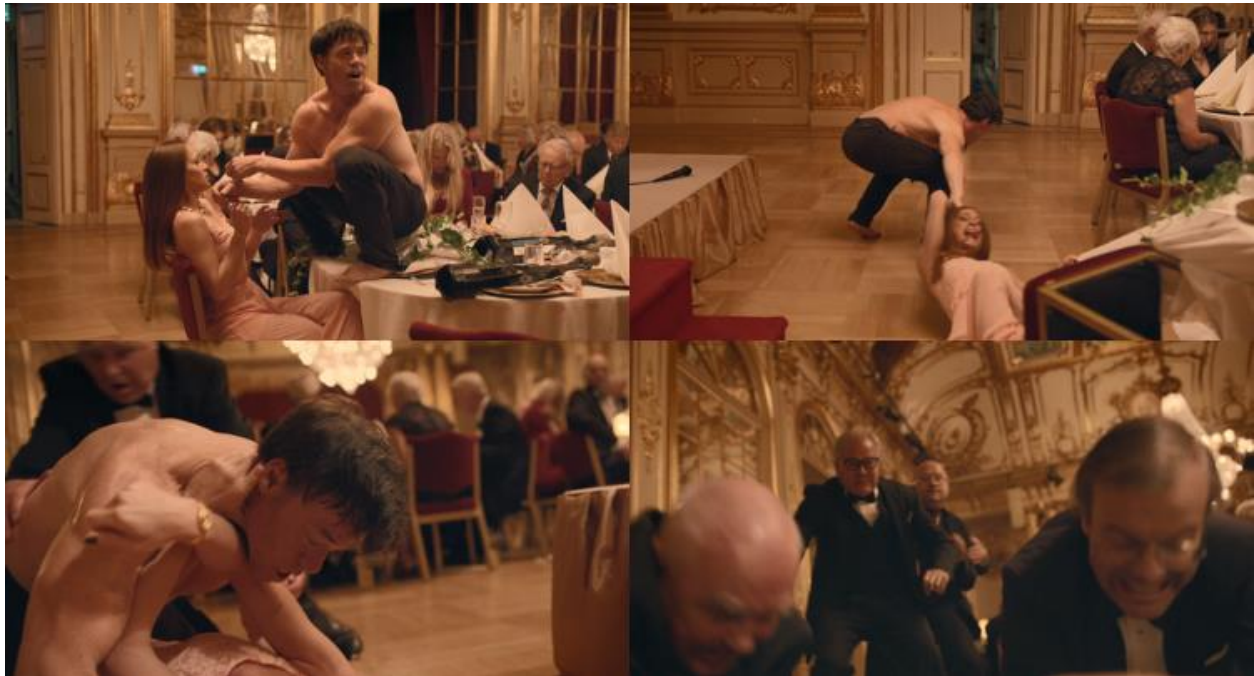
Slika 7. Eskalacija nasilja Izvor: Fredrik Wenzel ©Plattform Produktion (obrada autora)

Olegov performans funkcioniše i kao socijalni eksperiment koji razotkriva poteškoće u prevladavanju socijalne indiferentnosti u kontekstu kasnomodernih zapadnih društava, obilježenih snažnim individualizmom i moralnim relativizmom. Uspostavljanjem scenskog okvira koji zahtijeva kognitivnu konfrontaciju, Östlund suočava gledatelja s autorefleksijom i neugodnim promišljanjem o tome koliko dugo pojedinac, uključujući i samog gledatelja, može tolerirati opasnost koja prijete drugima prije nego što osjeti potrebu za intervencijom i napuštanjem vlastite suspendirane stvarnosti.