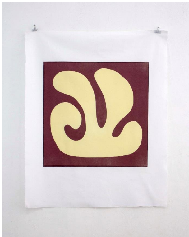
Slika 11. Slobodna forma IV , linorez, 80 x 100 cm, 2024.