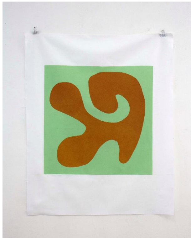
Slika 10. Slobodna forma III , linorez, 80 x 100 cm, 2024.