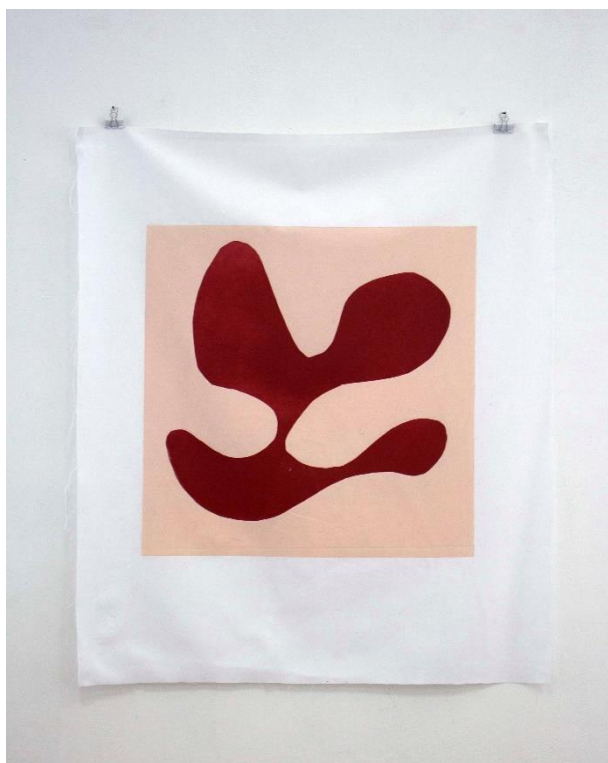
Slika 12. Slobodna forma V , linorez, 80 x 100 cm, 2024.