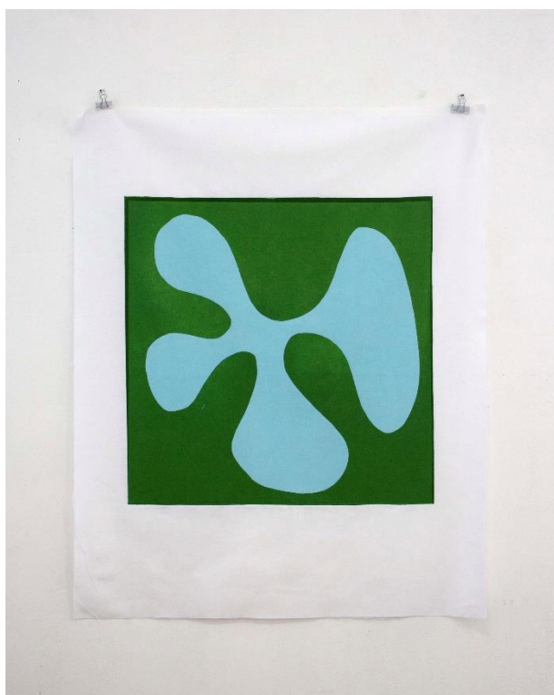
Slika 14. Slobodna forma VII , linorez, 80 x 100 cm, 2024.