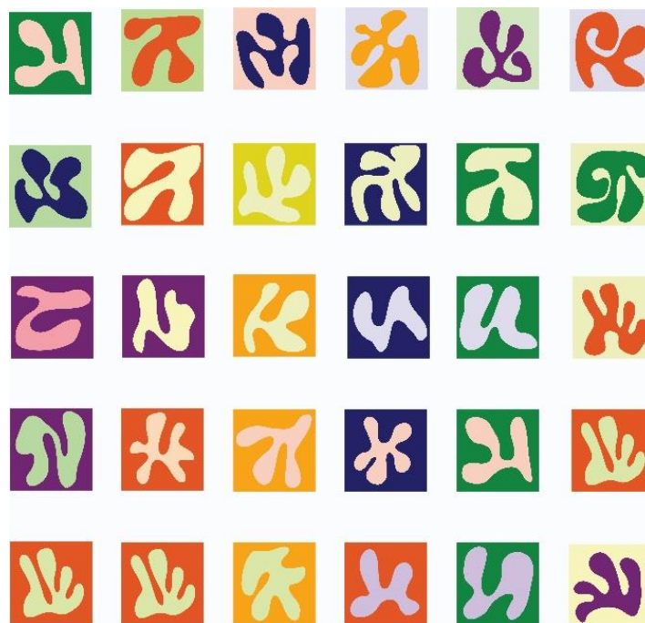
Slika 5. Digitalne skice za rad Slobodna forma

Nakon dovršetka skica, kreće izrada matrica u linorezu. Kao što je navedeno ranije, oblici se nisu rezbarili, već su se izrezivali iz linoleuma. Izrezana su dva kvadrata, dimenzija 60x60 centimetara i 59x59 centimetara. Odabrano je pet oblika koji su izrezani u pozitivu i negativu, pozitiv dimenzija do 59x59 centimetara, a negativ 60x60 centimetara. Nakon što su se sve matrice izrezale, rubovi su izbrušeni brusnim papirom kako bi imali gladak i zaobljen obrub bitan za dojam organičnosti. Prije nego što se kreće u proces otiskivanja priprema se boja za visoki tisak. Svaki otisak u mom radu ima kontrast svijetlo-tamno, pa je tako svijetla boja uvijek miješana sa pokrivnom bijelom bojom. U tamniju je boju uvijek dodano malo crne boje kako bi se naglasio kontrast, ali i iz razloga što se pokazalo da je tamnija boja uvijek djelovala svjetlije na otisku budući da je preklapala svjetliju boju.