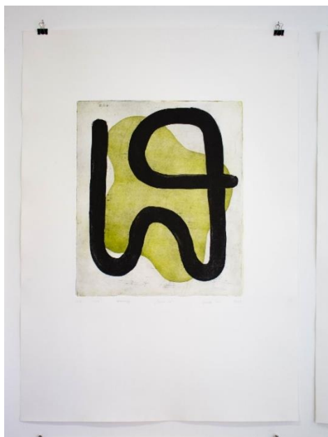
Slika 1. Forma IV , rezervag , 70 x 100 cm, 2022.

Rad Konvergencije nastavlja se na temu Formi . Rad je nastao 2023. na diplomskom studiju pod mentorstvom doc.art. Marija Matokovi a i umj. sur. Krunoslava Dundovi a. Ključni element ovog rada jest kombiniranje razli itih matrica u jedan otisak, stvarajući neo ekivanu kompoziciju koja otkriva nove vizualne forme (Slika 2). Konvergencija se definira kao proces približavanja ili susreta razli itih elemenata prema zajedni kom cilju ili ideji, što se o ituje u kombiniranju matrica radi stvaranja jedinstvenih otisaka. Kroz ovaj proces istraŹujem rezultate svog rada i otkrivam vaŹnost samog postupka otiskivanja u grafici, što se nastavlja i u ovom trenutnom radu.