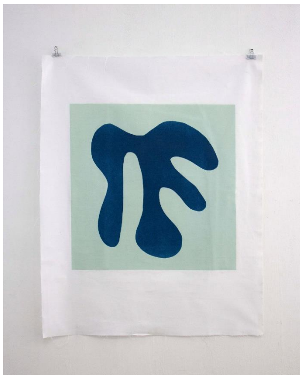
Slika 15. Slobodna forma VIII , linorez, 80 x 100 cm, 2024.