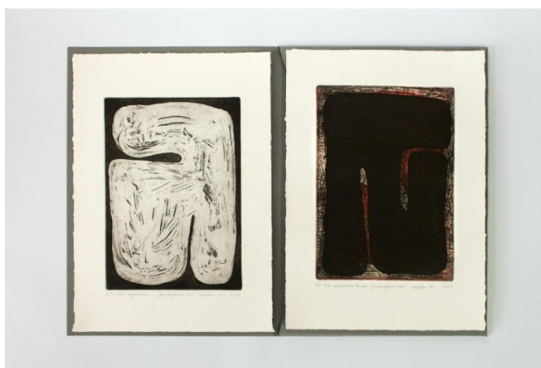
Slika 2. Konvergencije , rezervag  i aquatinta, 25 x 35 cm, 2023.

Rad Konvergencije nastavlja se na temu Formi . Rad je nastao 2023. na diplomskom studiju pod mentorstvom doc.art. Marija Matokovi a i umj. sur. Krunoslava Dundovi a. Ključni element ovog rada jest kombiniranje razli itih matrica u jedan otisak, stvarajući neo ekivanu kompoziciju koja otkriva nove vizualne forme (Slika 2). Konvergencija se definira kao proces približavanja ili susreta razli itih elemenata prema zajedni kom cilju ili ideji, što se o ituje u kombiniranju matrica radi stvaranja jedinstvenih otisaka. Kroz ovaj proces istraŹujem rezultate svog rada i otkrivam vaŹnost samog postupka otiskivanja u grafici, što se nastavlja i u ovom trenutnom radu.