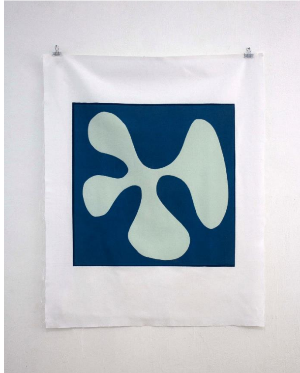
Slika 9. Slobodna forma II , linorez, 80 x 100 cm, 2024.