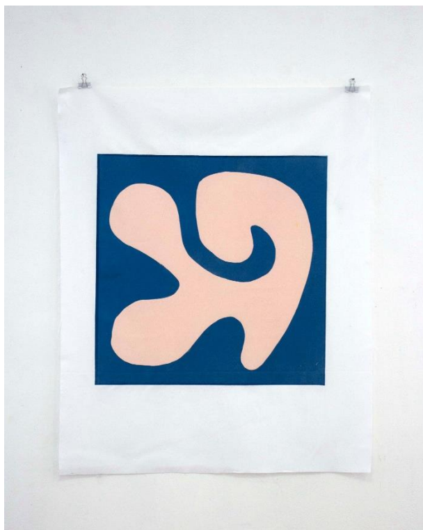
Slika 13. Slobodna forma VI , linorez, 80 x 100 cm, 2024.