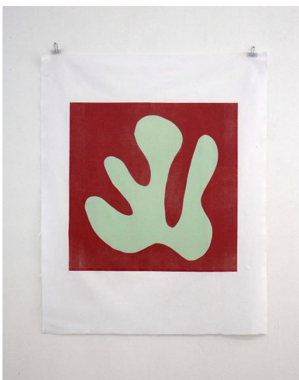
Slika 8. Slobodna forma I , linorez, 80 x 100 cm, 2024.