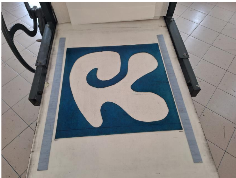
Slika 7. Otiskivanje oblika u negativu