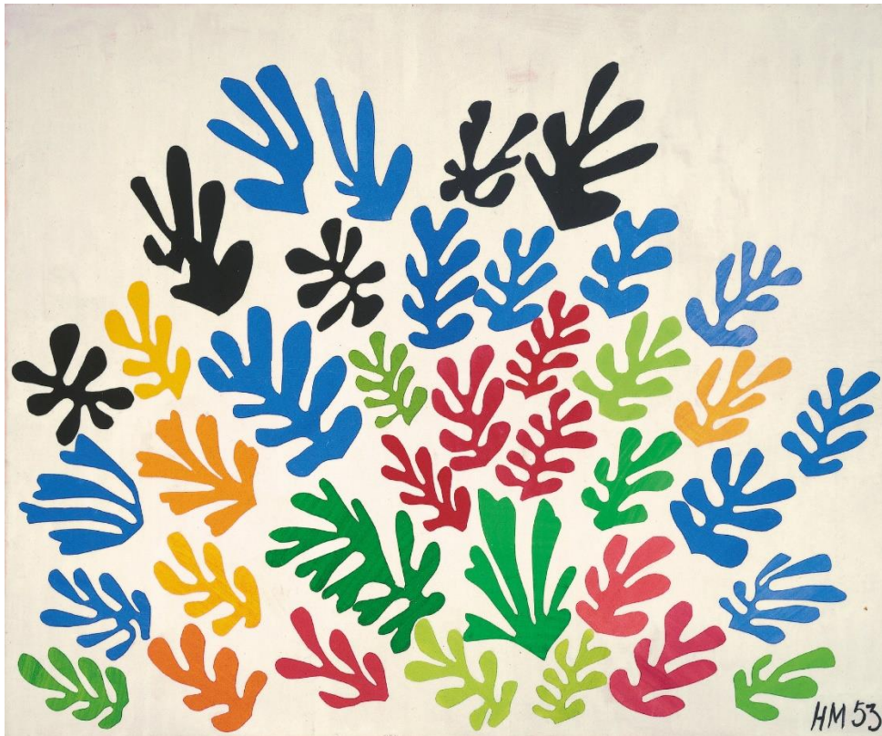
Slika 3. Henri Matisse, Snop , 1953.