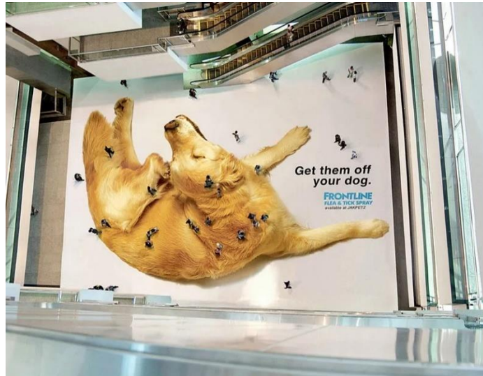
Slika 2. Tvrtka Frontline iskoristila je slučajne prolaznike kako bi oglasila svoj sprej protiv buha

Tvrtka Frontline iskoristila je ovakvu vrste gerile kada je odlučila predstaviti svoj sprej protiv buha kod pasa. Zakupili su dio trgovačkog centra te na njega zalijepili ogromnu sliku zlatnog retrievera koji se češe. Kupci u prolazu hodajući preko slike s kata iznad izgledali su poput buha koje smetaju psu te su tako nesvjesno pomogli Frontlineu u oglašavanju (Coursera, 2024).