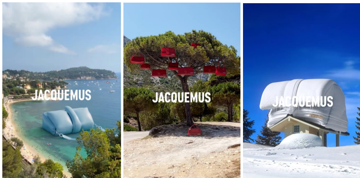
Slika 9. Scene videozapisa stvorene digitalnom 3D tehnikom prikazuju Bambino torbe u raznim situacijama

Digitalne tehnologije revolucionirale su način poslovanja poduzeća, od načina na koji komuniciraju s klijentima do načina na koji strukturiraju svoje interne operacije. Tvrtnice sada mogu iskoristiti digitalne tehnologije za stvaranje učinkovitijih i djelotvornijih procese kao i za stvaranje novih proizvoda i usluga koje ranije nisu bile moguće (Rathore, 2021). Jacquemusov marketinški tim pronašao je formulu uspješnih objava u obliku gerile, točnije 3D umjetnosti koja je zaintrigirala njihove pratitelje, ali i brojne druge. Zanimljive videosadržaje plasirali su umjereno u kombinaciji s ostalim objavama. Unatoč uspjehu takvog sadržaja, nisu ga koristili prekomjerno i zasitili publiku, već su ga dozirali povremenim objavljivanjem. Potaknuli su nagađanja i rasprave te nagomilali milijune pregleda i tisuće interakcija. Medium , Culted , Brand Insider , Hypebeast samo su neki od internetskih portala koji su pisali o uspjehu Jacquemus marketinga u svojim člancima. Uspješno su promovirali svoj brend i proizvode te postigli ono čemu svaka uspješna tvrtka teži – privući pažnju.