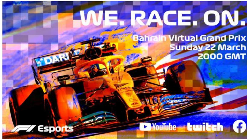
Slika 8. Promotivni plakat F1 EVGP događaja iz 2020. godine