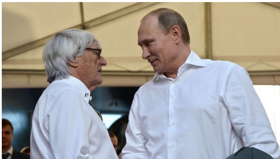
Slika 7. Bernie Ecclestone i ruski predsjednik Vladimir Putin na VN Rusije u Sočiju.