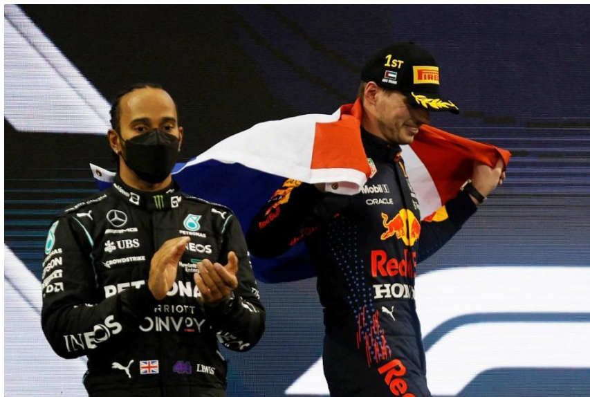
Slika 6. Max Verstappen slavi naslov svjetskog prvaka, 12. prosinca 2021.

prekinuti njihovu vlast. U 2020. godini, Lewis Hamilton je ispisao povijest osvojivši svoj sedmi naslov i tako izjednačio rekord Michaela Schumachera, unatoč smetnjama koje je izazvala pandemija COVID-19. Međutim, 2021. godina označila je značajnu promjenu kada je Max Verstappen napokon okončao Hamiltonovu vladavinu postavši svjetskim prvakom. Iako je Mercedes zadržao naslov konstruktora, uvođenje sprint utrka dodalo je napetost sezoni. (Službena stranica Formula one art & genius, pristupljeno 3.8.2023.) No, priča nije završila tamo. U 2022. godini, Red Bull Racing i Max Verstappen nastavili su svoj uspon, osvojivši oba naslova. Ova pobjeda označila je novo razdoblje u Formuli 1, s Verstappenom i Red Bullom koji su svrgnuli nekada nepobjedivi Mercedes i Hamiltona. Uz sve to, Ferrari je ostvario impresivan povratak u 2022. godini, predvođeni Carlosom Sainzom i Charlesom Leclercom koji su pokazali svoje talente i gurnuli tim u sam vrh borbe za prvenstvo. Formula 1 je zakoračila u uzbudljivo novo razdoblje s više konkurenata koji se nadmeću za slavu, obećavajući navijačima još uzbudljivih sezona u budućnosti.