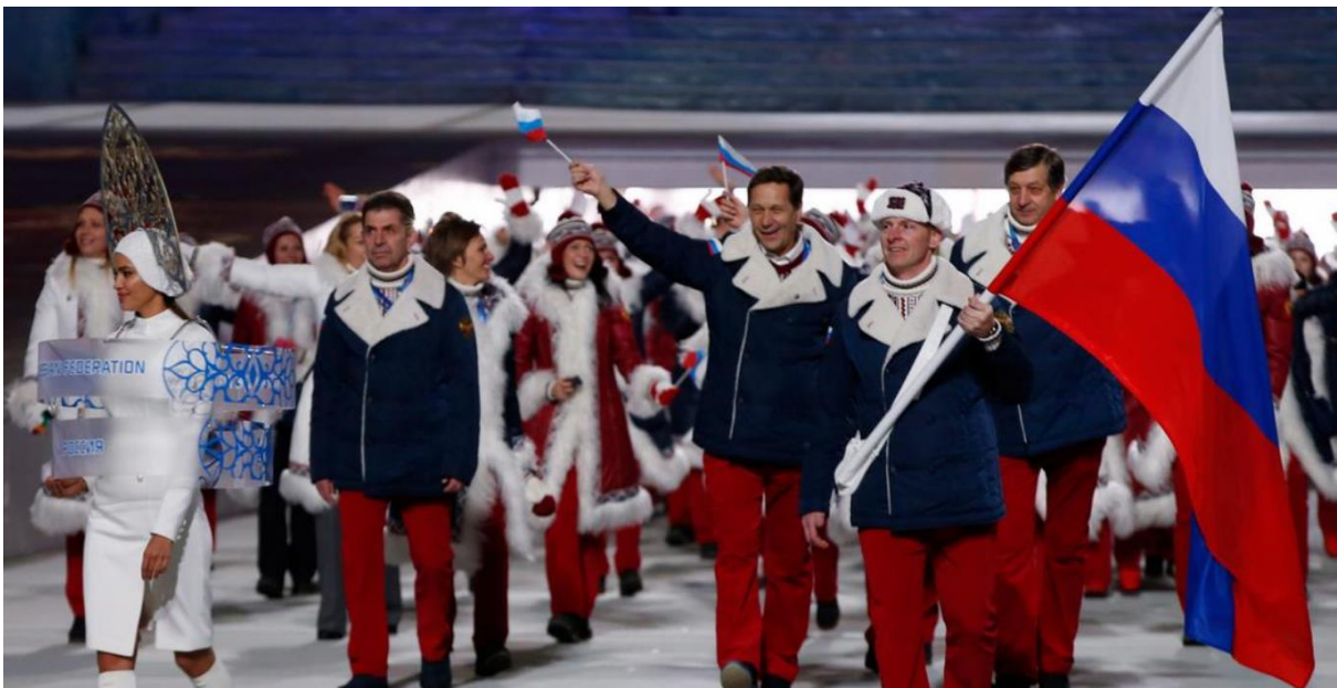
Slika 1. Olimpijske igre 2014. iskoristene su za propagandne svrhe

Iz godine u godinu u zemlji je bilo sve manje slobodnih medijskih glasova: nakon demonstracija u zimu 2011./2012. protiv navodnih izbornih manipulacija na parlamentarnim izborima, pa nakon aneksije Krima i izbivanja rata u Donbasu 2014., ta kontrola je još više pooštrena. I dok su državni mediji propagirali samo službenu retoriku Kremlja, kritički nastrojeni mediji su proglašavani „izdajnicima“ i „agentima“. Uoči Olimpijskih igara 2014. u Sočiju, iz Reportera bez granica je konstatirano da je „neovisno novinarstvo“ u zemlji „borilački sport“. Stoga ne iznenađuje ni to što je istraživanje Zaklade Körber iz 2017. ustanovilo da 76 posto svih anketiranih Rusa smatra da je posao medija da podržavaju vladu u njezinom radu i u provođenju njezinih odluka.