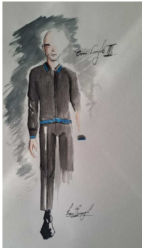
Slika 3: Skica Crnog Čovjeka.

je još jedan jaki kontrast Bijeloj Božici kojoj se pripisala boja sunca – žuta. Crna predstavlja eleganciju, ali nosi se za sprovode, pa tako označava i smrt.