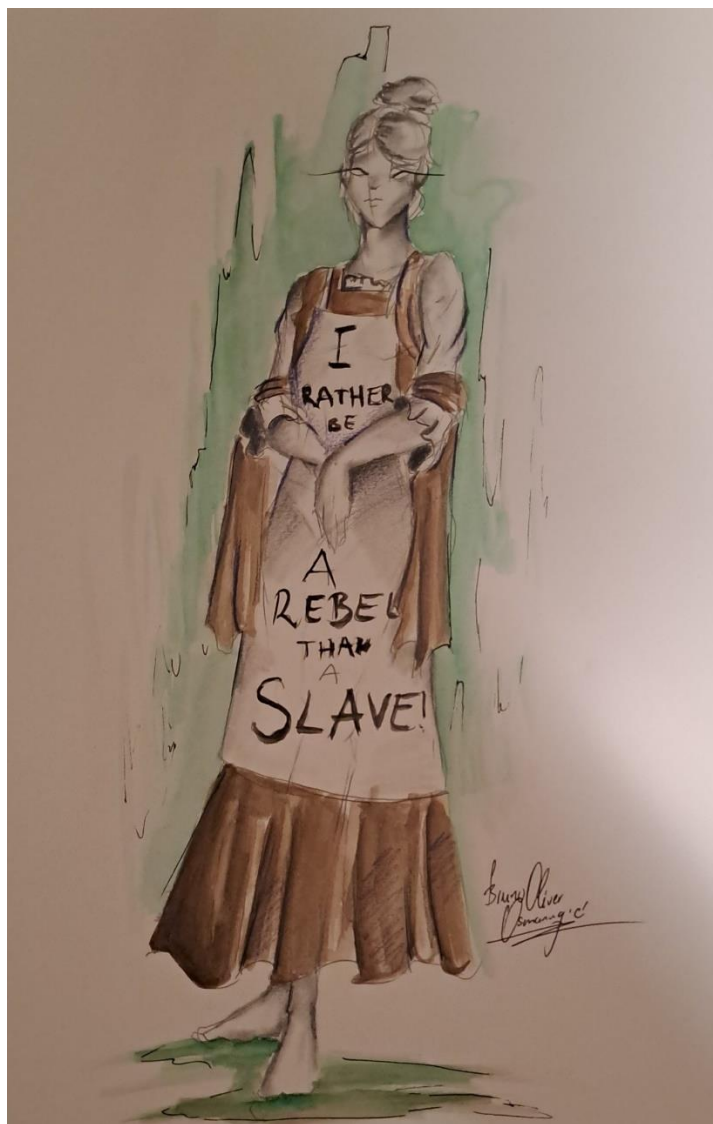
Slika 6: Skica Jenny.

Jenny – za ovog lika odabrana je smeđa boja. To je boja zemlje i jeseni, a prema nekim tumačenjima i umiranja. Označava boju mira i odmora, a mnoge je religije povezuju s propadanjem, umiranjem i truljenjem. Smeđa je boja bitna za ovog lika jer se radnja odvija u prostoru tamnice u kojoj Crni Čovjek muči junakinju koja se pridružila sufražetkinjama u otporu. U odnosu na Crnog Čovjeka koji ima plavu boju i koja označava sigurnost, pa je iz tog razloga policijski službenici nose, Jenny nosi smeđu boju otpora koju su koristili i neki vojnici tijekom Drugog svjetskog rata – odnos je takav da opravdava otpor koji policija pokušava ugasiti. To dobro služi priči jer pomaže poduprijeti povijesnu činjenicu da su sufražetkinje u zatvorima prisilno hranili i mučili, a sve zato što su htjele svoje pravo glasa.