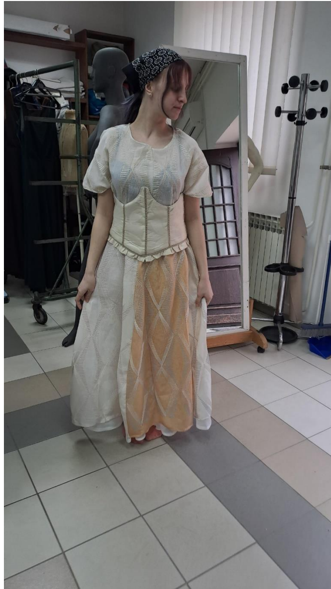
Slika 2: Kostimsko rješenje Bijele Božice.

Crni Čovjek glavni je antagonist priče. Prikaz je zle sile, ali specifično je napisan kao predstavnik negativne muške energije, a može se opisati i kao „ugnjetavač žena“. Njegove su glavne boje crna i plava, kao kontrast bijeloj i žutoj. Plava je, za razliku od žute, hladna boja. Ironično, značenje boje je pozitivno. To je boja harmonije i vjernosti, povezuje se s konceptom mašte i duhovnosti. Isto tako, može ukazivati i na sigurnost i povjerenje. No plava je boja predodređena crnom čovjeku iz razloga što predstavlja noć u kombinaciji s crnom, što