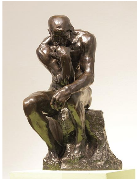
Slika 10. – Auguste Rodin, Mislilac , 1881.-1882., bronca

Pritom primjećuje da simbolika procesa razmišljanja koji želi prikazati, te sjedeća poza u kojoj se često nalazi, podsjećaju na poznatu skulpturu A. Rodina, Mislilac što nije bilo planirano, ali je na kraju stvorilo dodatnu simboliku s temom rada (Slika 10).