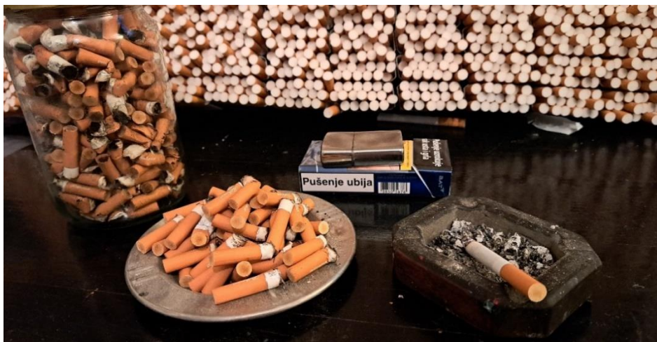
Slika 9. – Ideja za rad – sakupljanje čikova, 2024.

Nastankom ideje trebalo je odabrati i osmisliti formu tj. izgled djela. Nakon dugog razmišljanja i razmatranja raznih opcija, rješenje se zapravo pojavilo samo od sebe, poput trenutka spoznaje! Radi se o sjedećoj pozi u kojoj autor inače provodi većinu dana, dok je za računalom, slika, pije kavu ili radi druge stvari, pri čemu cijelo vrijeme puši. Pokraj sebe uvijek ima malu drvenu pepeljaru koju je autorov djed stolar izradio prije više od 70 godina. Zbog veličine pepeljare, pokraj nje se uvijek nalazi i jedna veća u koju premješta čikove kada se mala napuni. Autor ih ne baca u smeće zbog mogućnosti požara, a s vremenom se i veća pepeljara napuni do vrha. Zbog neugodnog mirisa autor ih je s vremenom počeo stavljati u staklenku sa zatvaračem (Slika 9).