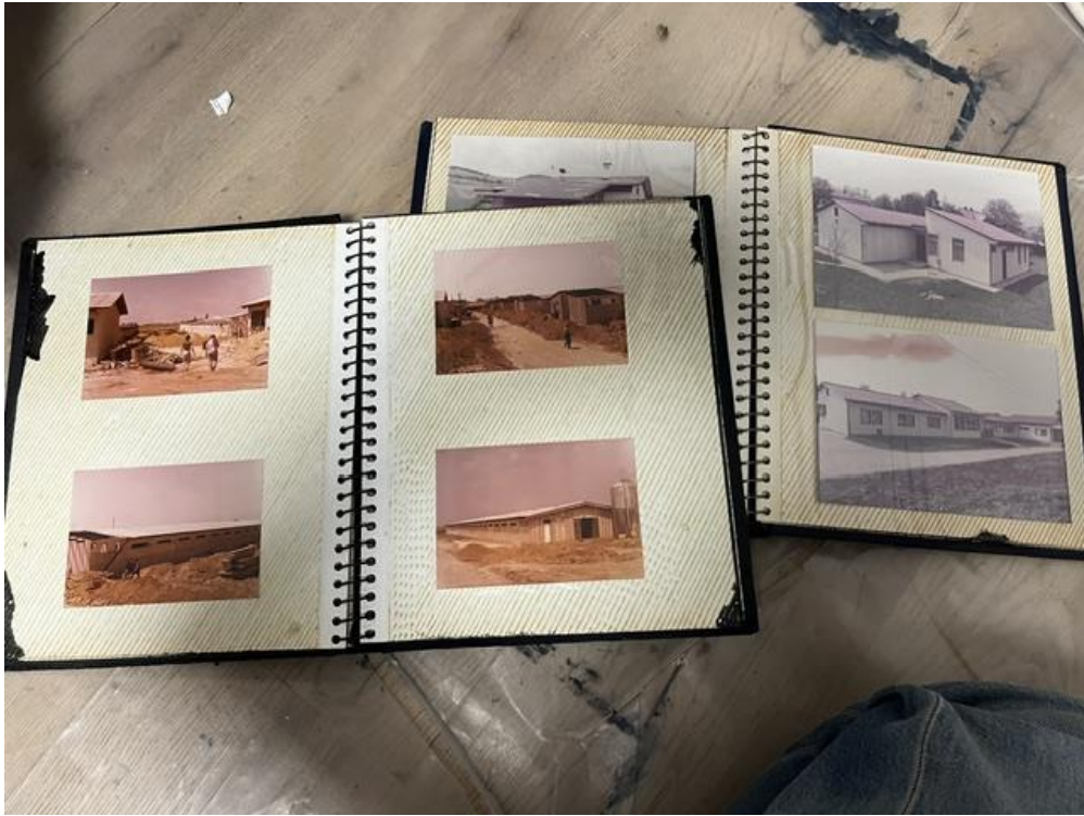
Fotografija fotografskih albuma korištenih za završni rad, Novi Sad, 2023.