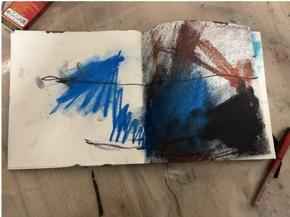
Fotografija skice za završni rad, Novi Sad, 2023.