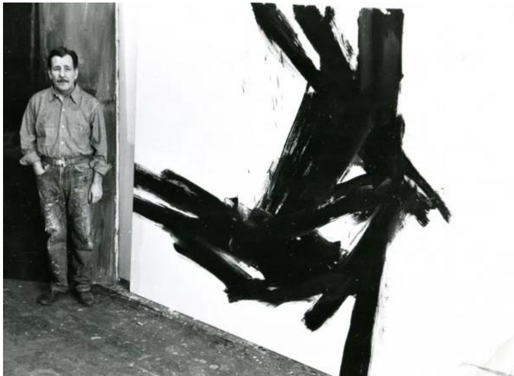
Franz Kline u ateljeu, New York, 1956.